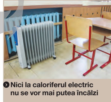
Nici la caloriferul electric nu se vor mai putea încălzi

La Școala Nr. 22 (de lângă parcare a pieței din Micro 19), am