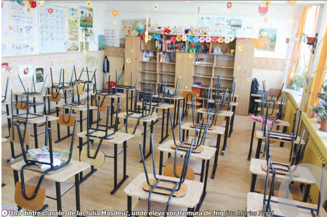
Una dintre clasele de la „Julia Hașdeu”, unde elevii vor tremura de frig