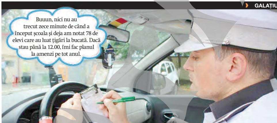
► Poliția veghează la porțile educației