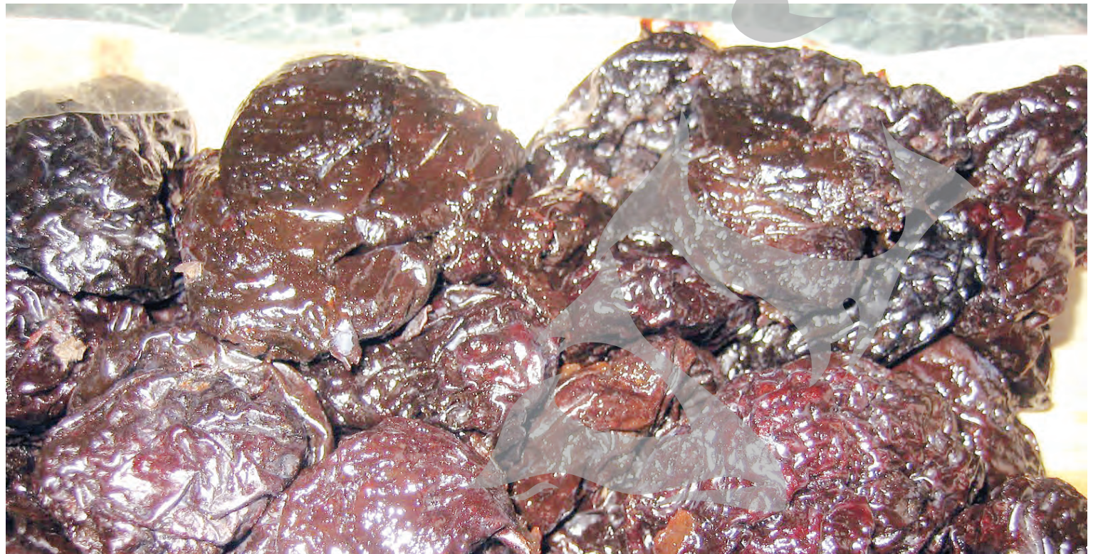
● Prunele uscate sunt un remediu natural, eficient, împotriva problemelor gastrointestinale

ajutorul câtorva mișcări circulare de masaj, seara sau dimineața. De asemenea, poți opta pentru băuturile ce au la bază uleiul din sămburi de struguri, băuturi benefice mai ales pentru ameliorarea tensiunii arteriale. ● R.B.