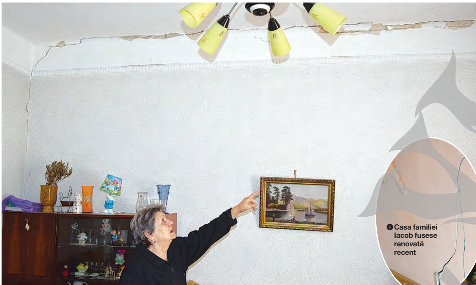
❖ O fisură apărută în casa familiei Hoge se întinde pe tot peretele