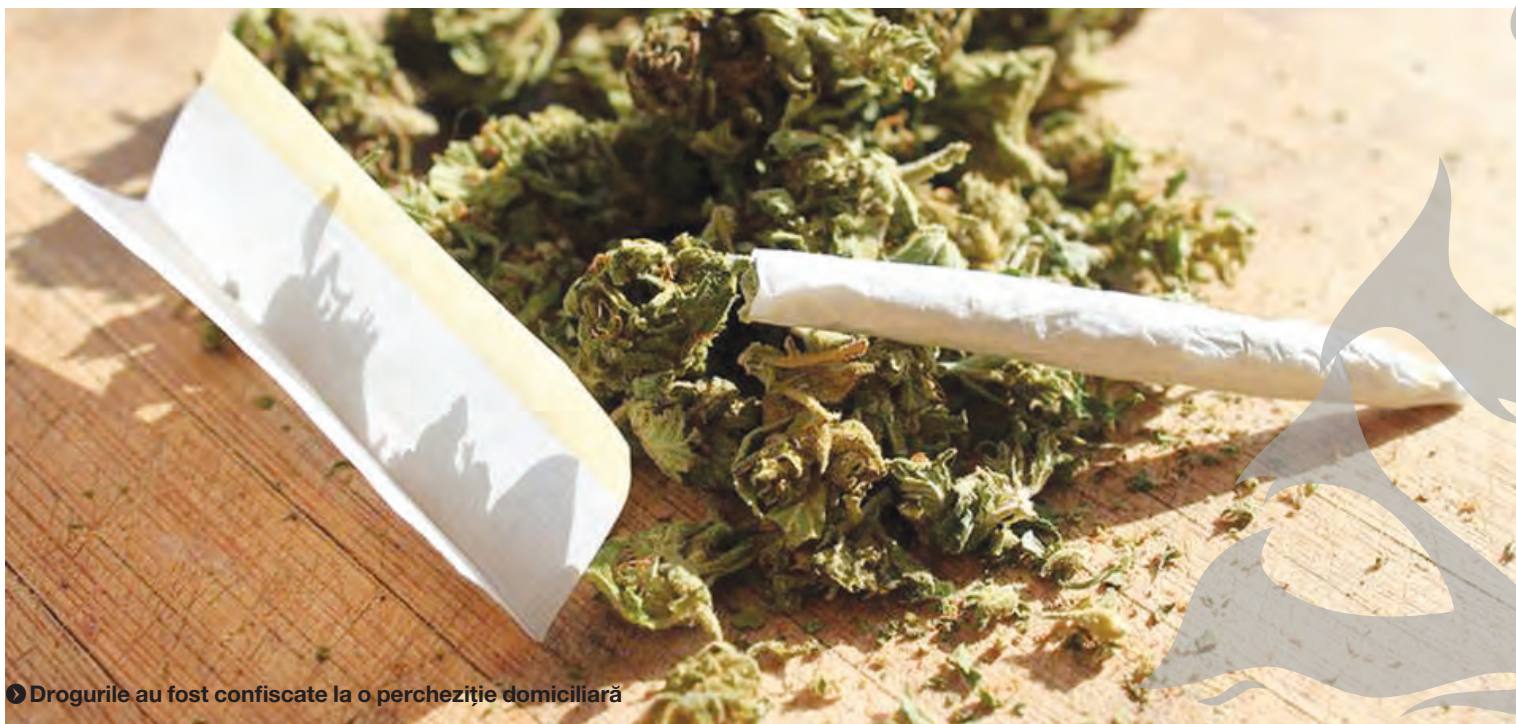
➤ Drogurile au fost confiscate la o percheziție domiciliară

SURPRIZA UNEI ACUZAȚII DE FURT ● ANCHETĂ