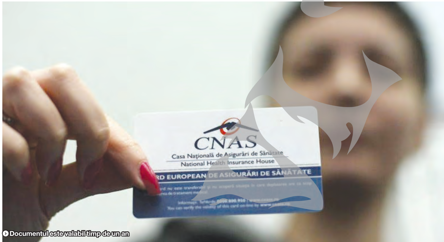
Documentul este valabil timp de un an

- vizare adeverințe și Compartimentul Relații cu Asigurații au program prelungit cu publicul, până la ora 18,00. Pe site-ul http://www.cnas.ro/casgl/ - n.r.), pe care mai apoi o depuneți, alături de o copie după buletin, la sediul CJAS Galați. În locul buletinului, pentru copiii