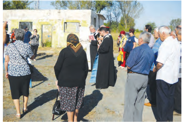
● Și amintirile se mai ruinează în timp....

polițistul. „Nava noastră n-avea voie să acosteze aici!”, a replicat o rudă a unei victime a naufragiului. Fostul anchetator a declarat însă: „Nava nu a acostat aici: de câteva luni, o circulară a Căpitaniei interzisese acostarea în acest loc. Nava mergea direct între Galați și Grindu”. Atunci se lucra pe trei schimburi, în dană dublă. Mă uit, acum nu-i nicio navă – Doamne-Dumnezeule! „De ce a plecat pe ceață?” – o întrebare din grupul îndoliat.