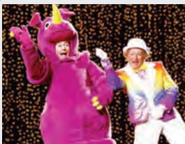
SUA, 2002, comedie, dramă

06:00 Talladega Nights: Balada lui Ricky Bobby 07:50 Domnișoara Sloane 10:00 Rogue One: O poveste Star Wars 12:10 Efectul acvatic 13:35 Tinker Bell: Clopoțica și secretul aripilor 14:50 Planeta comorilor 16:25 Totul despre Steve 18:05 Lumi separate 20:00 Ray Donovan - V, Ep. 4 21:00 Coliziunea 22:40 Pan: Aventuri în Țara de Nicăieri 00:35 Poltergeist 02:30 Ucideți-l pe Smoochy!