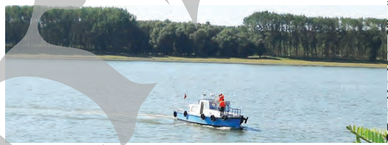
Text și foto Victor Ciilincă

Tot mai împuținată an de an, doar o mână de oameni a fost prezentă și sâmbătă, 9 septembrie, la Monumentul vasului „Mogoșoaia” din Port Bazinul Nou, la Mîla 79, nu departe de locul în care nava de pasageri s-a scufundat în ceața dimineții de 10 septembrie 1989 și unde, de pe o șalupă, au fost aruncate în valuri coroane de flori... ● pag. 14