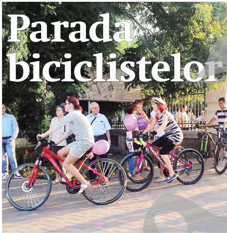
● Biciclistele ajunse la capătul traseului

ALINA MARIA ȘERBAN alina.serban@viata-libera.ro Galațiul a fost duminică gazda unui eveniment inedit, aflat deja la a doua ediție. SkirtBike 2017 a reunit anul acesta 200 de doamne și domnișoare gata să pornească la drum pe bicicletele colorate din dotare. Pe tot parcursul traseului, de la Păpădie la Grădina Publică, fetele au zâmbit și s-au simțit bine, îmbinând distracția cu mișcarea într-un mod util și frumos. Tematica aleasă a fost mari-