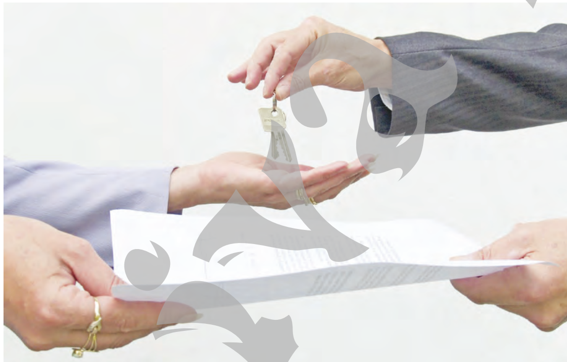
Uzucapiunea imobiliară este modalitatea de dobândire a proprietății asupra unui bun imobil

Cererea trebuie însoțită în mod obligatoriu de o serie de documente prevăzute în mod expres în Codul de Procedură Civilă. În vederea dovedirii acestei situații, reclamantul va trebui să propună și administrarea probei testimoniale cu cel puțin doi martori. ●