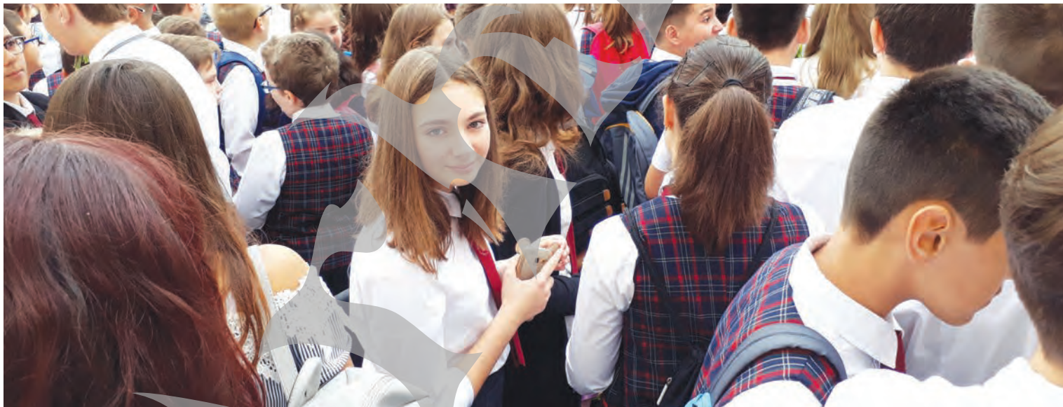
● La Școala Nr. 28, curtea a fost plină ochi de copii, părinți și profesori

de școală la Liceul „Racoviță“ a fost pentru el în urmă cu 41 de ani, vârsta instituției, el fiind absolvent al primei promoții. I-a sfătuit pe elevi să îndrăznească să aibă planuri ambițioase în legătură cu școala, dar să se și distreze, pentru că e o perioadă unică, ce trebuie trăită cum se cuvine. Totodată, le-a dat și vești bune elevilor de excepție: „De anul acesta, olimpicii naționali sau internaționali sunt stimulați cu un grant de 3.500 de euro să se înscrie în universități din România. De asemenea, ei mai pot primi 3.500 de euro pentru proiecte de cercetare, la care se pot înscrie maximum cinci studenți, dintre care unul trebuie să fie olimpic“, a precizat ministrul Cercetării. ●