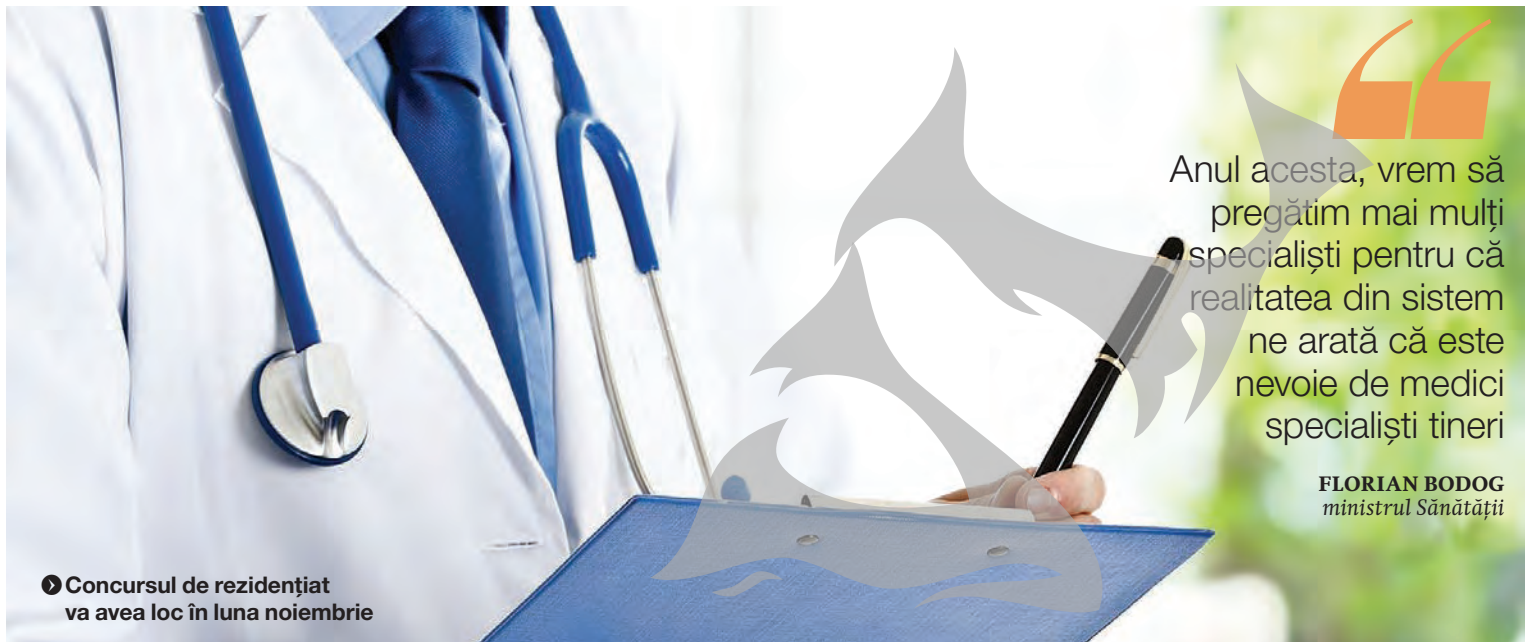
● Concursul de rezidențiat va avea loc în luna noiembrie

ESTE NEVOIE DE SPECIALIȘTI TINERI ÎN SPITALE ● PREMIERĂ