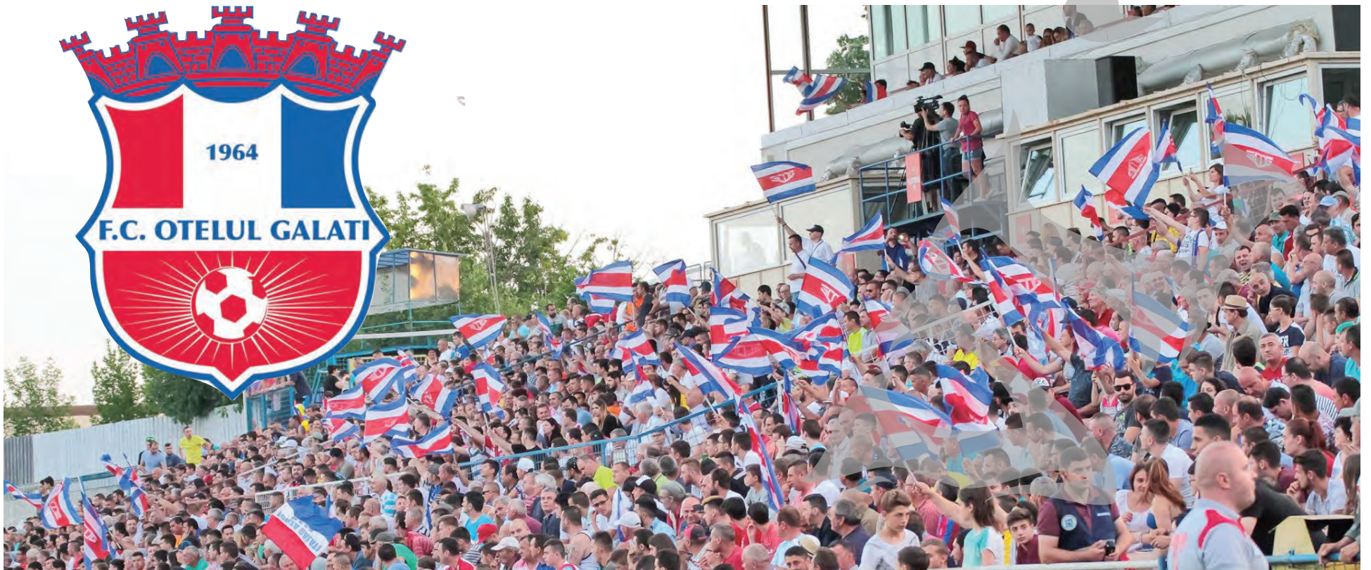
Oțelul poate folosi și sigla din momentul câștigării titlului de campion a României (2011)