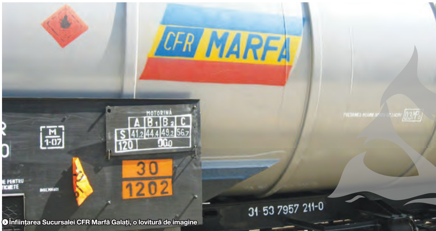
► Înființarea Sucursalei CFR Marfă Galați, o lovitură de imagine