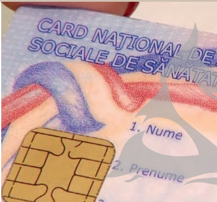
► În ultimii doi ani, mii de asigurați au solicitat carduri duplicate

De asemenea, în ultimii doi ani, 10.846 de asigurați din județul Galați au solicitat carduri de sănătate duplicate, după ce au pierdut sau au distrus documentul original. De asemenea, cardul de sănătate duplicat este necesar și când titularul și-a schimbat datele personale imprimate pe acest document. În asemenea situații, tipărirea unui nou card se face contra unei taxe de 15 lei.