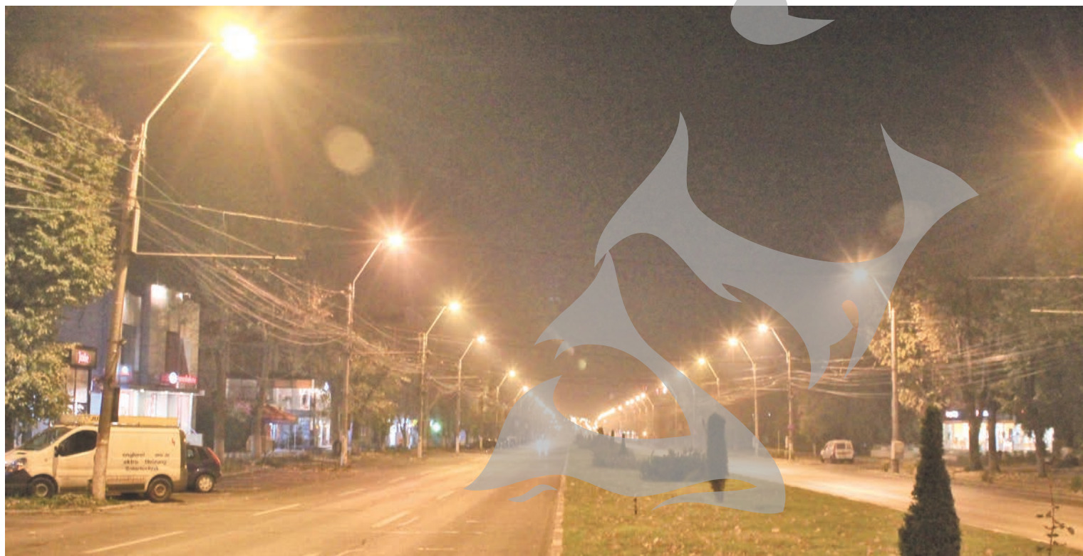
LICITAȚIA PENTRU MENTENANȚA ILUMINATULUI, CONTESTATĂ ● BLOCAJ