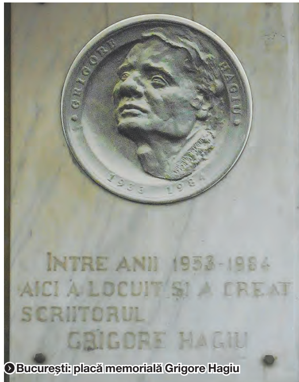
● București: placă memorială Grigore Hagiu

dintr-un bloc situat pe strada Oltului, tulburând astfel liniștea locatarilor și provocând totodată indignarea acestora. După ce i s-a spus să oprească muzica, tânăra a fost amendată cu suma de 1.000 de lei. ● T.M.