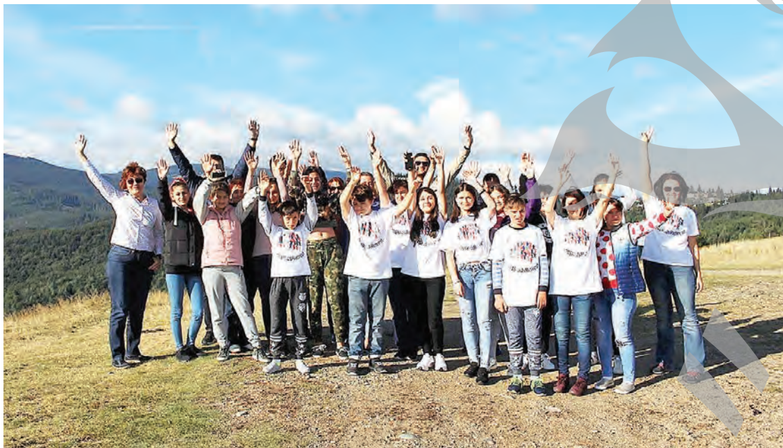
● În România există, în momentul de față, 25 de copii incluși în Programul Național de Tratament

Programul, ce s-a desfășurat pe parcursul a trei zile, a asigurat într-un mod informal cadrul pentru a afla informații în ceea ce privește înțelegerea bolii și a felului în care poate fi gestionată, suportul psihologic pentru scurtarea perioadei de negare, furie și până la acceptarea diagnosticului și sprijinul moral al comunității de SM. În plus, programul le-a propus copiilor și o serie de activități distractive.