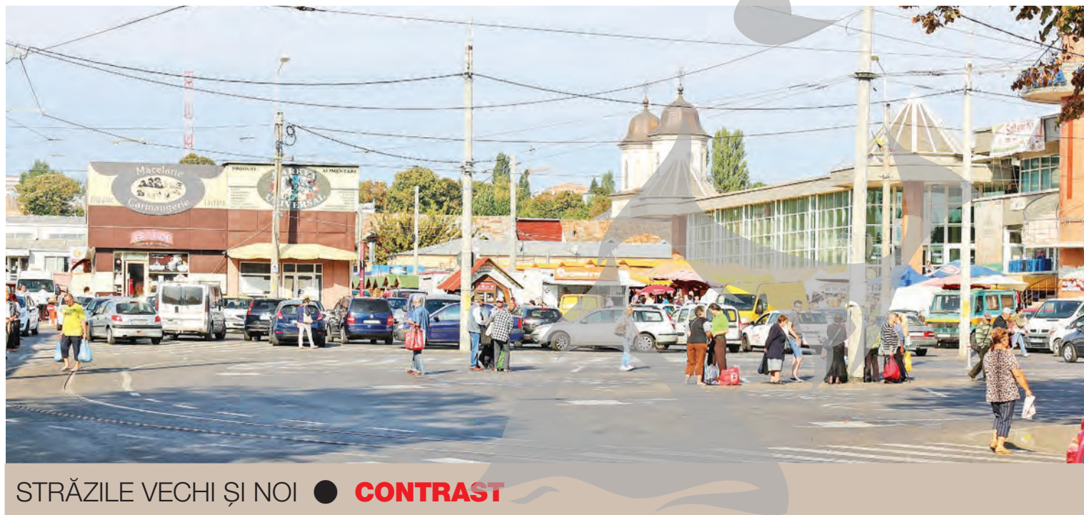
STRĂZILE VECHI ȘI NOI ● CONTRAST

Actualmente, acest lucru nu pare a-i mai deranja pe oameni, pentru că în imediata apropiere a stației de autobuze și tramvaie se află trei toaile noi, curate, menite să deservească nevoile... urgente ale trecătorilor. ● F.R.