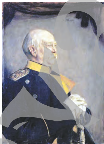
➤ Portret de Franz von Lenbach

Treptat, până în anul 1871, Bismarck a reușit să unifice toa-