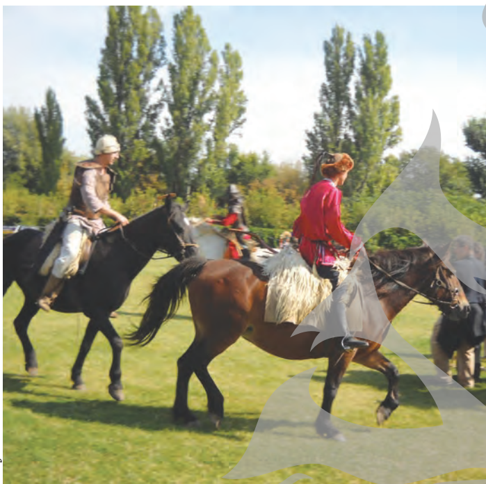
► Călăreții de la Cluj au călărit desăvârșit

ANUL ACESTA, UNII BARBARI AU RĂMAS ACASĂ ● STRĂLUCITOR