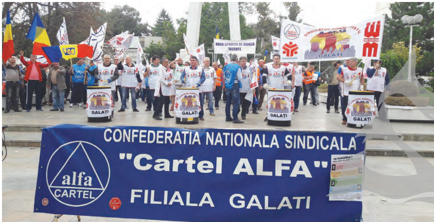
► Tobe, steaguri și fluieri la protestul Cartel ALFA

PRIMELE PROTESTE SINDICALE CONTRA TRANSFERULUI CONTRIBUȚIILOR SOCIALE ● PICHETARE