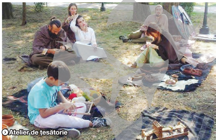
► Atelier de țesătorie

ganizată de Direcția Județeană pentru Cultură Galați, Primăria Municipiului Galați și Asociația „Tinerii și Viitorul” Galați, în colaborare cu Complexul Muzeal de Științele Naturii din Galați și Universitatea „Dunărea de Jos”. ●