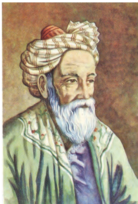
● Omar Khayyam, poetul dragostei

NEREGULI. 1.044 este numărul exact al sancțiunilor contravenționale cu care au fost pedepsiți în ultimele șapte zile participanții la trafic. 295 au fost șoferii care au depășit limita legală de viteză, iar 204 conducători auto au fost sancționați pentru lipsa centurii de siguranță. Traversarea neregulamentară s-a soldat cu amenzi pentru 253 de pietoni, în timp ce 26 de șoferi au fost prinși neacordând prioritate. În 42 de cazuri, șoferii au fost amendați pentru depășiri neregulamentare, iar în 11, pentru forme ușoare de conducere sub influența alcoolului. Valoarea totală a amenzilor aplicate depășește 200.000 de lei, peste 90 de permise fiind suspendate. Polițiștii rutieri au constatat și patru infracțiuni, punând sub acuzare trei persoane pentru conducere fără permis și una pentru conducere sub influența alcoolului. ● M. Constandache