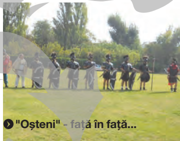
► „Oșteni” - față în față...

„predat” lecții despre echipament, tehnici de luptă (de pildă, „testudo” – țestoasa, din scuturi, împotriva săgeților). Fără alternanțe și fond sonor și un scenariu oarecare, lecția s-a cam lungit, picioarele spectatorilor având și ele părerea lor. Cine a rămas a putut admira treceri în revistă ale „trupelor” și apoi înfruntări, inclusiv între cavalerie și infanterie, sau cu arcași. Publicul a fost chiar „atacat” de romani, dar n-a fost nevoie de intervenția celor de la firma de pază și a poli-