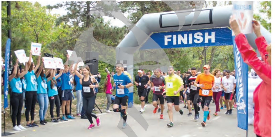
● Participanții s-au bucurat de o zi frumoasă