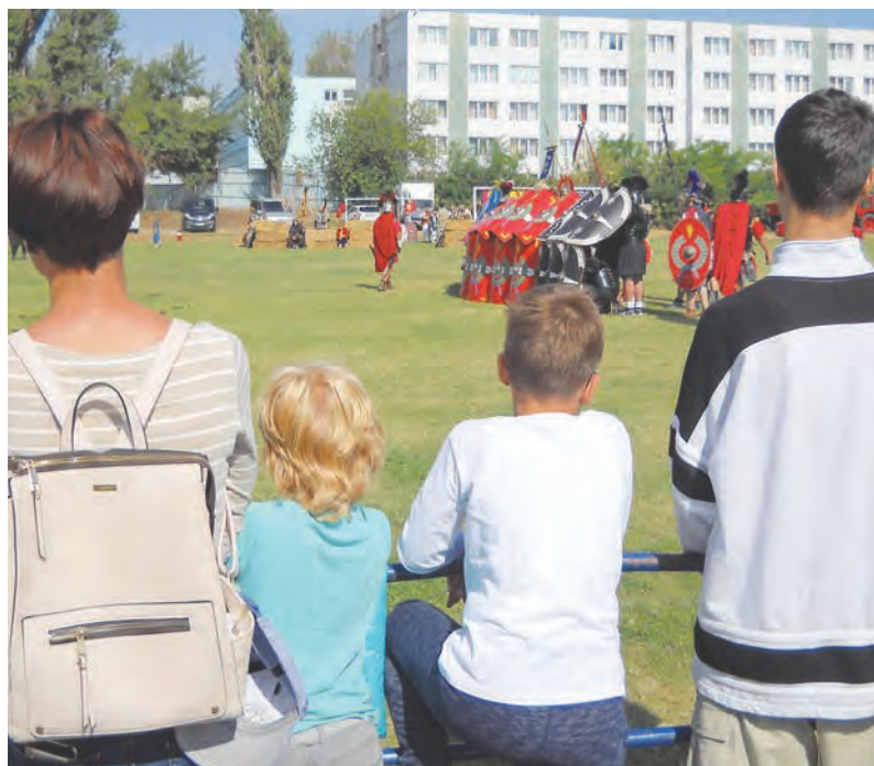
► „Lecția” în aer liber