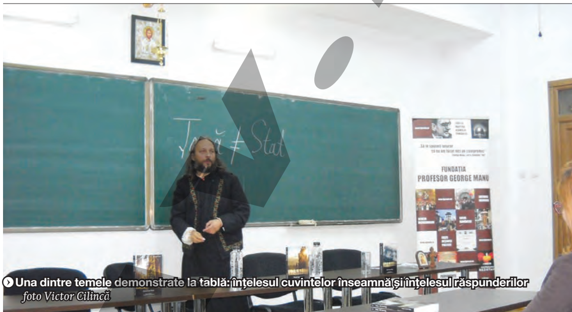
● Una dintre temele demonstrate la tablă: înțelesul cuvintelor înseamnă și înțelesul răspunderilor