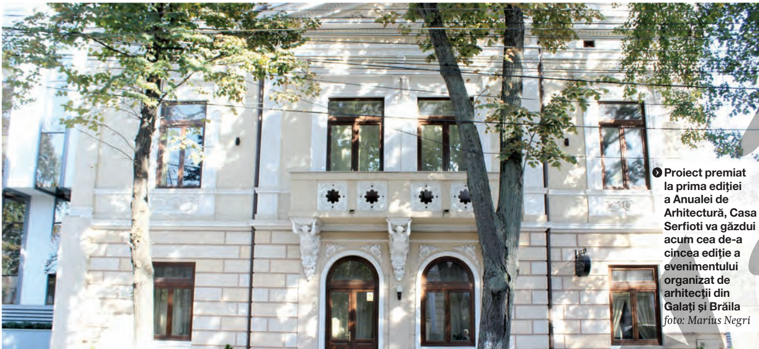
Proiect premiat la prima ediției a Anualei de Arhitectură, Casa Serfioti va găzdui acum cea de-a cincea ediție a evenimentului organizat de arhitecții din Galați și Brăila

ANUALA DE ARHITECTURĂ "CASA MICĂ - CASA CUIB" ● PROIECTE