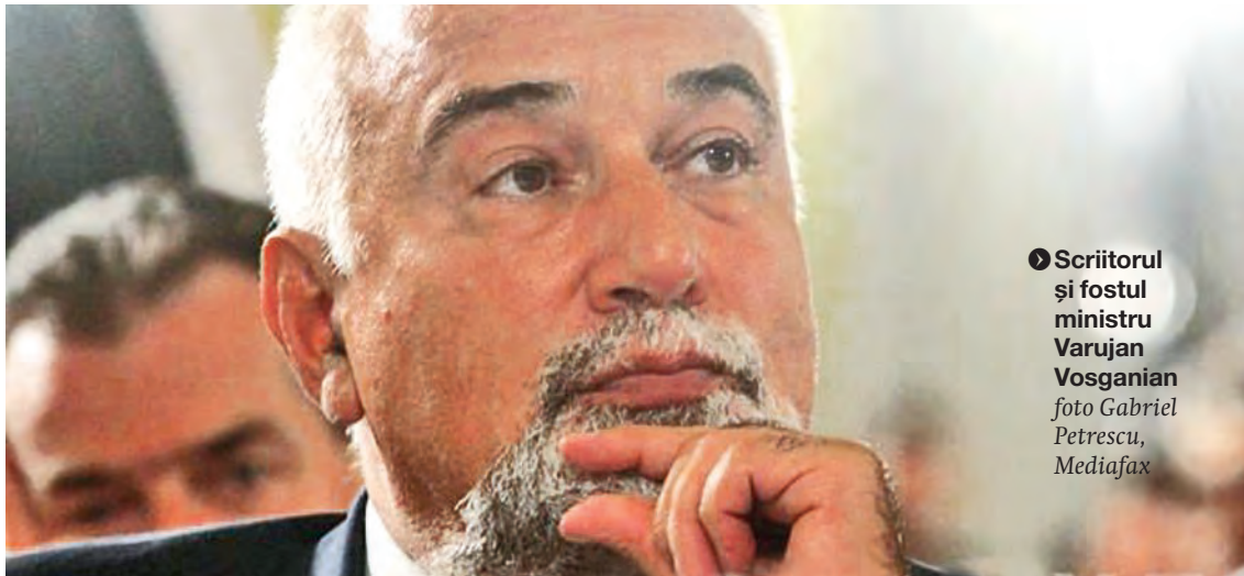
● Scriitorul și fostul ministru Varujan Vosgianian