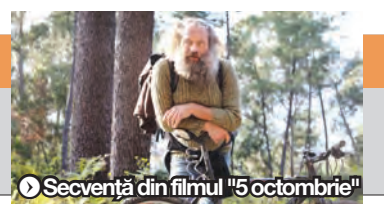
● Secvență din filmul „5 octombrie”