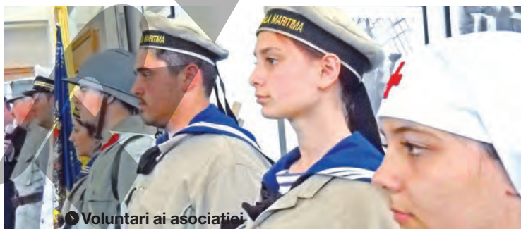
● Voluntarii ai asociației

Astăzi, 5 octombrie, în curtea Muzeului Istoriei, Culturii și Spiritualității Creștine de la Dunărea de Jos, str. Domnească nr. 141, de la ora 11,00, va avea loc un eveniment cu totul mișcător, pentru cei care știu să înțeleagă emoția trecutului. Sub titlul „Scrisori din tranșee... Un crâmpie de nemurire”, voluntarii de la Asociația Tinerii și Viitorul, înveșmântați în uniforme de acum un veac, de pe câmpurile noastre de luptă, vor citi fragmente din scrisori reale pe care cei căzuți