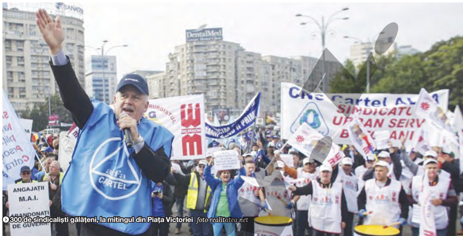
● 300 de sindicaliști gălățeni, la mitingul din Piața Victoriei

aeronaute. Angajații de la Tarom, care ar putea fi disponibilizați, nu vor mai primi 18 salarii compensatorii, ci în jur de opt salarii, potrivit noului Contract Colectiv de Muncă, a informat ministrul Transporturilor. ● C.D.