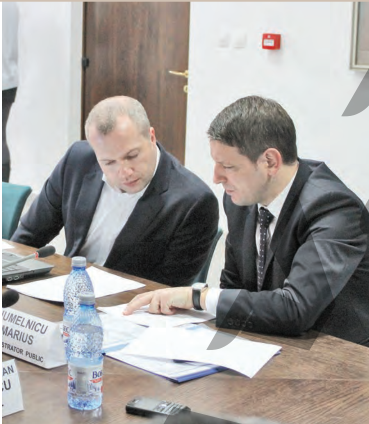
► La nivelul lunii iunie, cuantumul net al veniturilor încasate de administratorul public era de 6.256 de lei