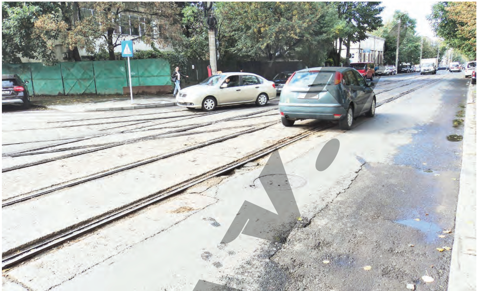
► Linile de tramvai de pe strada Basarabiei vor deveni amintire dacă proiectul de modernizare va fi realizat