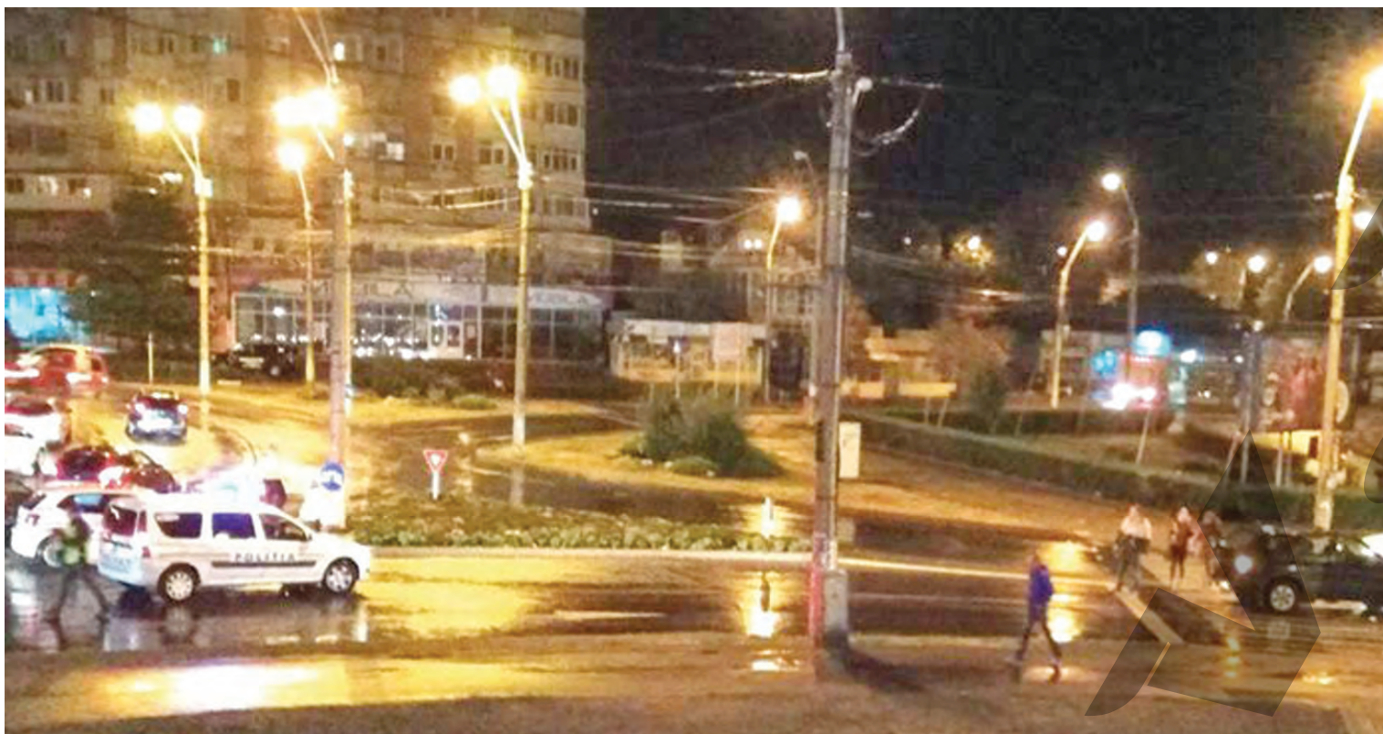
● Accidentul de la Ultimul Leu a paralizat traficul rutier

RECORD DE VICTIME PE CAROSABIL ● ALARMANT