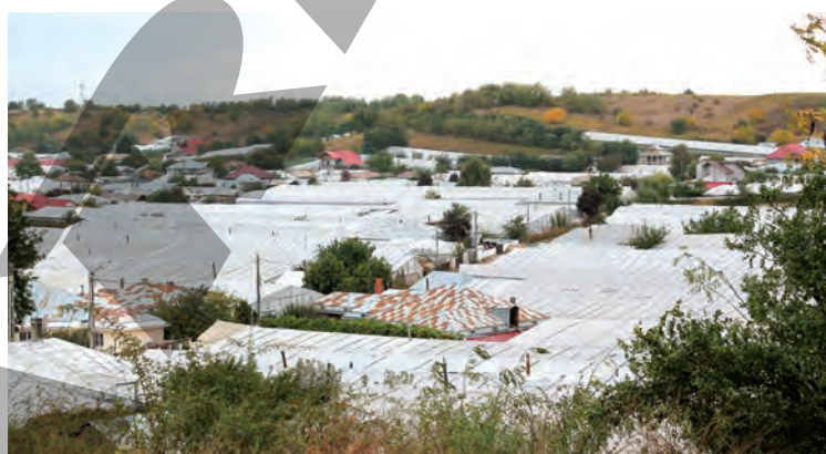
► O parte din solarele din Matca

- Neîncrederea. La început, au fost păcăliți de oameni veniți din exterior și de atunci au mers într-un val de negativism. În consecință, ne aflăm efectiv de unde am plecat. ●