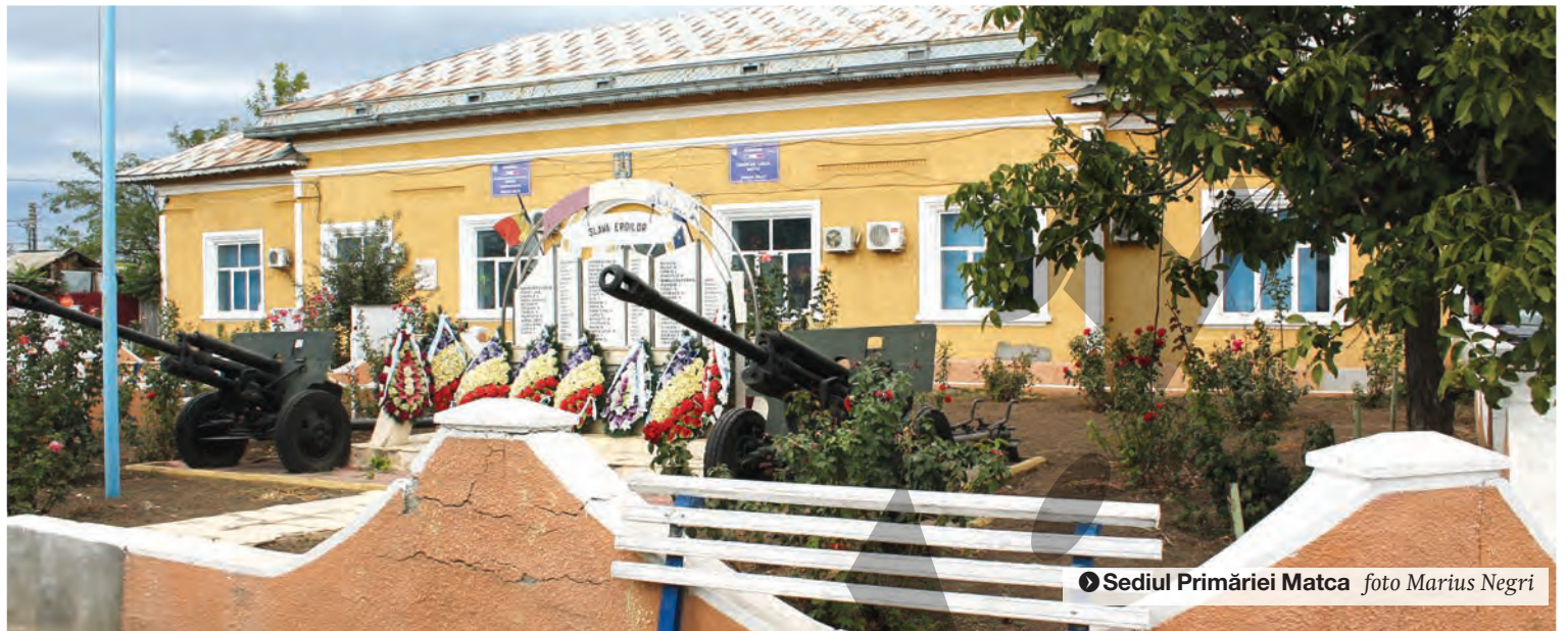
Sediul Primăriei Matca

PÂNĂ ACUM, ÎNCERCĂRI FĂRĂ SUCCES ● INVESTIȚIE