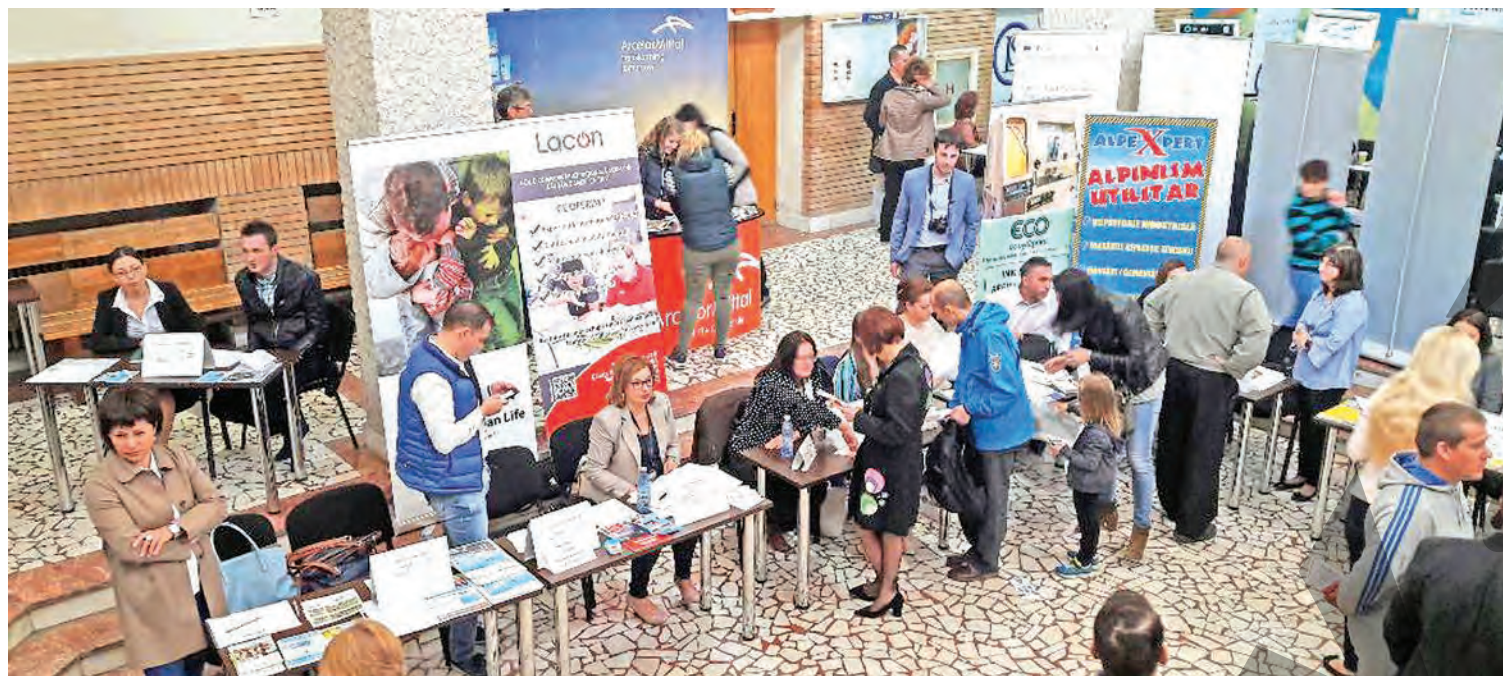
● Imagine de la Bursa pentru absolvenți de vineri

TE DUCI LA REPARTIȚIE SAU ÎȚI PIERZI „ȘOMAJUL” ● AJOFM