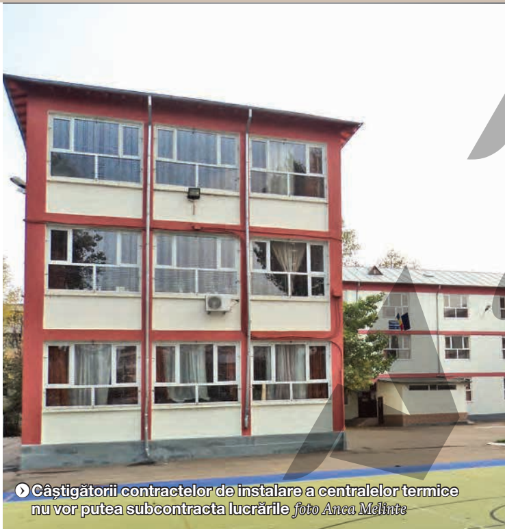
► Câștigătorii contractelor de instalare a centralelor termice nu vor putea subcontracta lucrările

Firma Primo SRL a câștigat, atât în asociere, cât și de una singură, instalarea centralelor termice la trei loturi de școli. În asociere cu Tancred, firma va monta centrale la grădinițele cu program normal Nr. 27 și 44, la grădinițele cu program prelungit Nr. 30 și „Voinicelu” și la școlile gimnaziale Nr. 9 și 5. În schimb, se va ocupa singură de lucrări la Liceul Tehnologic „Anghel Saligny”, la școlile gimnaziale „Mihail Sadoveanu”, „Sf. Împărați”, „Dan Barbilian” și Nr. 10, și la grădinițele cu program normal Nr. 11 și „Lizuca”.