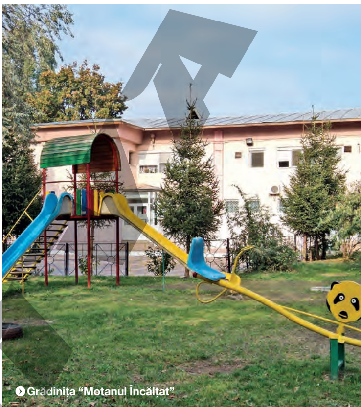
► Grădinița „Motanul Încălțat”