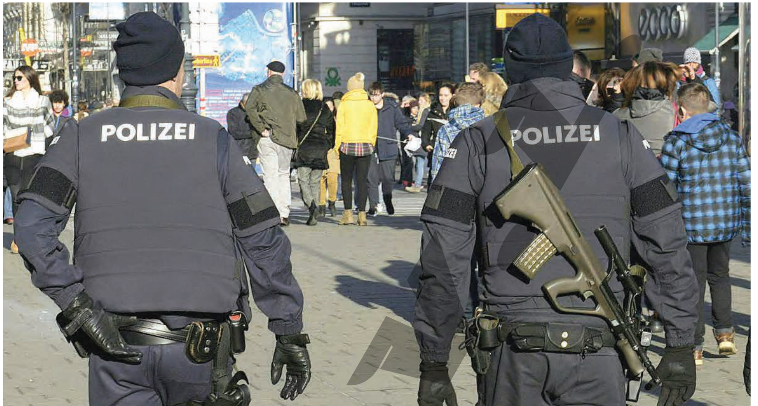
● Românilor a primit îngrijiri la fața locului

UN INDIVID A ATACAT CU UN CUȚIT ● CERCETĂRI