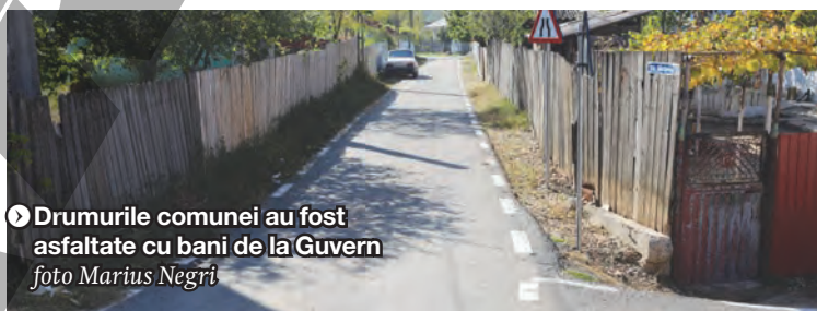
Drumurile comunei au fost asfaltate cu bani de la Guvern

„Am trecut proiectul de două ori prin comisia tehnico-economică a Ministerului Dezvoltării. Nici nu vă imaginați peste ce funcționari dădeam! Cu țigara și cafeaua în mână, mă tot întrebau: «Da' de ce?». Până când i-am întrebat dacă sunt români! Și le-am spus că eu vreau să terminăm cu praful și noroiul la țară!”, spune primarul. Și subliniază că două dintre drumuri, care duc din satul Slobozia Blâneasa și, respectiv, satul Negrilești, către platoul agricol, au o infrastructură specială, tip autostradă, ca să reziste sub camioanele și utilajele agricole: „Toate veniturile comunei se realizează prin aceste două drumuri, care merg către platoul agricol de 4.000 de hectare”.