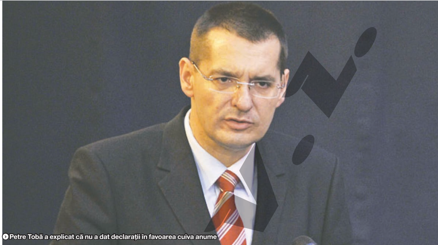
● Petre Tobă a explicat că nu a dat declarații în favoarea cuiva anume