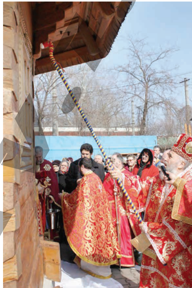
◆ Sfințirea bisericii din lemn

Asociația amintește că s-a implicat și în alte inițiative în orașul nostru, contribuind la ridicarea Monumentului de la Cimitirul „Eternitatea” dedicat memoriei victimelor închisorilor politice, lagărelor de muncă și ale deportărilor. La inițiativa organizației, a fost construită, din lemn, sfințită în luna martie, Biserica Memorial din Țiglina 3, în stil maramureșean, donată în 2011 Arhiepiscopiei. „Conform Pisaniei, biserica este ridicată «în cinstea fericiților întru adormire eroi, ostași și luptători români, din toate timpurile și din toate locurile, care s-au jertfit pe câmpurile de luptă, în lagăre și în închisori pentru apărarea patriei și a credinței ortodoxe strămoșești, pentru întregirea