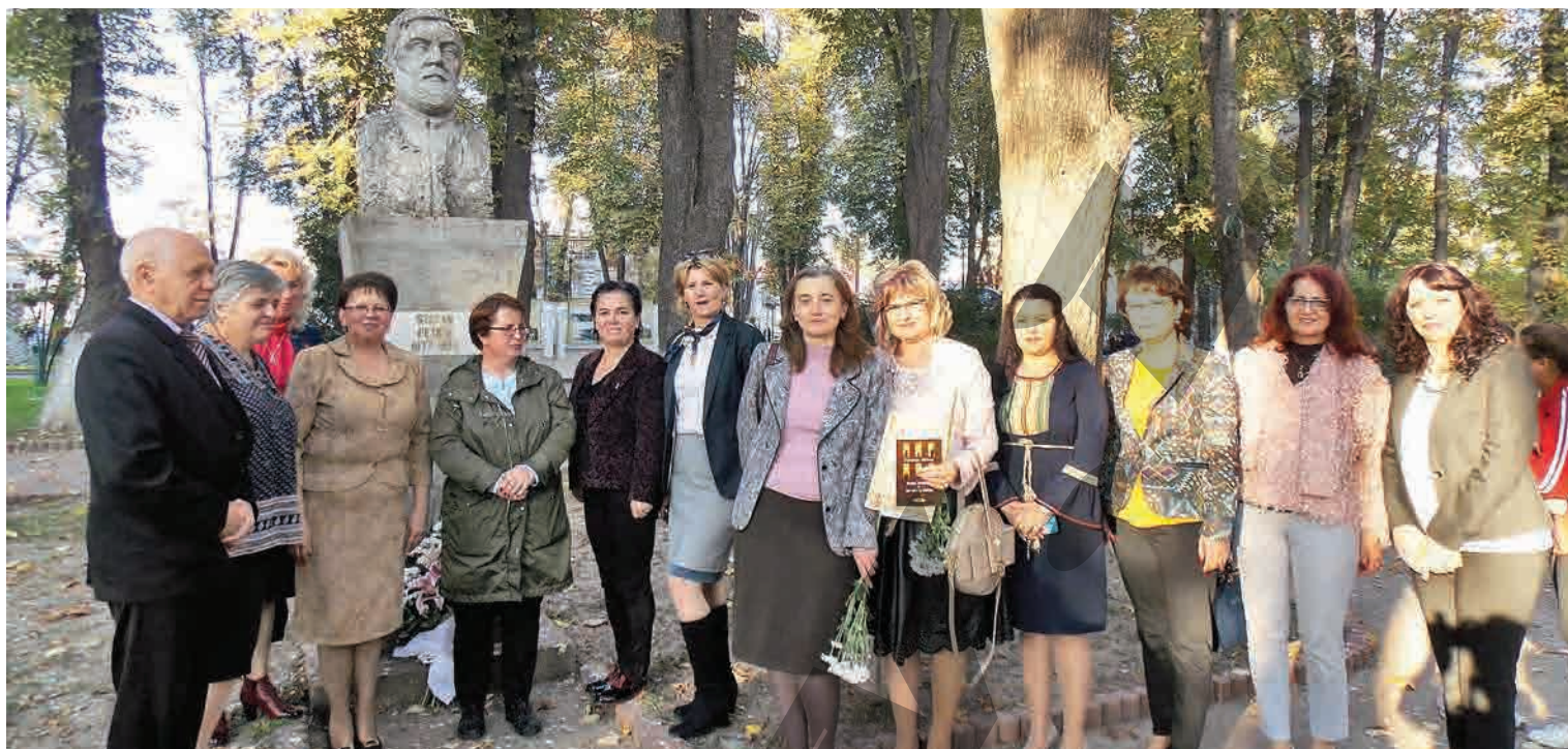
BIBLIOTECA „ȘTEFAN PETICĂ” DIN TECUCI, LA CEAS ANIVERSAR ● PREMIU

Bătrân căzut în șanț, în Port Bazinul Nou