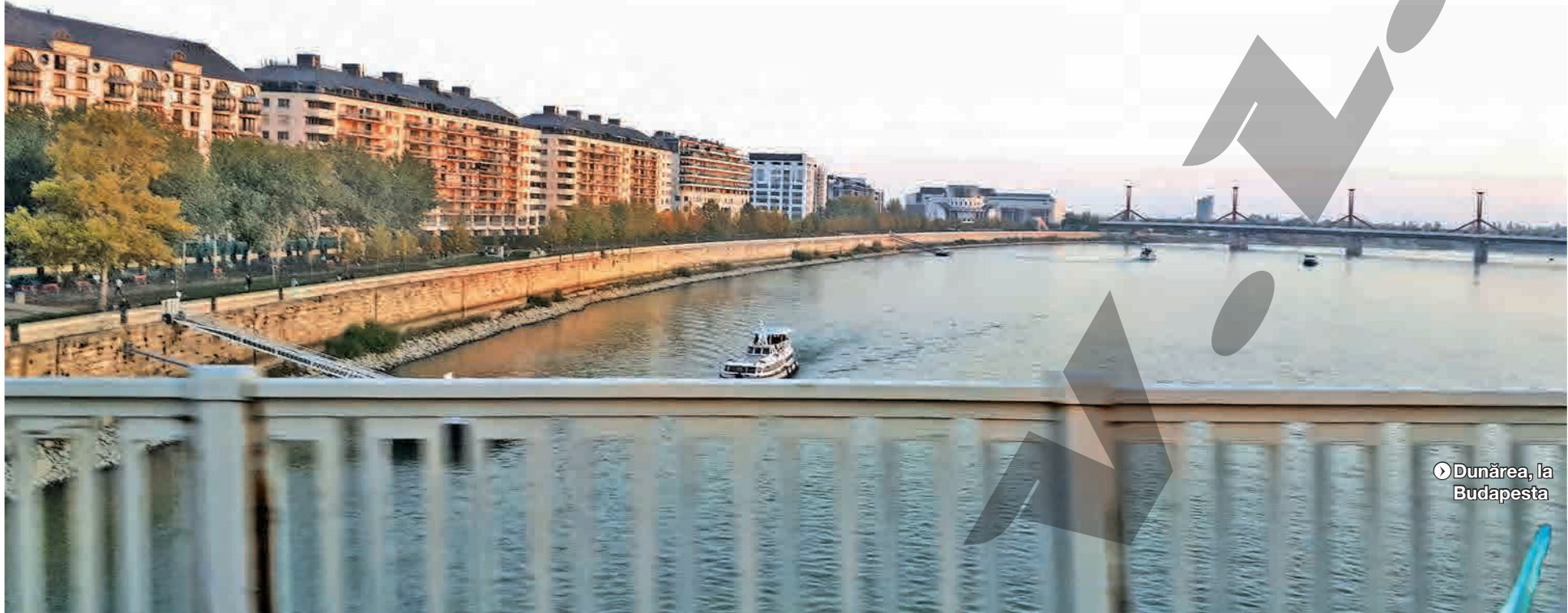
► Dunărea, la Budapesta