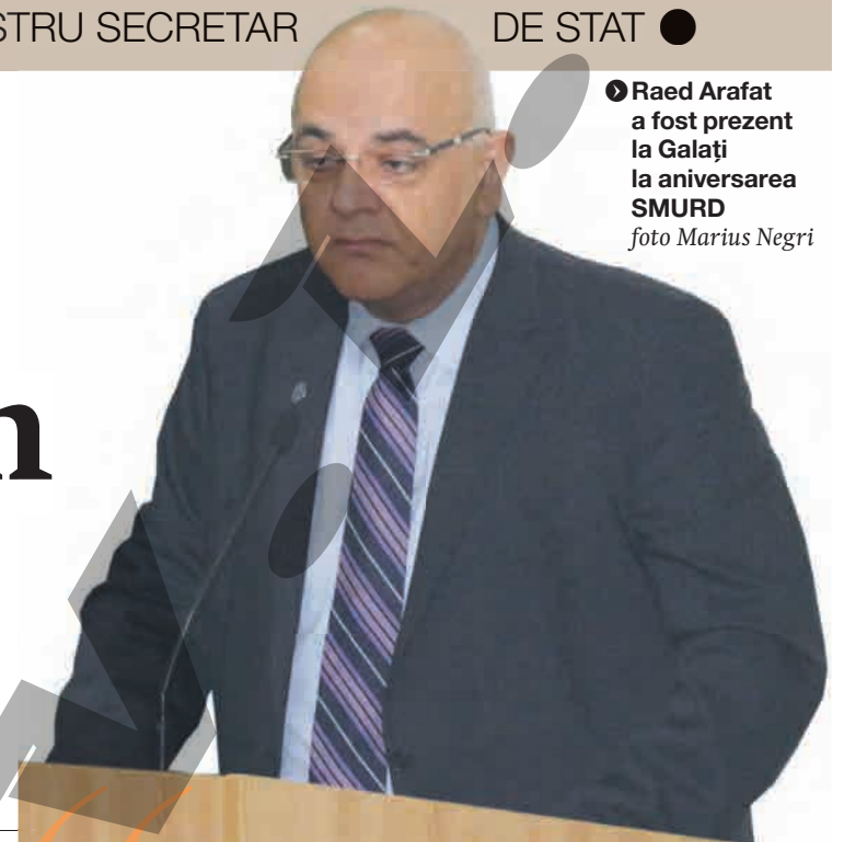
● Raed Arafat a fost prezent la Galați la aniversarea SMURD

La fiecare exercițiu, descoperim câte ceva nou care trebuie corectat în modul nostru de lucru. Deci astea sunt parte din pregătiri, este normal și trebuie să vă îngrijorați dacă spunem că totul este perfect și nu trebuie să facem nimic. Din moment ce ne vedeți că ne pregătim, că facem videoconferințe, că discutăm cu oamenii și îi întrebăm care este stadiul de pregătire, că verificăm în teren, înseamnă că suntem chiar pe calea cea bună și înseamnă că ne interesează să ieșim cât mai bine din aceste situații