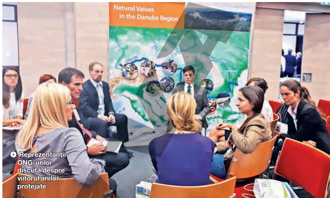
▶ Reprezentanții ONG-urilor discută despre viitorul ariilor protejate

DANUBEPARKS. Rețeaua a fost lansată în 2007, odată cu semnarea Declarației de la Tulcea, în România. DANUBEPARKS și DANUBEPARKS 2.0 au fost primele două proiecte comune lansate în cadrul rețelei. Activitatea lor acoperă cinci domenii: ameliorarea morfologiei fluviale, gestionarea câmpiilor inundabile și a rețelelor de habitate, conservarea principalelor specii dunărene aflate în pericol (codalbul și sturionul), monitorizarea și desfășurarea de activități în rețeaua UE de arii protejate Natura 2000, precum și turismul în natură. Un deceniu de activitate a dat rezultate. În 2015, rețeaua DANUBEPARKS a câștigat premiul Natura 2000 al UE, pentru cooperarea sa ambițioasă, prietenoasă și de încredere peste toate frontierele. Inițial, rețeaua număra opt membri, acum are 20, din Austria, Bulgaria, Croația, Germania, Ungaria, Republica Moldova, România, Serbia și Slovacia. Împreună, aceștia pun în valoare caracteristicile naturale unice care atrag zilnic mii de vizitatori, motiv pentru care turismul este vital pentru misiunea DANUBEPARKS. Oamenii sunt din ce în ce mai conștienți că turismul nu reprezintă doar o sursă de venit, ci are și obligația de a proteja patrimoniul natural al Dunării. ● S.A.M.