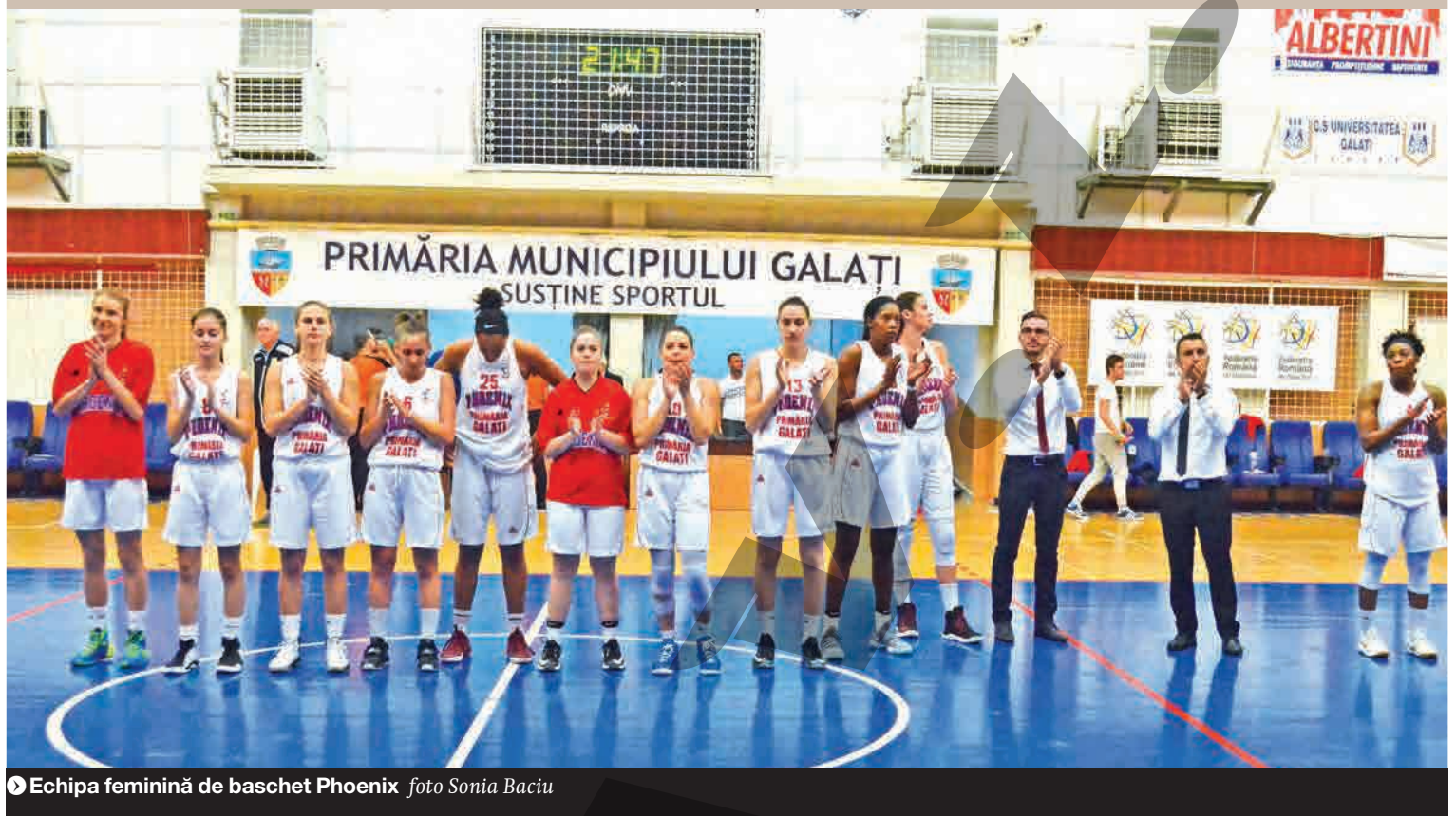
● Echipa feminină de baschet Phoenix