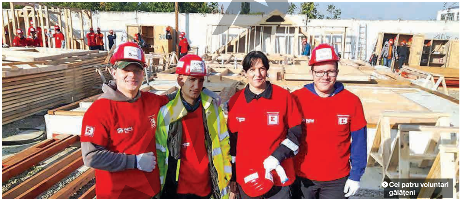
► Cei patru voluntari gălățeni