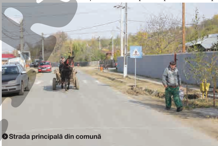
● Strada principală din comună