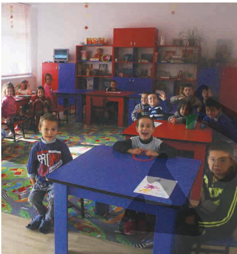
Una dintre grupele de la grădiniță

PRIMĂRIA, MÂNDRĂ DE INVESTIȚIE ● REALIZARE