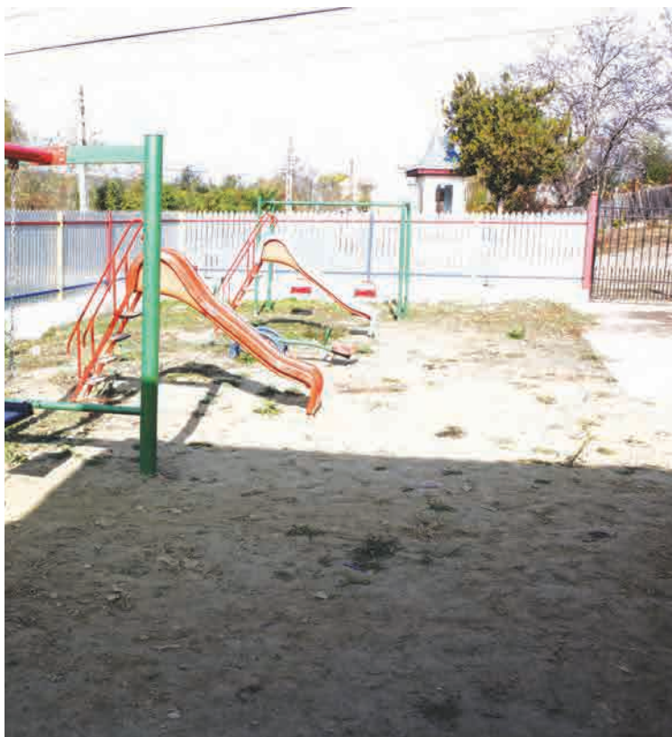
Locul de joacă din curtea grădiniței