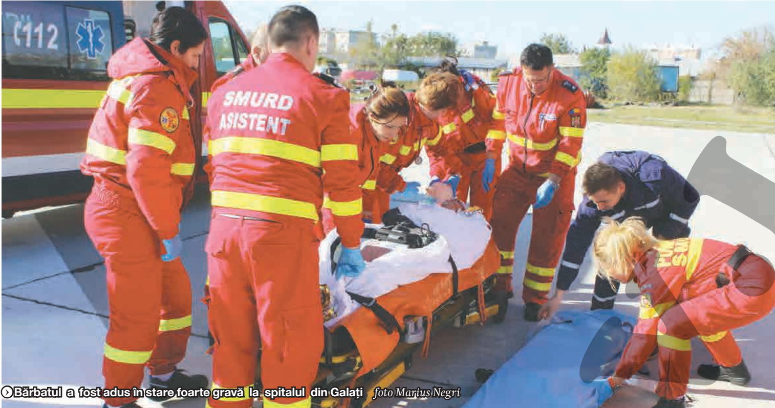
► Bărbatul a fost adus în stare foarte gravă la spitalul din Galați