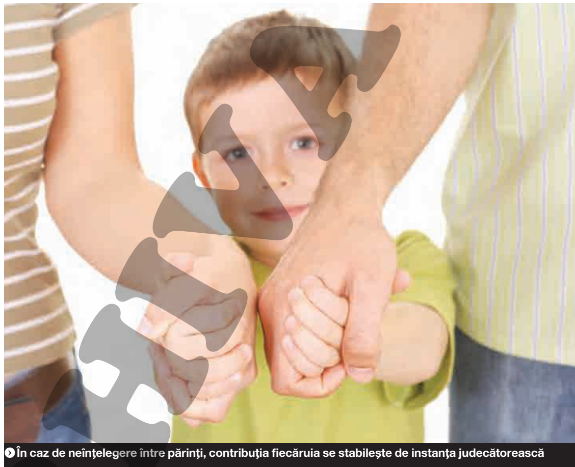
● În caz de neînțelegere între părinți, contribuția fiecăruia se stabilește de instanța judecătorească

Dacă părintele obligat la plata pensiei de întreținere stabilită pe cale judecătorească refuză, cu rea-credință, să o achite timp de trei luni, persoana îndreptățită poate formula plângere penală împotriva sa, pentru săvârșirea infracțiunii de abandon de familie. Această infracțiune se pedepsește cu închisoare de la șase luni la trei ani sau cu amendă. ● Eugen Mortu - judecător Tribunalul Galați