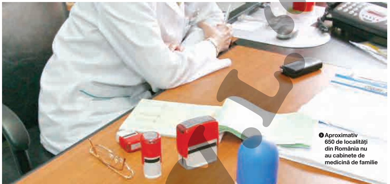
● Aproximativ 650 de localități din România nu au cabinete de medicină de familie