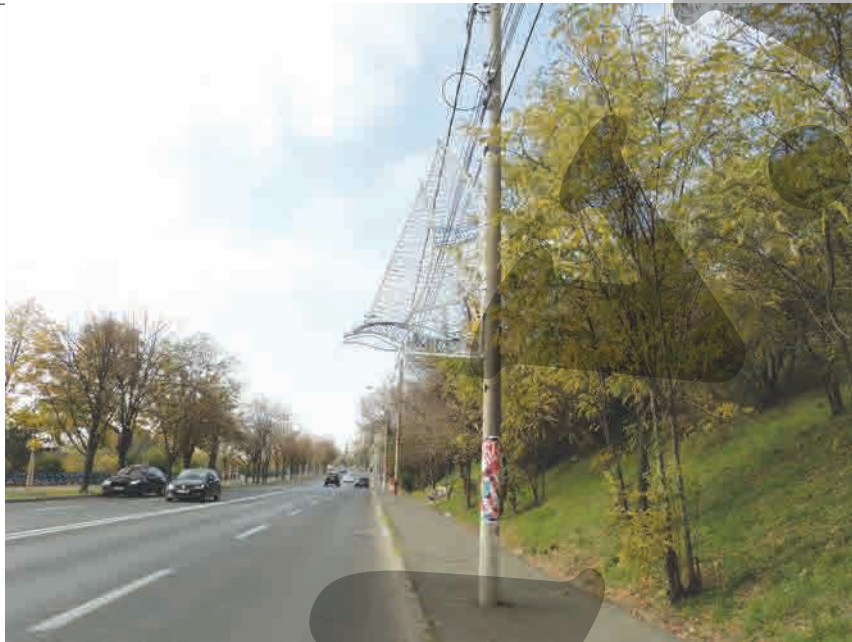
● Strada Nicolae Bălcescu e gata de sărbătoare