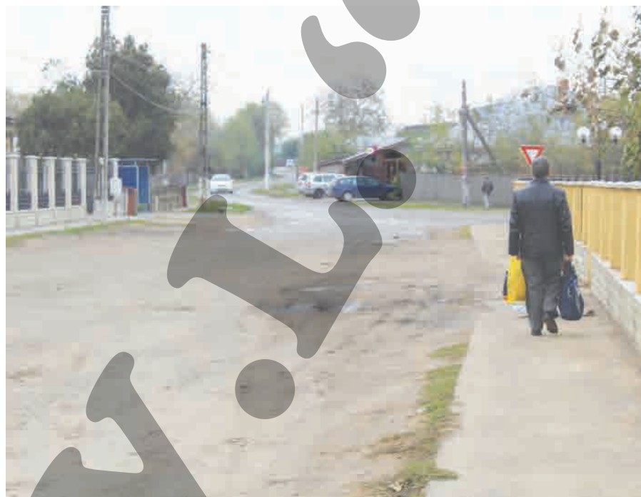
● Asfaltarea drumurilor mai așteaptă până la anul

PRINTRE PRIMELE COMUNE DIN JUDEȚ ● EFICIENȚĂ