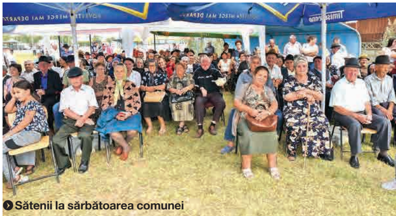
● Sătenii la sărbătoarea comunei