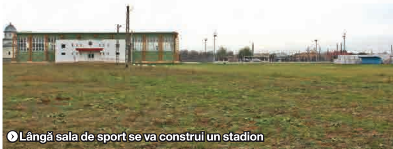
● Lângă sala de sport se va construi un stadion