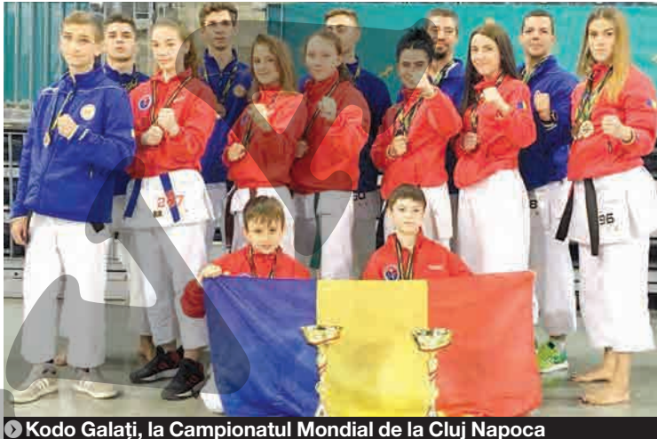
► Kodo Galați, la Campionatul Mondial de la Cluj Napoca