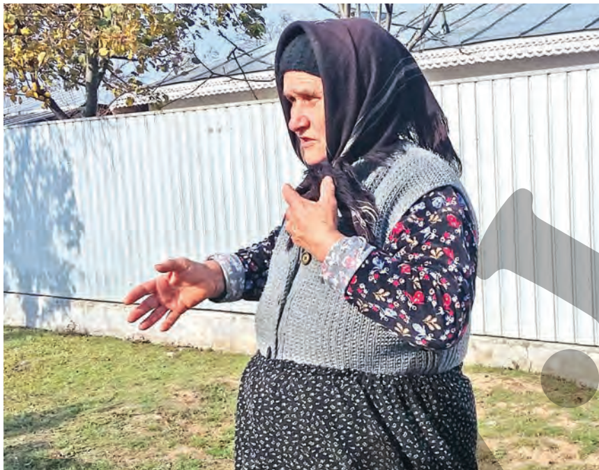
Mama bărbatului ucis și abandonat pe marginea drumului