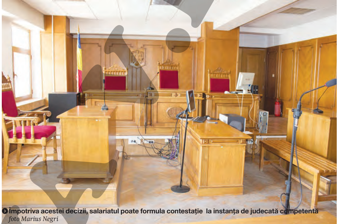
► Împotriva acestei decizii, salariatul poate formula contestație la instanța de judecată competentă

Împotriva acestei decizii, salariatul poate formula contestație