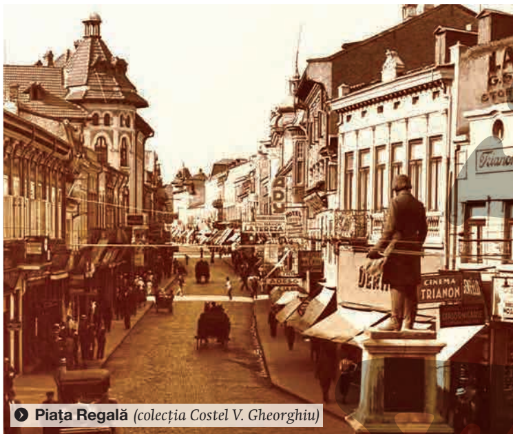
➤ Piața Regală (colecția Costel V. Gheorghiu)