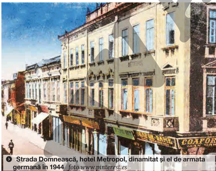
➤ Strada Domnească, hotel Metropol, dinamitat și el de armata germană în 1944