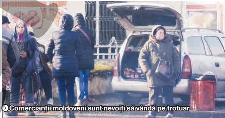
● Comercianții moldoveni sunt nevoiți să vândă pe trotuar

Băltoace, praf, mașini și multă aglomerație. De asta m-am lovit încă de la primii pași făcuți. De cum ajungi pe trotuar, începi să fii ademenit de către comercianții care nu mai conțin în a-și lăuda produsele.