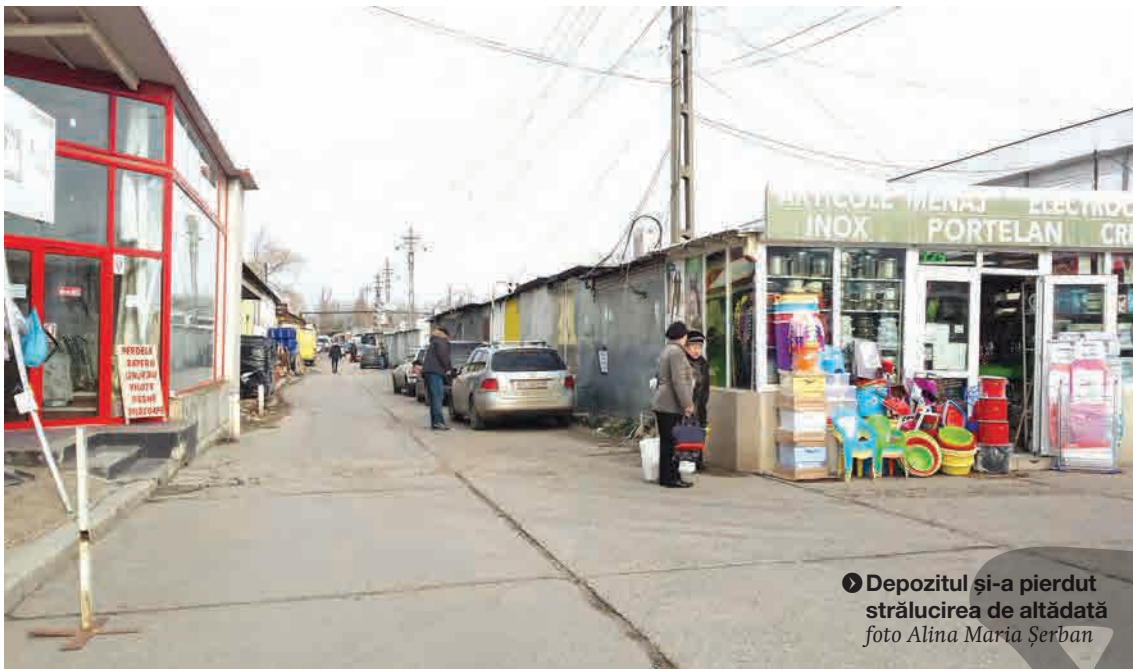
● Depozitul și-a pierdut strălucirea de altădată