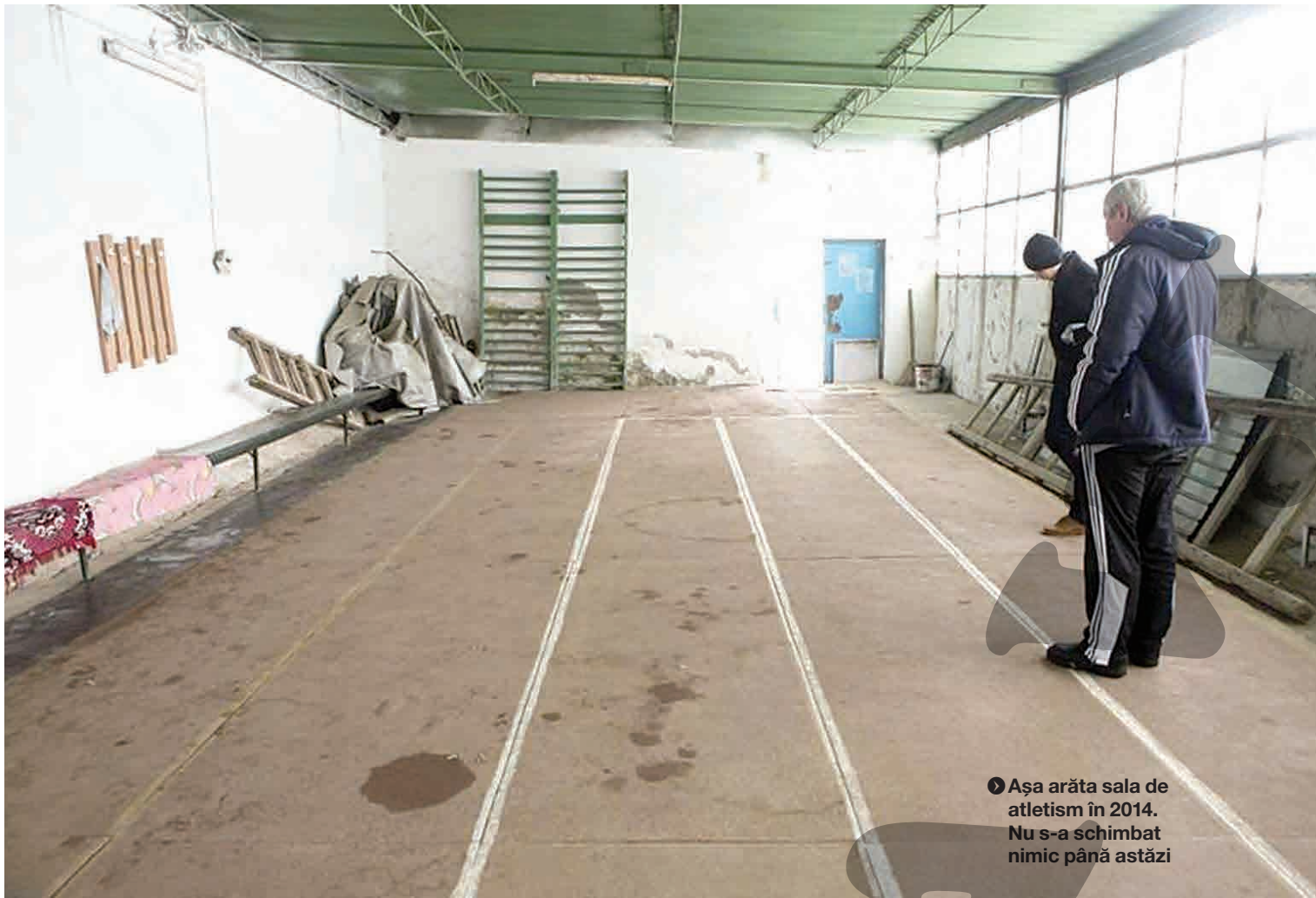
➤ Așa arăta sala de atletism în 2014. Nu s-a schimbat nimic până astăzi