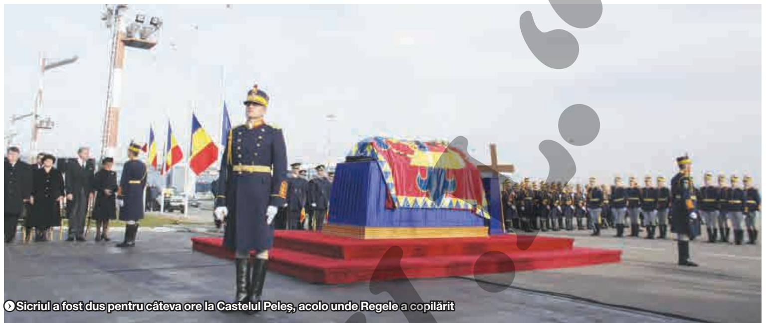
❶ Sicriul a fost dus pentru câteva ore la Castelul Peleş, acolo unde Regele a copilărit

PROCESIUNI IMPRESIONANTE LA AEROPORT ȘI LA PELEȘ ● FUNERALII