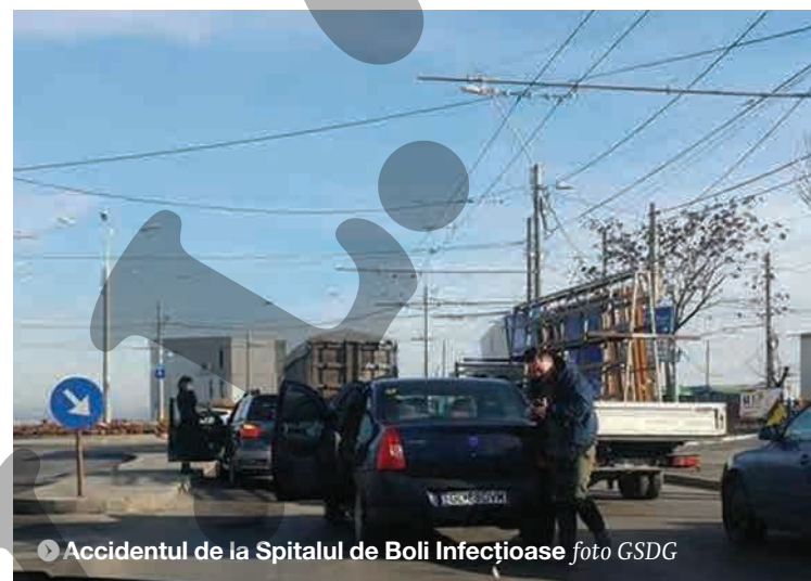
▶ Accidentul de la Spitalul de Boli Infecțioase

MARIANA CONSTANDACHE mariana@viata-libera.ro