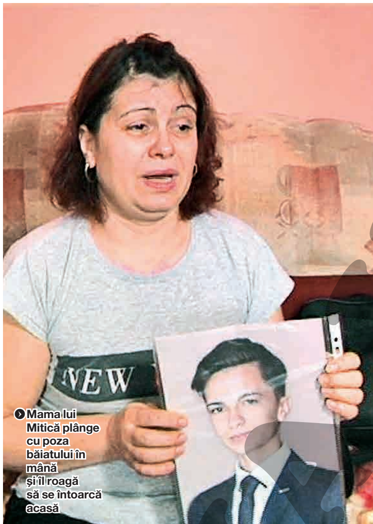
► Mama lui Mitică plânge cu poza băiatului în mână și îl roagă să se întoarcă acasă