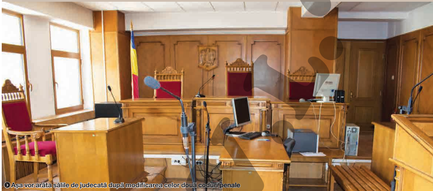
➤ Așa vor arăta sălile de judecată după modificarea celor două coduri penale

DACĂ SE MODIFICĂ CODURILE PENALE ● IREAL