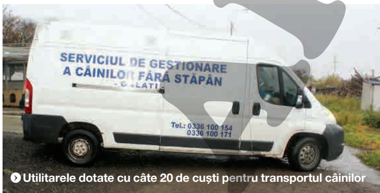
► Utilitățile dotate cu câte 20 de cuști pentru transportul câinilor

rea și hrănirea maidanezilor în cele două padocuri a fost cerută chiar de Serviciul Public Ecosal. În raportul de specialitate al proiectului se arată că solicitarea are la bază noile reglementări din Legea 153/2017 privind salarizarea personalului plătit din fonduri publice, dar și numărul mai mic de câini din padoc: „În urma analizării activității de îngrijire a câinilor fără stăpân desfășurată la cele două adăposturi în anul 2017, s-a constatat că numărul mediu de capete de câini cazați și hrăniți este de 904 față de 1.250, în ultima fundamentare”. ●