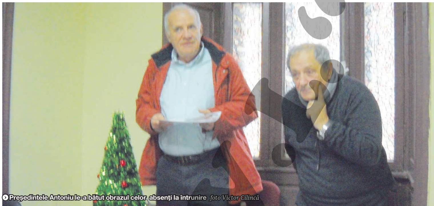
● Președintele Antoniu le-a bătut obrazul celor absenți la întrunire