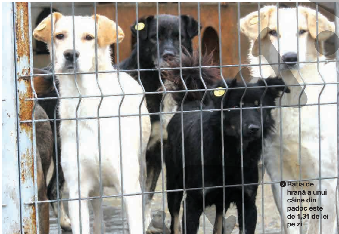
► Rația de hrană a unui câine din padoc este de 1,31 de lei pe zi

În iulie, în încercarea de a rezolva problema câinilor comunitari, primarul s-a întâlnit cu Flavius Dumitru Bărbulescu, directorul general al Asociației „Direcția Pentru Monitorizarea și Protecția Animalelor”, responsabilă de faptul că orașe precum Brașovul au reușit să rezolve problema maidanezilor. Iar municipalitatea gălățeană părea interesată să intre în acest ONG.