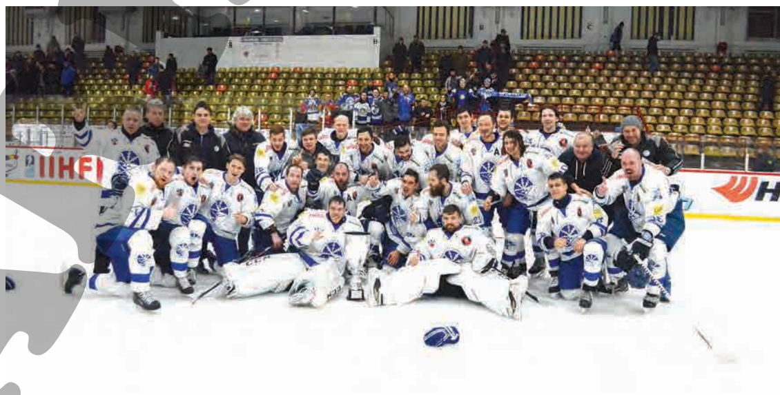
● SC Miercurea Ciuc, noua deținătoare a „Cupei României” la hochei pe gheață

Halep, demonstrație reușită în Thailanda