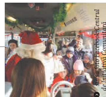
sur sa foto Facebook/Centrul de Inițiativă Comunitară

listele cu copii cumiți și vrem să-i bucurăm pe cât mai mulți dintre ei. Ei sunt viitorul nostru și de la ei așteptăm ceva mai bun“, a spus Moș Crăciun. Este al șaselea an consecutiv în care Centrul de Inițiativă Comunitară Galați și partenerii săi organizează acest eveniment, acțiunea devenind tot mai populară de la o ediție la alta. „Mă bucură și faptul că sunt atât de mulți copii, dar și reacția acestor micuți atunci