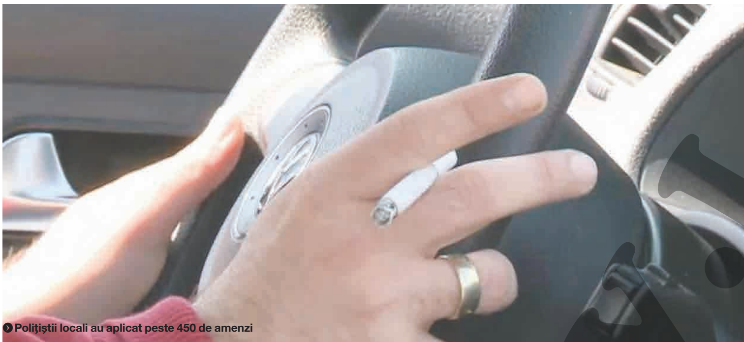
● Polițiștii locali au aplicat peste 450 de amenzi