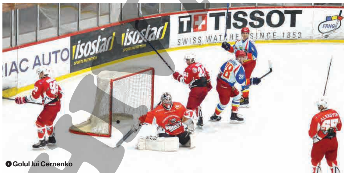
● Golul lui Cernenko

În Liga Națională, până la finalul sezonului, gălățenii mai au de disputat câte două meciuri cu Ciuc și Progym, respectiv, cinci jocuri cu formația Corona Brașov. ●