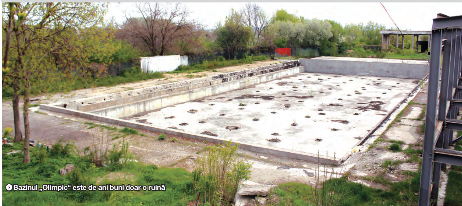
► Bazinul „Olimpic” este de ani buni doar o ruină

CONSILIUL JUDEȚEAN PREGĂTEȘTE PRELUAREA BAZELOR SPORTIVE ALE MTS ● PROIECT