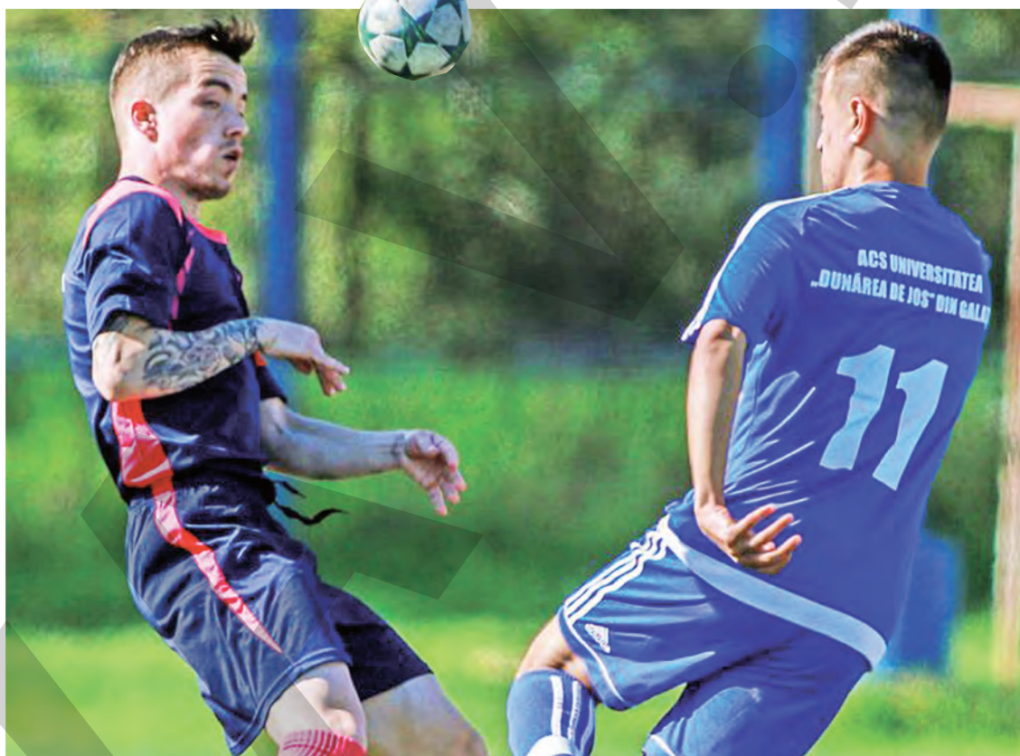
● Imagine de la meciul direct dintre Universitatea și Zimbrul

Duminică, au loc celelalte jocuri ale etapei: de la ora 12.00, Avântul Drăgănești - Viitorul Costache Negri (Gabriel Mihai, Daniel Burloiu), Ghidigeni - Agrostar Tuluțești (Ciprian Carp, Maricel Vlase), iar de la 18.30, Avântul Vânători - Unirea Braniștea (Ionuț Cojocaru, Mihai Păiș). Meciul Glo-