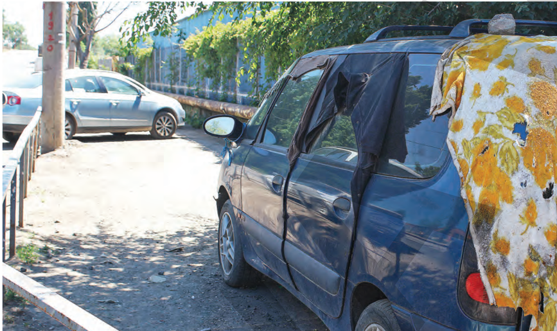
● Mașinile abandonate sunt în vizorul polițiștilor locali

Anul trecut, în conformitate cu prevederile Legii nr. 421/2002, polițiștii locali au acționat pentru identificarea