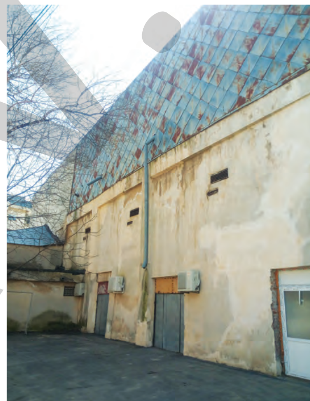
Peretele din spate al clădirii