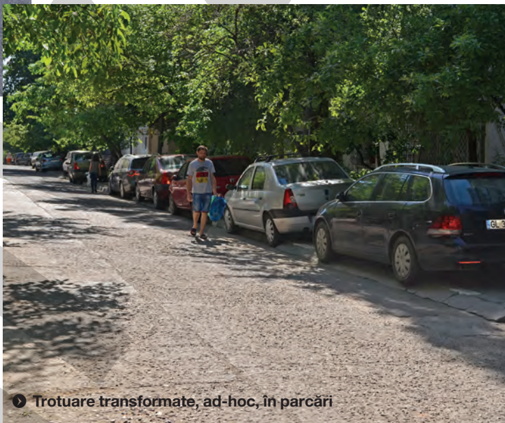
▶ Trotuare transformate, ad-hoc, în parcări

Autoritățile locale, care ar trebui să schimbe ceva, nu au timp însă să vină în zonă să vadă cum se poate rezolva, și aici, problema parcărilor. Nu de alta, dar, pe ici pe colo, ar putea fi identificate câteva locuri, lăsate de izbeliște, pe care nici iarba nu mai crește, și care ar putea fi transformate în parcări.