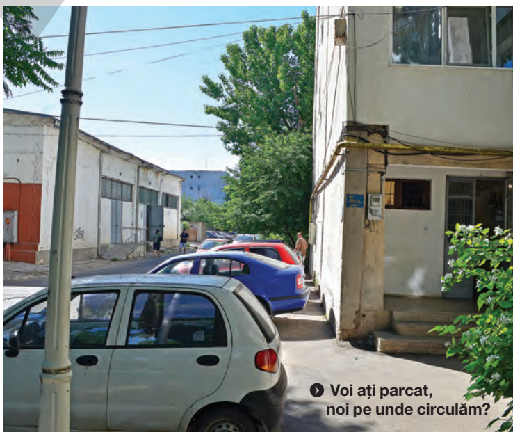
▶ Voi ați parcat, noi pe unde circulăm?

www.viata-libera.ro Viața la fața locului CARTIER