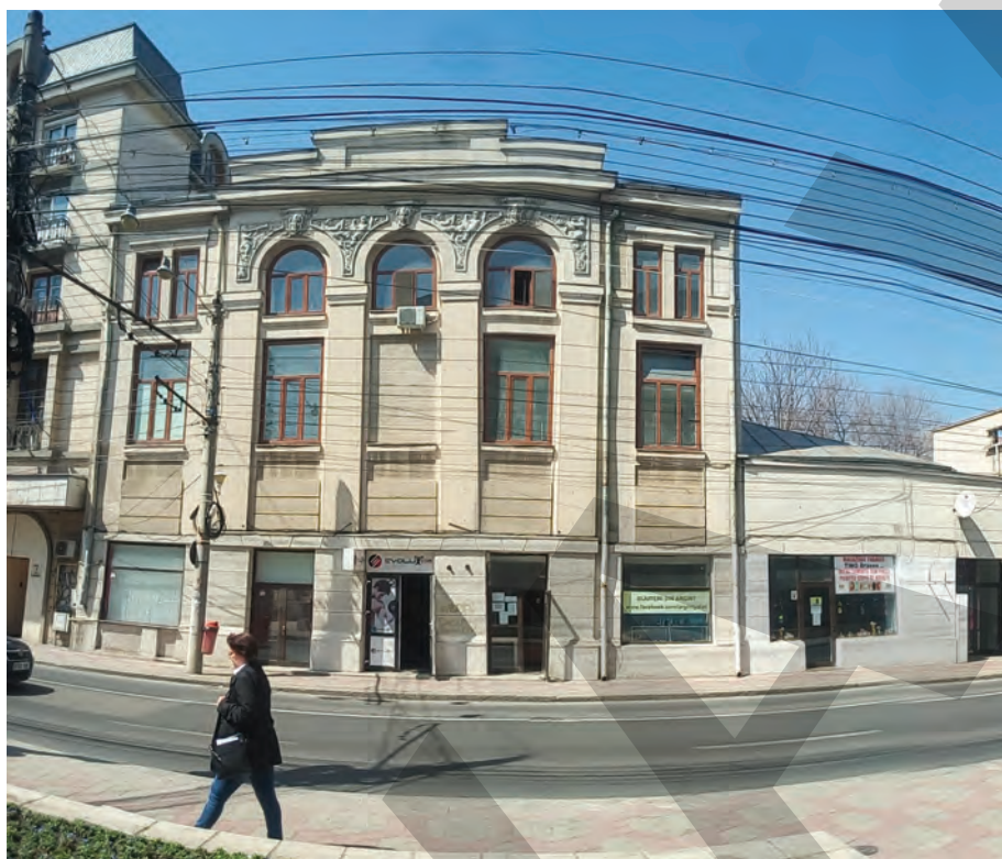
Ce-a fost și ce-a ajuns fostul cinematograful