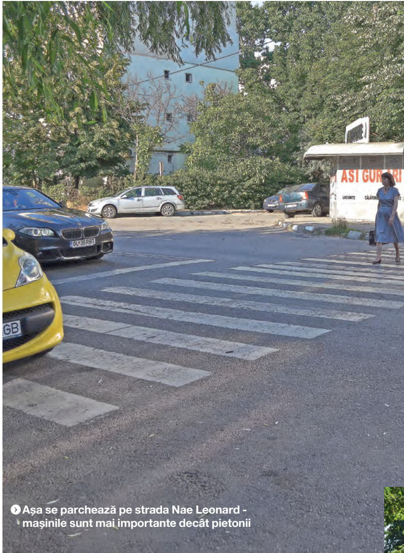
▶ Așa se parchează pe strada Nae Leonard - mașinile sunt mai importante decât pietonii

ATENTAT LA SIGURANȚA CIRCULAȚIEI ● TRAFIC