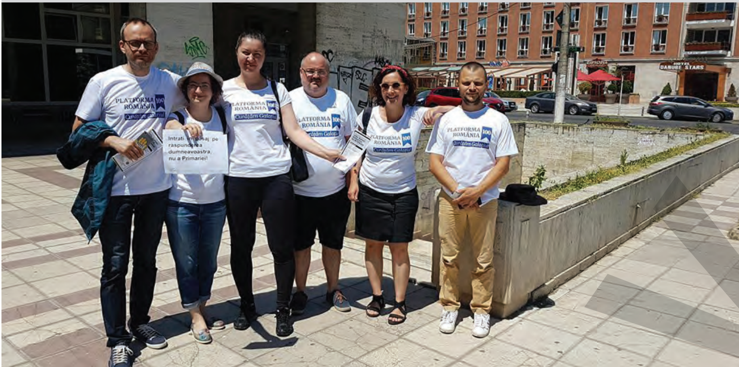
ACȚIUNE CIVICĂ ● PROTEST