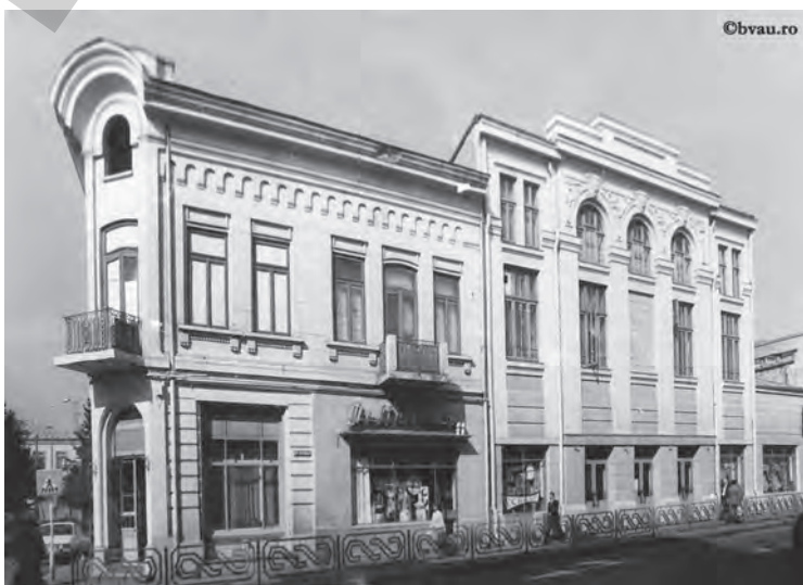
Fostul cinematograful „Republica” în 1977