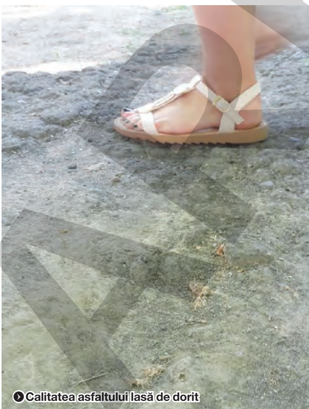
► Calitatea asfaltului lasă de dorit

torii acestui oraș vor înțelege că nu doar noi, jurnaliștii, vedem numai ceea ce este urât. La fel văd și cetățenii. În cazul acesta, niște cetățeni care încă nu au drept de vot. Dar care, peste doi ani, vor avea. ● Fotografii de Maxim Iordan, Andrei Podaru, Ionuț Costea, Andreea Gulez, Andreea Petrică, Teodora Vieru și Mihai Pricop