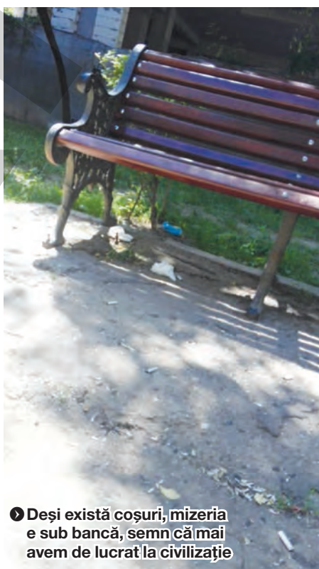
► Deși există coșuri, mizeria e sub bancă, semn că mai avem de lucrat la civilizație