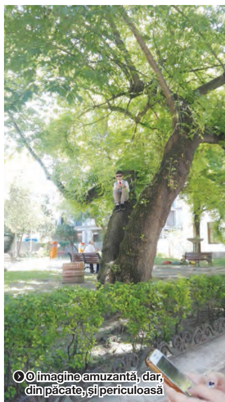
► O imagine amuzantă, dar, din păcate, și periculoasă