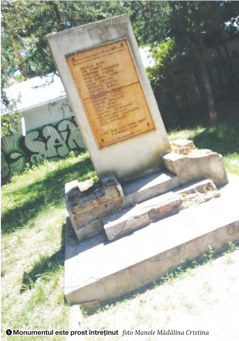
► Monumentul este prost întreținut