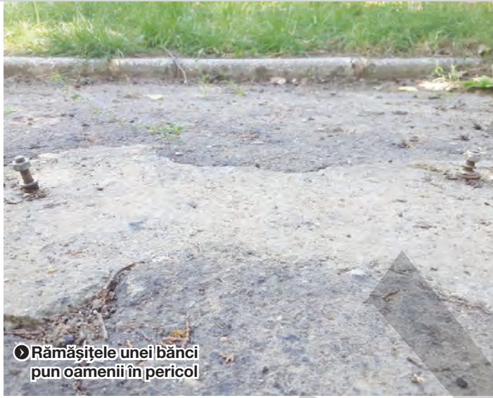
► Rămășițele unei bănci pun oamenii în pericol