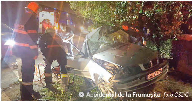
Accidentul de la Frumușița

Doi șoferi din județul Galați și-au pus viața în pericol și și-au făcut praf mașinile, după ce au circulat cu viteză și au intrat în coliziune cu elementele de protecție ale unor poduri. Ambele accidente s-au petrecut pe DN 26, primul fiind înregistrat la Vlădești. Un șofer de 39 de ani nu a redus viteza într-o curbă pe care a apreciat-o ca ușoară. A pierdut controlul direcției și a intrat frontal într-un cap de pod, impactul soldându-se atât