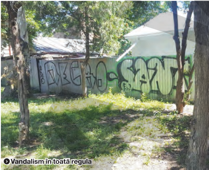
► Vandalism în toată regula

UN PARC REPETENT LA ÎNTREȚINERE ● EDILITAR