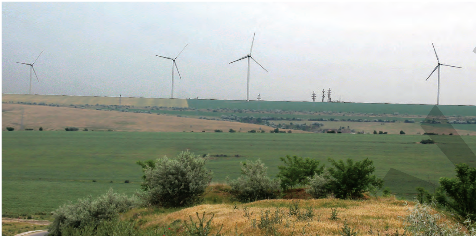
25 DE TURBINE, PE COLINELE COVURLUIULUI ● ECONOMIE