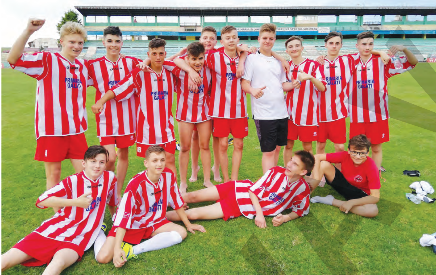
● Echipa Junior Galați, cu o victorie în turneul de la Suceava

MARIAN CĂPĂȚÎNĂ marian.capatina@viata-libera.ro