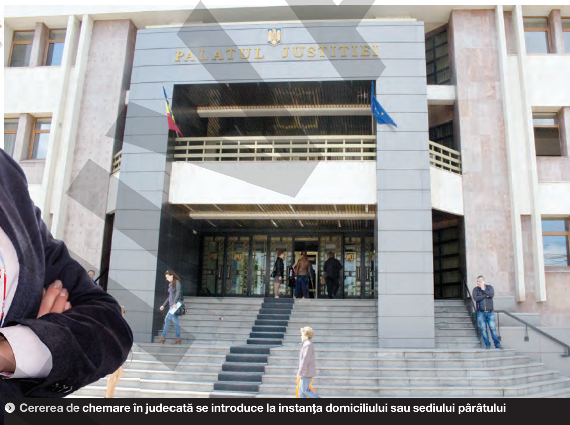
● Cererea de chemare în judecată se introduce la instanța domiciliului sau sediului pârâtului

Cererea de chemare în judecată trebuie introdusă numai la o anumită instanță, expres prevăzută de lege. Cererile privitoare la drepturi reale imobiliare se introduc numai la instanța în a cărei circumscripție este situat imobilul. În materie de moștenire, până la ieșirea din indiviziune, este competentă instanța ultimului domiciliu al defunctului pentru a soluționa cererile privitoare la dispozițiile testamentare, cele privitoare la moștenire și la sarcinile acesteia, precum și cele privitoare la pretențiile pe care moștenitorii le-ar avea unul împotriva altuia și cererile legatarilor sau ale creditorilor defunctului împotriva vreunui dintre moștenitori sau împotriva executorului testamentar. Cererile în materie de societate, până la sfârșitul lichidării sau până la radiere, sunt de competența instanței în circumscripția căreia societatea își are sediul principal. Cererile în materia insolvenței sau concordatului preventiv sunt de competența exclusivă a tribunalului în a cărui circumscripție își are sediul debitorul. Cererile formulate de un profesionist împotriva unui consumator se introduc numai la instanța domiciliului consumatorului. ●