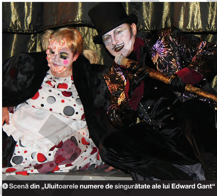
Scenă din „Uluitoarele numere de singurătate ale lui Edward Gant“

fează din acțiuni, ci mai mult din introspecție și povestiri. Celestina Del Sol și frații de la Luna se întâlnesc fără a se întâlni vreodată, asemenea soarelui și lunii. Ea e angelică, infantilă, etern gravidă, așadar inaccesibilă, flămândă de sex, versată în emoții și expertă în dragoste, părăsită și în căutarea bărbatului care-a însămânțat-o, e o forță a naturii, un personaj arhetipal, magic. Bărbații, mult mai concreți, mai neajutorați, constructori de case și dornici de familie, sfârșesc pierduți în timpul prin care ea navighează indiferent, nonșalant. Iar Timpul, personajul principal al piesei, zguduie lumea, într-o tectonică îndepărtată, mereu schimbătoare, asemenea norilor, vizibili, dar de neatins de la suprafața concretă a realității terestre. ●