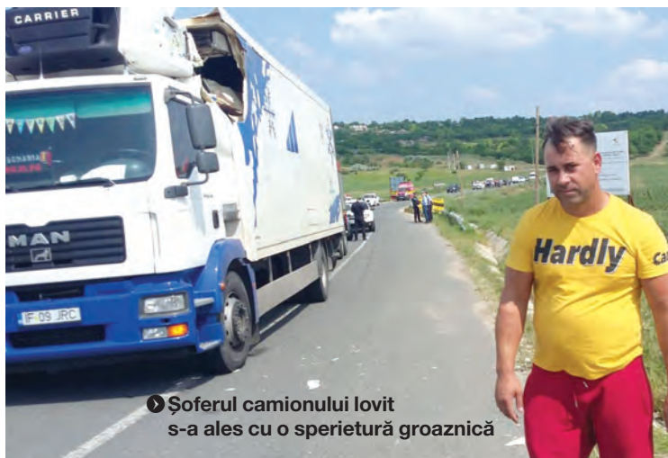
Șoferul camionului lovit s-a ales cu o spieretură groaznică

Cazul a fost preluat de procurorii Parchetului de pe lângă Curtea de Apel Galați, care, în urma investigațiilor, vor stabili care au fost motivele producerii acestui incident, în care a fost afectat parțial și lanul de grâu unde a aterizat forțat avionul. ● foto Teodora Miron și SMURD Galați