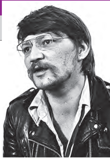
leen”, „Veronica Voss”. S-a stins din viață la 10 iunie 1982. ● V.G.

zare] german, la filmele de public influențate de cinematograful hollywoodian. În filmele sale, a cultivat „estetica pesimismului, singurele semne de viață ale personajelor sale fiind revolta, crima, sinuciderea, nebunia, homosexualitatea”. Din bogata sa filmografie [a realizat 41 de filme] amintim: „Dragostea e mai rece decât moartea”, „Măncătorii de pisici”, „Soldatul american”, „Lacrimile amare ale Petrei von Kant”, „Frica mănâncă sufletul”, „Friptura diavolului”, „Ruleta chinezească”, „Disperare - o călătorie spre Lună”, „Berlin - Alexanderplatz”, „Lili Mar-