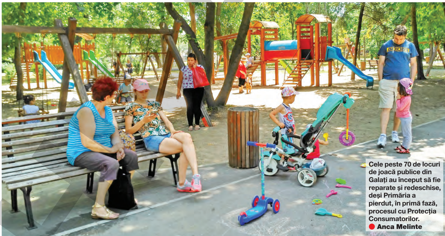
Cele peste 70 de locuri de joacă publice din Galați au început să fie reparate și redeschise, deși Primăria a pierdut, în primă fază, procesul cu Protecția Consumatorilor. ● Anca Melinte

08 ortopedie Intervenție chirurgicală în premieră, la Spitalul Județean