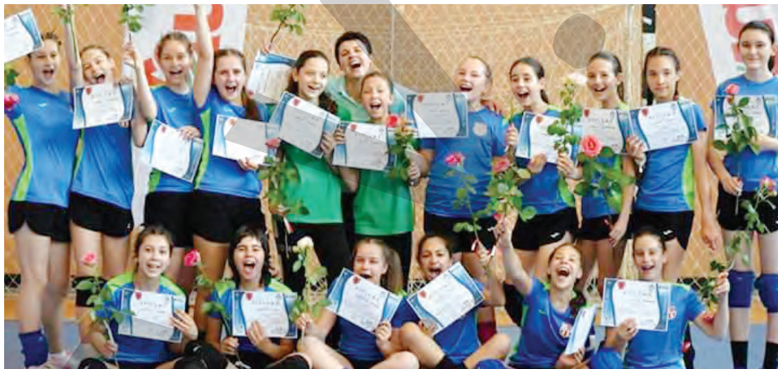
● Handbalistele de la CS United Galați

Echipa CS Școlar se află la prima participare la această categorie de vârstă. „Școlărițele” își vor măsura șansele din acest