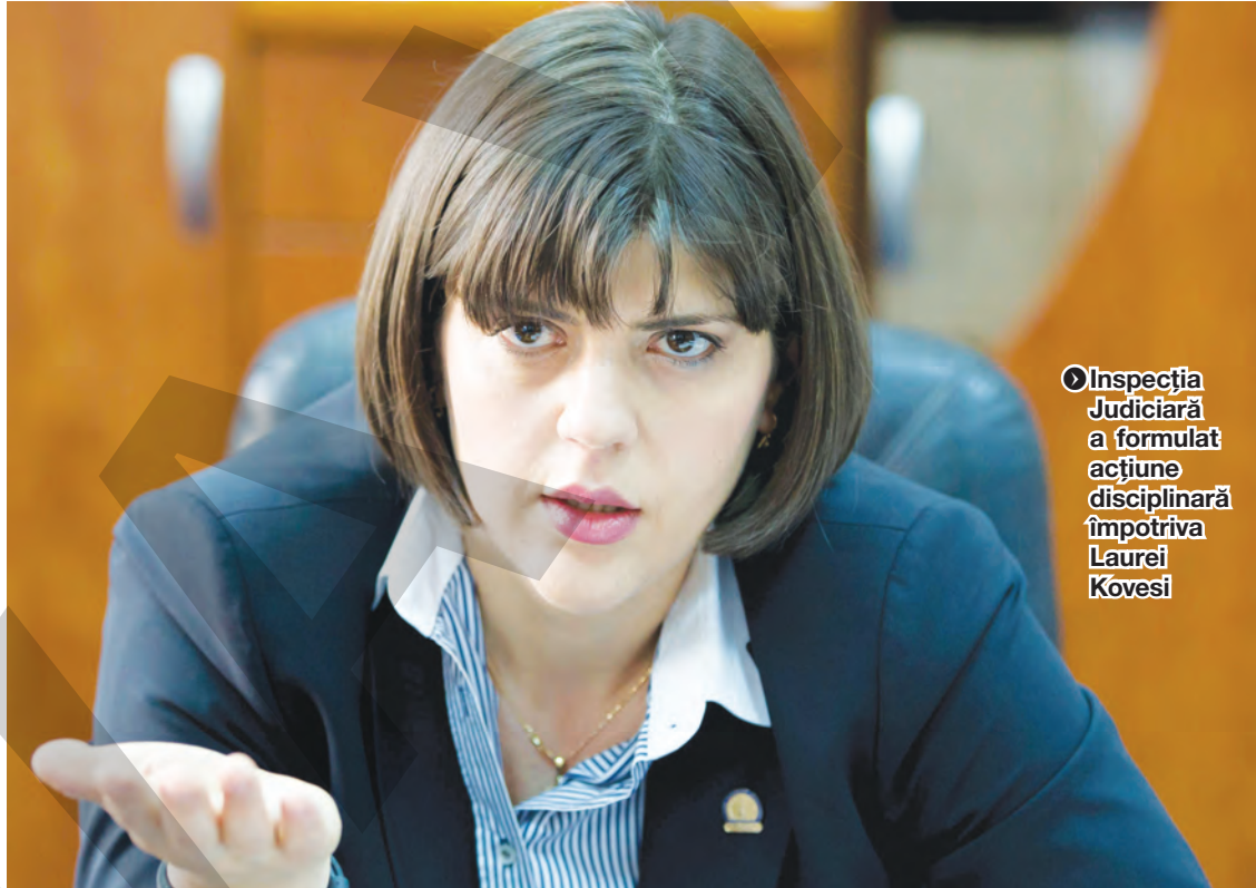
● Inspeția Judiciară a formulat acțiune disciplinară împotriva Laurei Kovesi

Pe 11 aprilie, Inspecția Judiciară anunța că a exercitat acțiunea disciplinară față de Kovesi, după ce aceasta ar fi desemnat, ca membru al unei echipe de control, un magistrat aflat într-o stare vădită de incompatibilitate. "Inspeția Judiciară a exercitat acțiunea disciplinară față de doamna Laura Codruța Kovesi, procuror șef al Direcției Naționale Anticorupție (DNA), pentru săvârșirea abaterilor disciplinare prevăzute de articolul 99 litera g) din Legea nr. 303/2004, respectiv «nerespectarea dispozițiilor procurorului ierarhic superior date în scris și în conformitate cu legea», constând în aceea că a încălcat cu știință dispozițiile articolului 7 alineatul (3) din Ordinul nr. 5/12.01.2016 al procurorului general al Parchetului de pe lângă Înalta Curte de Casație și Justiție, care se referă la competența de a