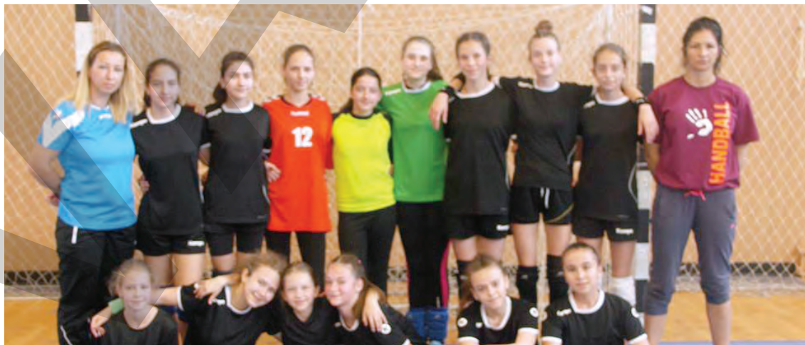
● „Școlărițele” pregătite de turneul final