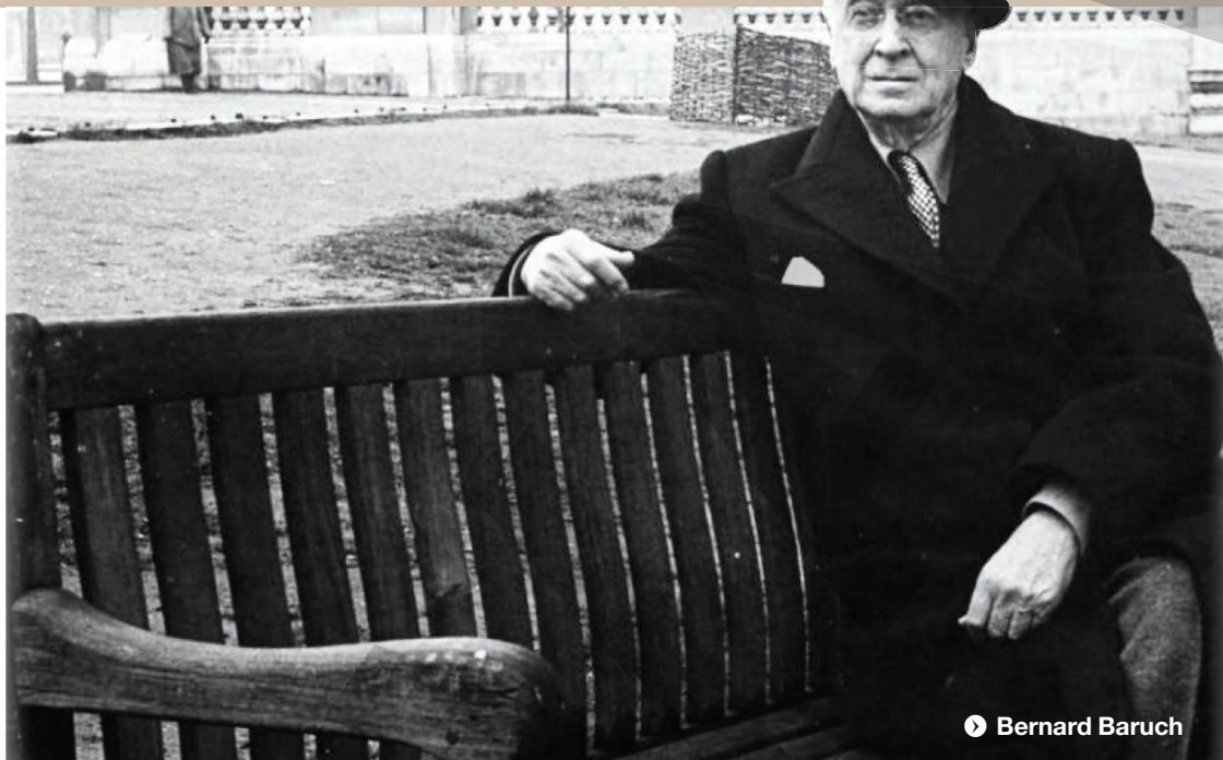
➤ Bernard Baruch