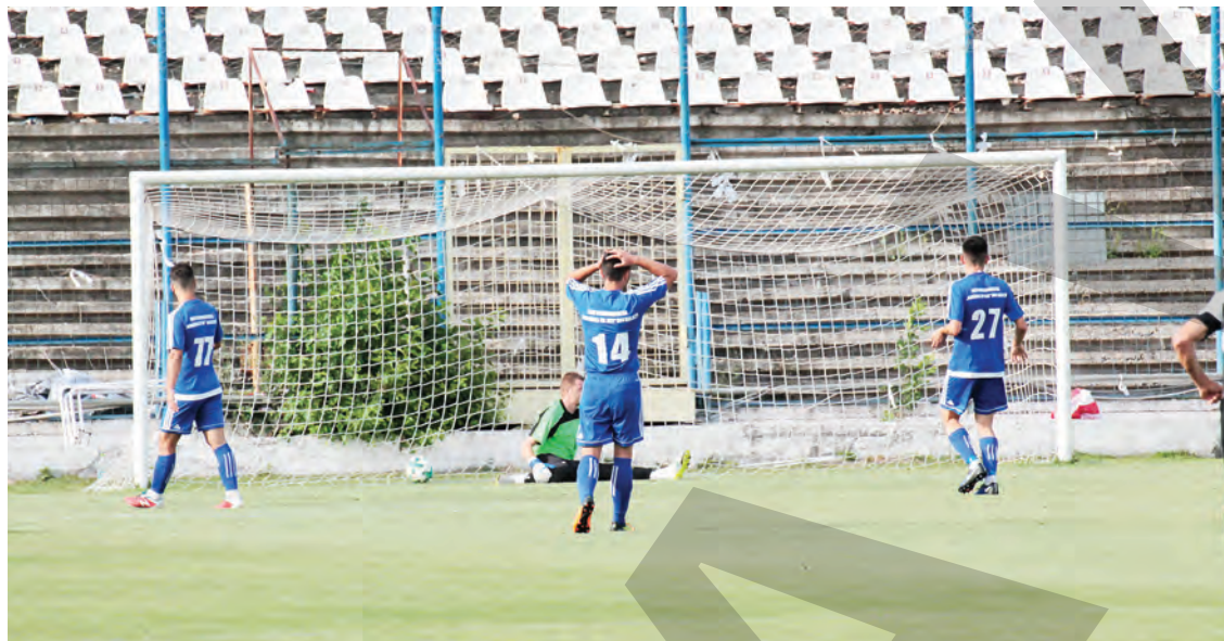
● Primul gol primit de CSU Galați în barajul pentru Liga a III-a

23,6 ANI A FOST MEDIA DE VÂRSTĂ A PRIMULUI „11” GĂLĂȚEAN, IAR A ADVERSAREI A FOST DE 29 ANI