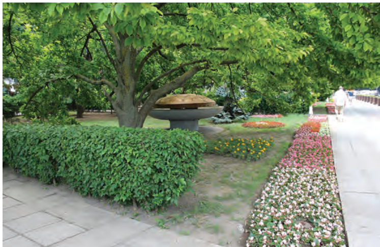
➤ Cândva o oază de răcoare, fântânile din parc au fost date uitării