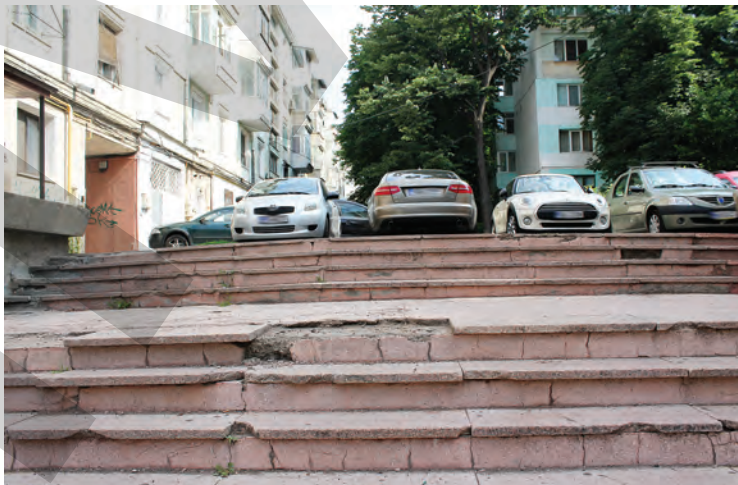
➤ Pe aici se trece, dar cu mare dificultate