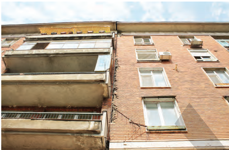
➤ Fațadele de la blocuri sunt adevărate pericole pentru trecători

NEPĂSARE, UITARE ȘI LIPSĂ DE BUN-SIMȚ ● REPORTAJ