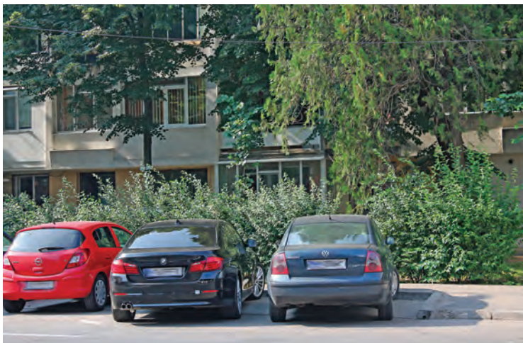
➤ Boscheți netăiați și copaci netoalețați