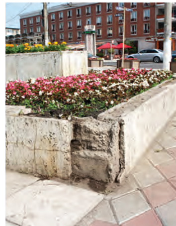
➤ Plantăm fiori, dar uităm să reparăm astfel încât să ne bucurăm de o priveliște... de centru