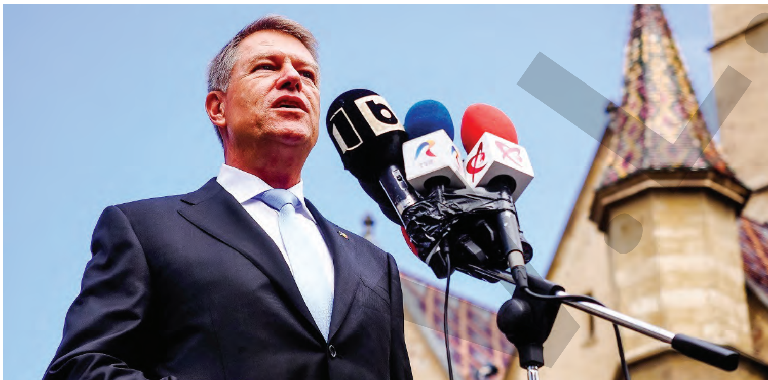
● Klaus Iohannis a îndemnat societatea civilă să fie vigilentă cu privire la ordonanțele de urgență

în piață, până se schimbă ceva. La manifestare, oamenii au cântat imnul României și Imnul golanilor, în timp ce ridicau în aer lanternele telefoanelor. Și scriitoarea Ana Blandiana a fost prezentă la protest și a primit flori de la protestatarii.