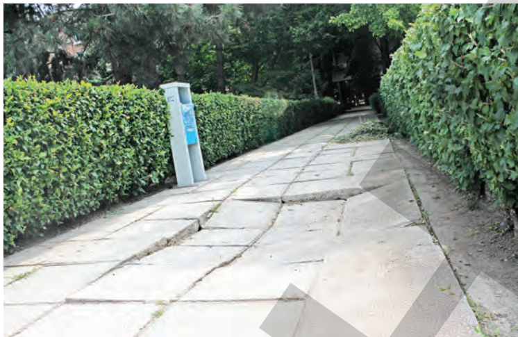
➤ Aleile din cartierul Spicu arată ca după bombardament

Problemele din plin centrul orașului sunt vizibile la orice pas, iar fotografiile surprinse de noi fac cât mii de cuvinte. Poate, într-o zi, autoritățile își vor aminti că prin această zonă trec mulți dintre cei care vin în vizită în oraș, fiind o cale de acces către Fa-leza Dunării.