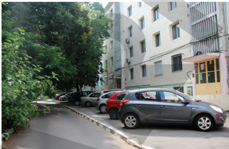
➤ În lipsa locurilor de parcare, șoferii ocupă trotuarele