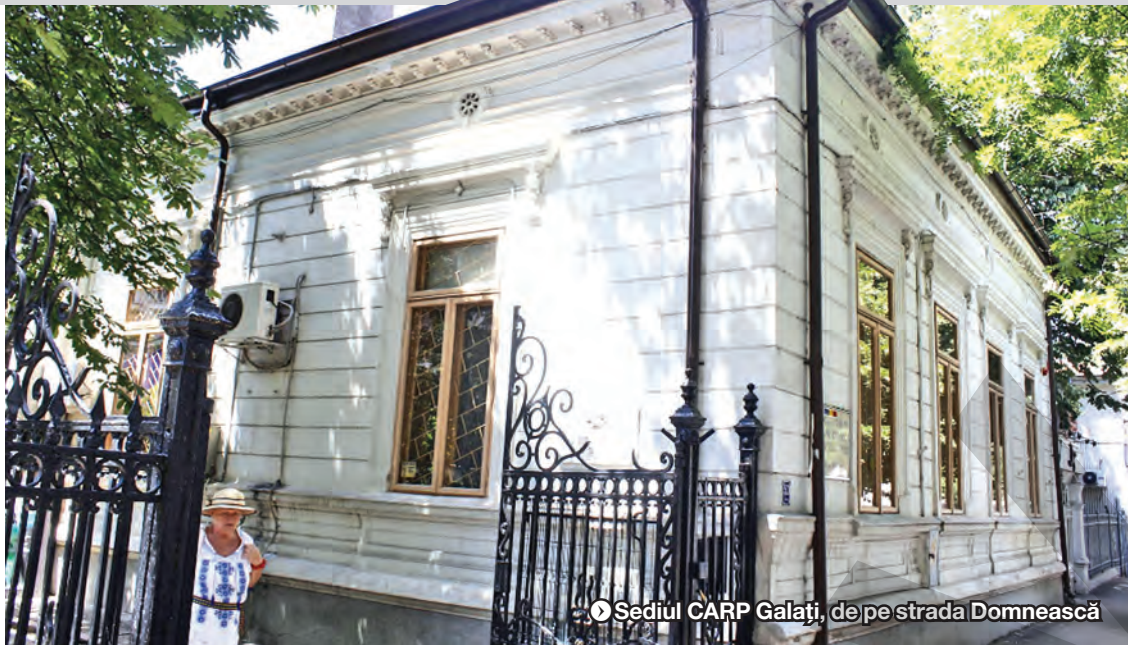
Sediul CARP Galați, de pe strada Domnească

„BANII OAMENILOR SUNT LA OAMENI” ● ÎNCREDERE