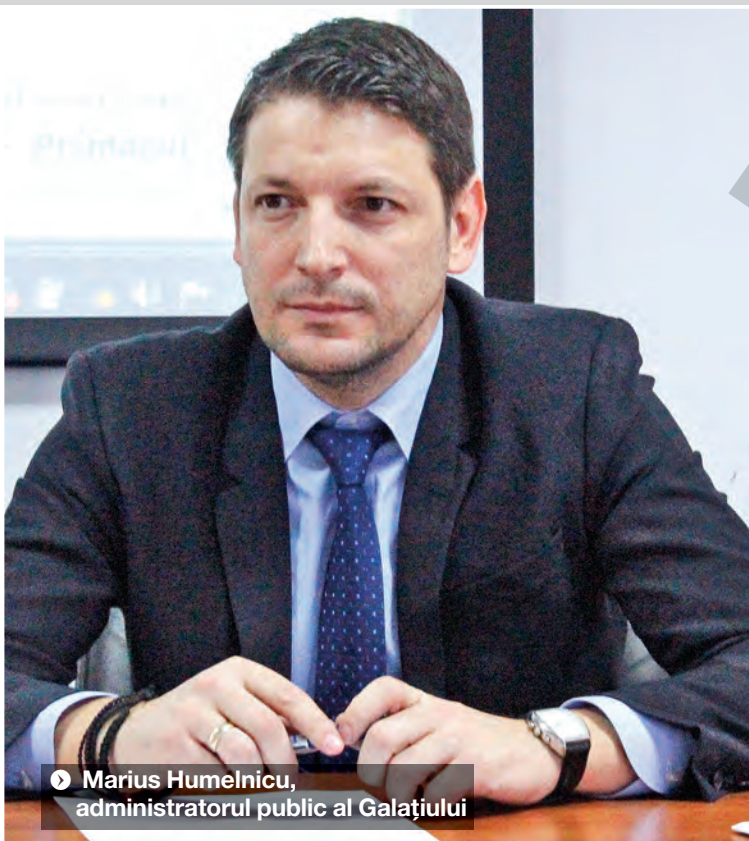
► Marius Humelnicu, administratorul public al Galațiului