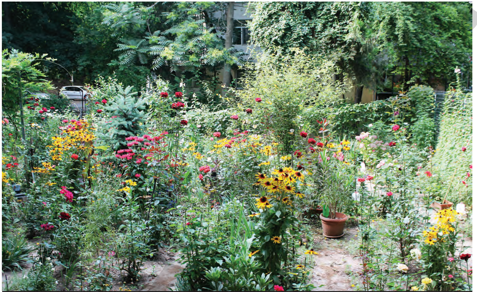
➤ Cu puțin efort, oricine ar putea avea o astfel de grădină în jurul blocului

NICULINA MIHAI locuitoare în cartierul Spicu