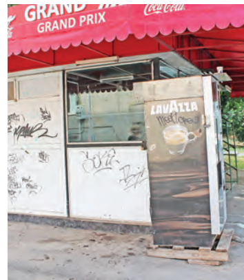
➤ Chioșcurile abandonate au devenit case pentru oamenii străzii

Este nevoie de adăpost în stațiile de autobuz