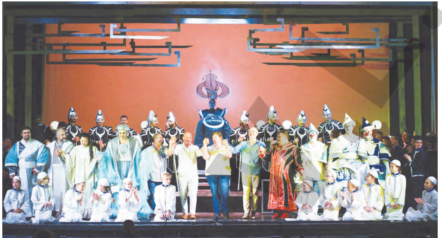
LA TEATRUL NAȚIONAL DE OPERĂ ȘI OPERETĂ „N. LEONARD” ● PREMIERĂ