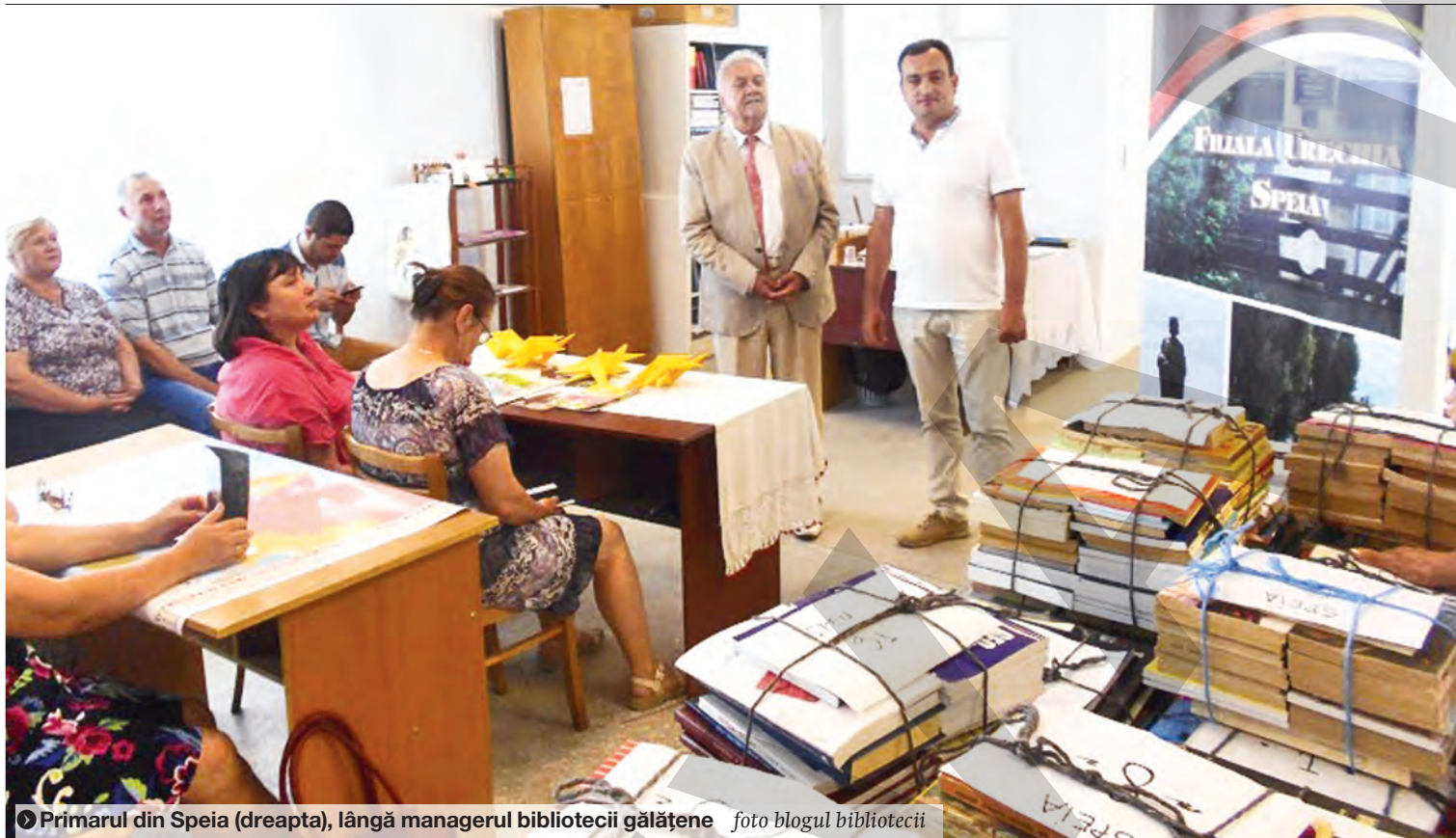
● Primarul din Speia (dreapta), lângă managerul bibliotecii gălățene