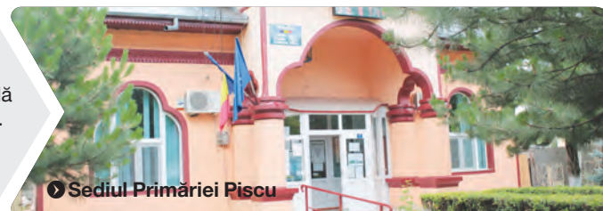
Sediul Primăriei Piscu

obținem finanțare. Proiectul este depus la Compania Națională de Investiții și așteptăm să semnăm contractul. Este o sală de 108 locuri, de categoria cea mai mică. Sala de sport va fi construită pe terenul școlii, ziua vor beneficia de ea elevii, iar seara va fi închiriată”. ● C.L.