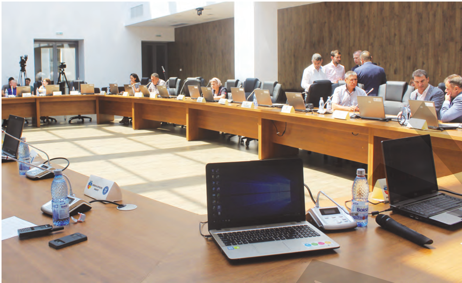
● Aleșii locali vor decide prin vot secret administratorii provizorii ai Transurb