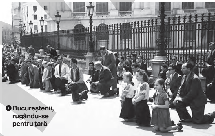
➤ Bucureștenii, rugându-se pentru țară

1) În decurs de patru zile, începând de la ora 14, după ora Moscovei, la 28 iunie, să se evacueze te-