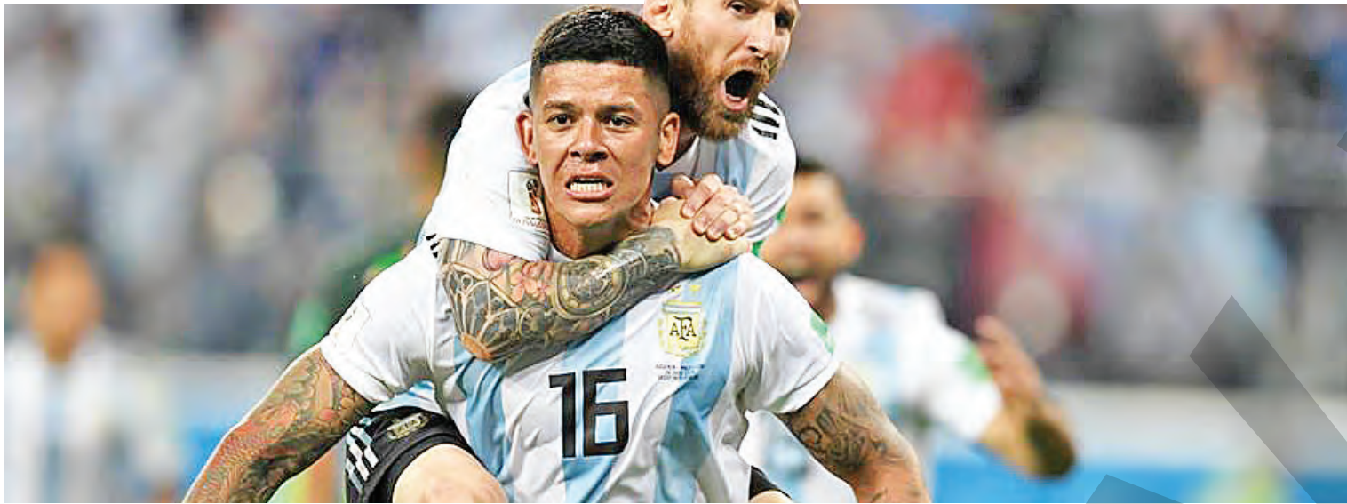
● Messi exteriorizându-și bucuria calificării în optimile de finală