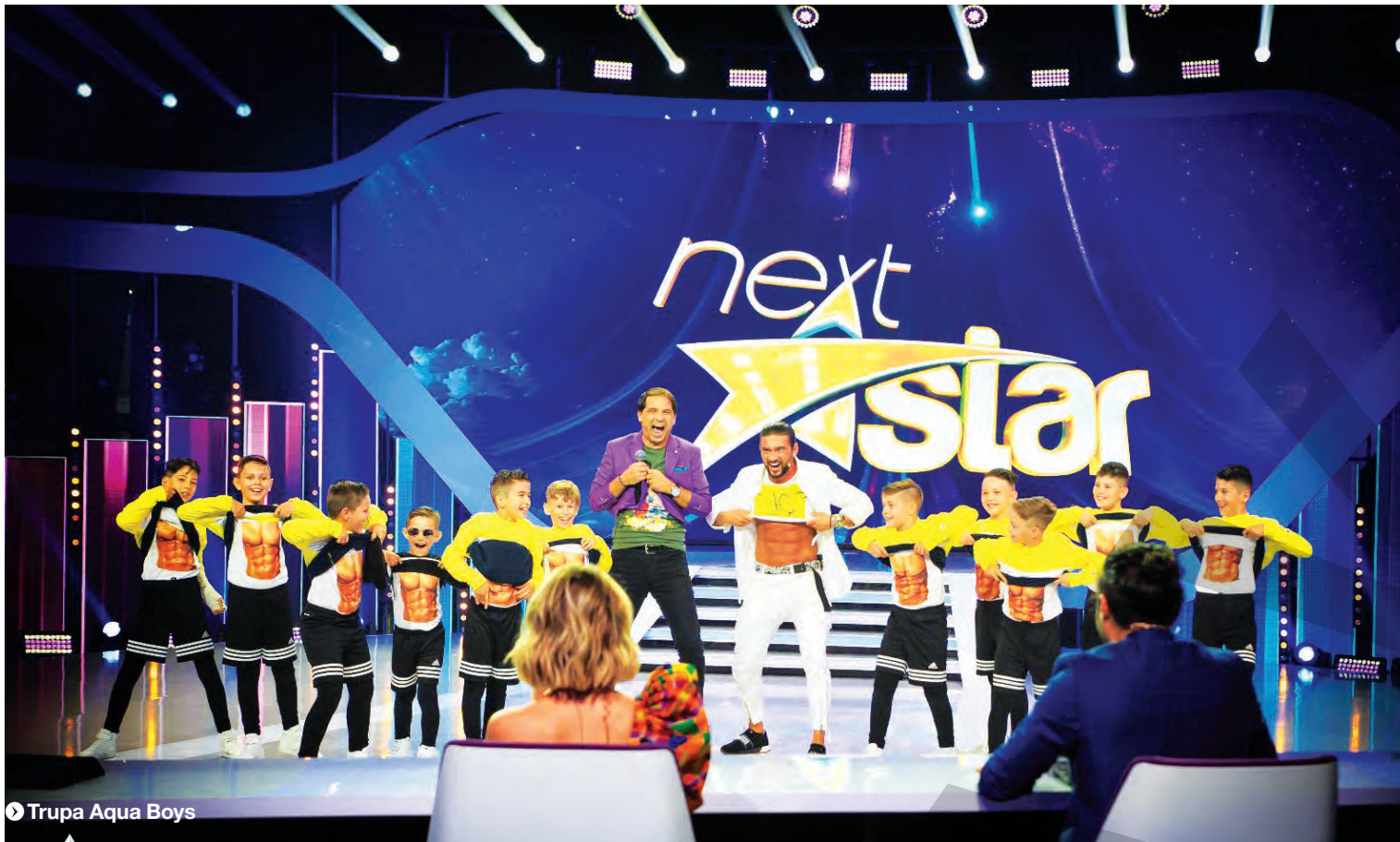
Trupa Aqua Boys

ÎN ACEASTĂ SEARĂ, LA ANTENA 1 ● SPECTACOL