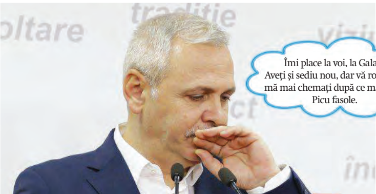
● Protestatar, la ora de educație civică