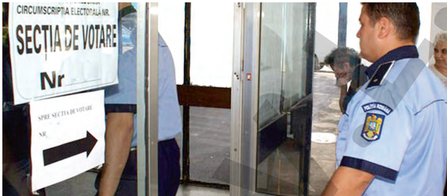
● Paza secțiilor de votare va fi asigurată de polițiști, jandarmi, polițiști de frontieră, dar și de alți angajați ai MAI

piroman. Astfel, în urma cercetărilor, bărbatul bănuit de comiterea faptei a fost depistat de polițiști și reținut, pe bază de ordonanță, pentru 24 de ore. Acesta va fi prezentat instanței, cu propunere de arestare preventivă. ● T. Miron