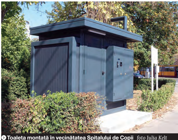
► Toaleta montată în vecinătatea Spitalului de Copii