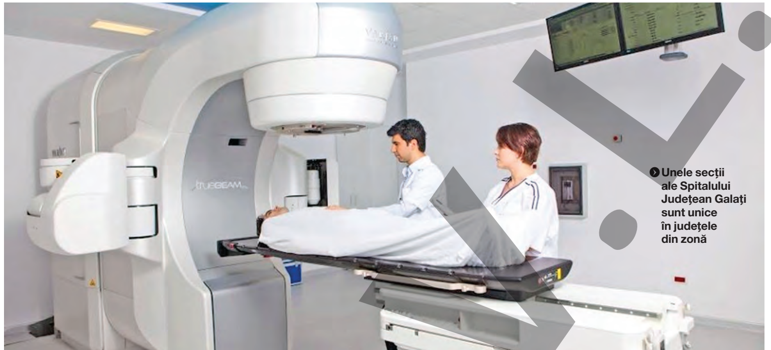
Unele secții ale Spitalului Județean Galați sunt unice în județele din zonă

cu amănuntul fără a fi îndeplinite condițiile stabilite de către Autoritatea Publică Locală. Operatorul economic a fost sancționat contravențional, cu o amendă în cuantum de 1.000 de lei, conform prevederilor HCL 260/2018. ● T.M.