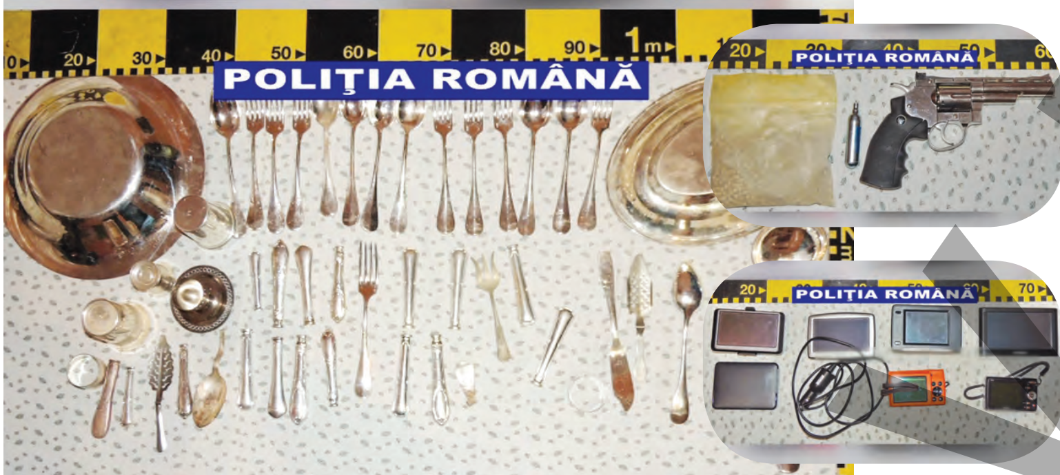
► Polițiștii gălățeni au confiscat mai multe bunuri ale suspectilor

PERCHEZIȚII ÎN MAI MULTE LOCALITĂȚI DIN JUDEȚ ● PENAL