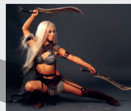
Tailanda, Acțiune, Aventuri, Fantastic

07:00 Observator 10:00 Te cunosc de undeva (R) 13:00 Observator 14:00 Pinocchio (R) SUA, Animație, Aventuri, Dramă, Familie, Fantastic, Muzical 16:00 Chefi la cuțite (R) 19:00 Observator 20:00 Insula iubirii 21:30 X Factor 01:00 Regele Scorpion 3 03:00 Observator (R) 04:00 Arca lui Noe SUA, Dramă 06:00 Observator