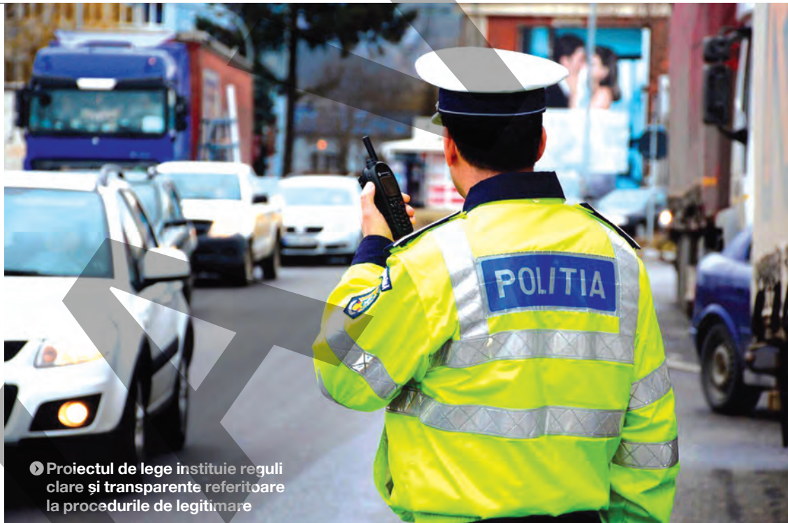
● Proiectul de lege instituie reguli clare și transparente referitoare la procedurile de legitimare

Proiectul propus de MAI și adoptat prin vot nu vizează domeniul adunărilor publice (mitinguri, activități de protest etc.) și, pentru o perioadă de 180 de zile de la data intrării în vigoare a legii, Ministerul Afacerilor Interne, Poliția Română și Poliția de Frontieră Română vor informa