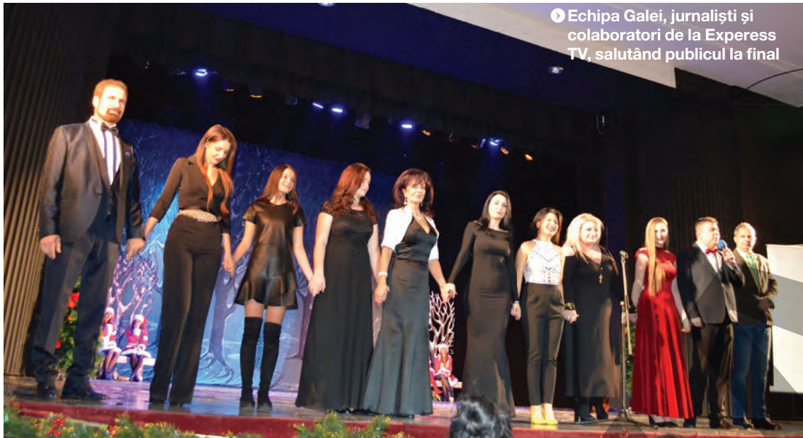
► Echipa Galei, jurnaliști și colaboratori de la Express TV, salutând publicul la final