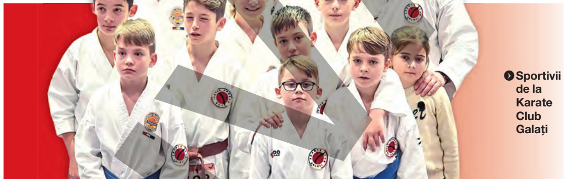
● Sportivii de la Karate Club Galați

Karateka de la cele trei cluburi gălățene de specialitate și-au dovedit valoarea la Campionatul European de karate tradițional - fudokan pentru copii, juniori, cadeți, tineret și seniori, ce a avut loc în Slovenia, la Portoroz. Aceștia au câștigat 23 de titluri de campioni, precum și 15 medalii de argint și 15 de bronz.