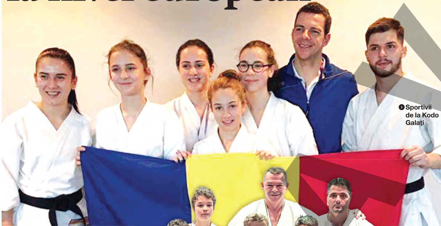
● Sportivii de la Kodo Galați