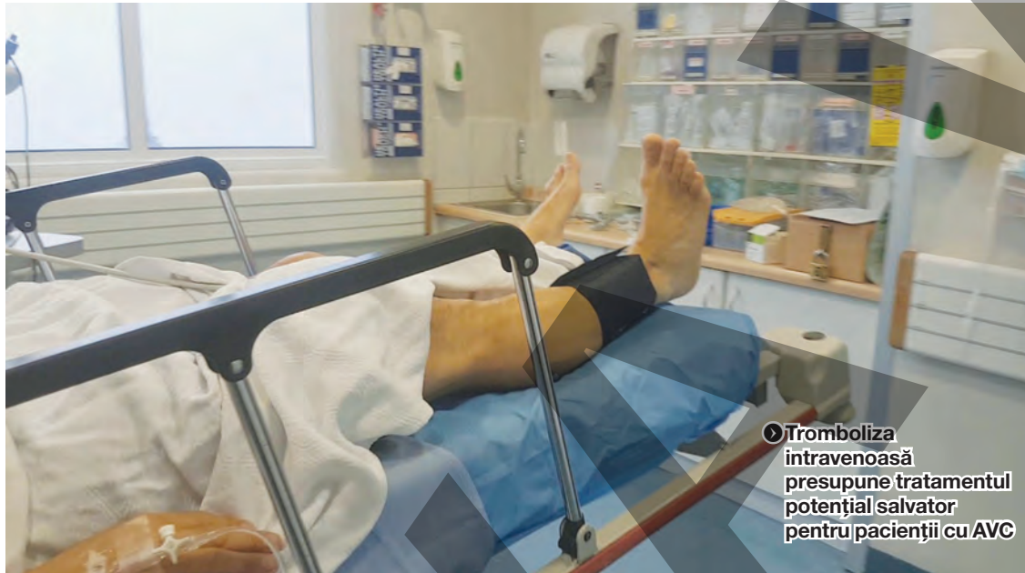
● Tromboliza intravenoasă presupune tratamentul potențial salvator pentru pacienții cu AVC

Potrivit unui comunicat de presă, începând cu anul 2015, zece spitale din România au derulat programul-pilot al acțiunilor prioritare pentru tratamentul intervențional al pacienților cu accident vascular cerebral acut. Documentul lansat în dezbateri creează premisele pentru a extinde acest program la nivel național. "Programul și-a dovedit eficiența, mulți pacienți care au beneficiat de tratament intervențional în caz de AVC fiind recuperați. Din această cauză, împreună cu specialiștii am decis extinderea acestuia la nivel național. Tratamentul acut farmacologic și intervențional reprezintă principalul mijloc de reducere a dizabilității importante asociate