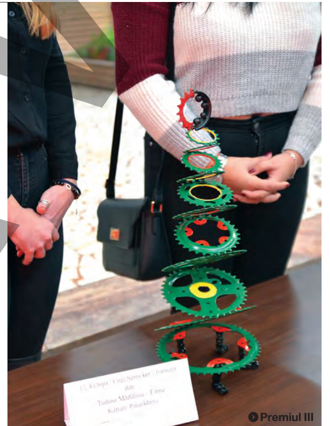
● Premiul III

Cea de-a IV-a ediție a Brad-Engineering și-a desemnat, joi, câștigătorii, iar brăduții lor, care de care mai frumoși și mai ingenioși, își caută cumpărători.