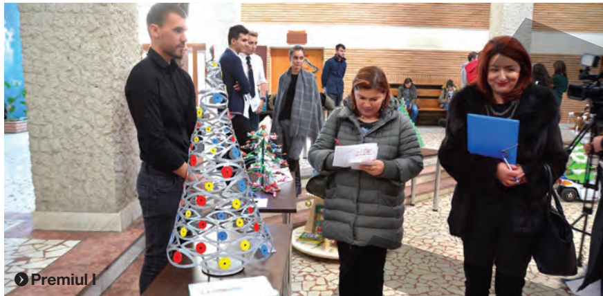
● Premiul I