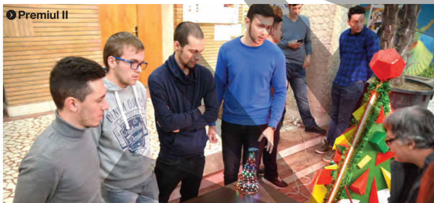
● Premiul II