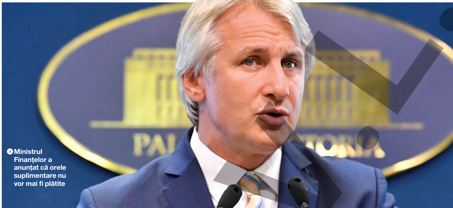
Ministrul Finanțelor a anunțat că orele suplimentare nu vor mai fi plătite

DECLARAȚIE. Președintele Klaus Iohannis a declarat că ordonanța de urgență pe Codul fiscal anunțată de ministrul Finanțelor nu are analiză de fundamentare, vine cu idei nemaiauzite și aruncă economia în haos. „Ne așteptăm ca totul să se scumpească - asta e rezultatul acestei OUG”, a spus șeful statului, arătând că este vorba de o „taxă din lăcomia pesediștilor de a lua bani mai mulți pe care îi vor gestiona cum consideră dumnealor, vor da peste cap toată economia și bugetele tuturor românilor”. Președintele Iohannis a spus că face apel la Guvern să se răzgândească și să vină cu măsuri sustenabile. „Fac apel la Guvern să se răzgândească în privința acestei ordonanțe, să o pună în discuție, să o negocieze cu patronatele, cu sindicatele și după o analiză profundă și discuții să revină cu o formă care este sustenabilă”, a spus președintele. „Dacă PSD a anunțat acum câteva luni că nu va introduce noi impozite și taxe și acum la sfârșit ai vine cu această ordonanță (...) pentru a lua bani din economia privată, este clar că există o problemă cu bugetul. (...) Concluzia este: n-au bani, nu știu cum să facă rost de bani și inventează pe picior tot felul de impozite și taxe”, a mai declarat Klaus Iohannis. Președintele a subliniat că această ordonanță este „un motiv serios de îngrijorare pentru toți românii”, pentru că „este o ordonanță care va face viața românilor mai scumpă”. ● T.M.