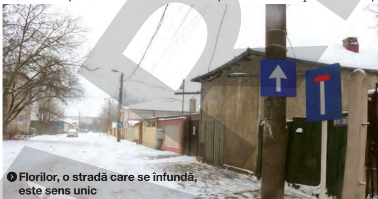
Florilor, o stradă care se înfundă, este sens unic

De adăugat ar mai fi un aspect care își va arăta „colții” odată cu încălzirea vremii, când Grădina Publică va fi luată zilnic cu asalt de gălățenii care, pe lângă corvoada găsirii unui loc de parcare, vor fi nevoiți să respecte niște reguli care vor duce la crearea de ambuteiaje și situații la limita penibilului în traficul, aglomerat în mod artificial, de pe străduțele înguste dintre căminele studențești. ●