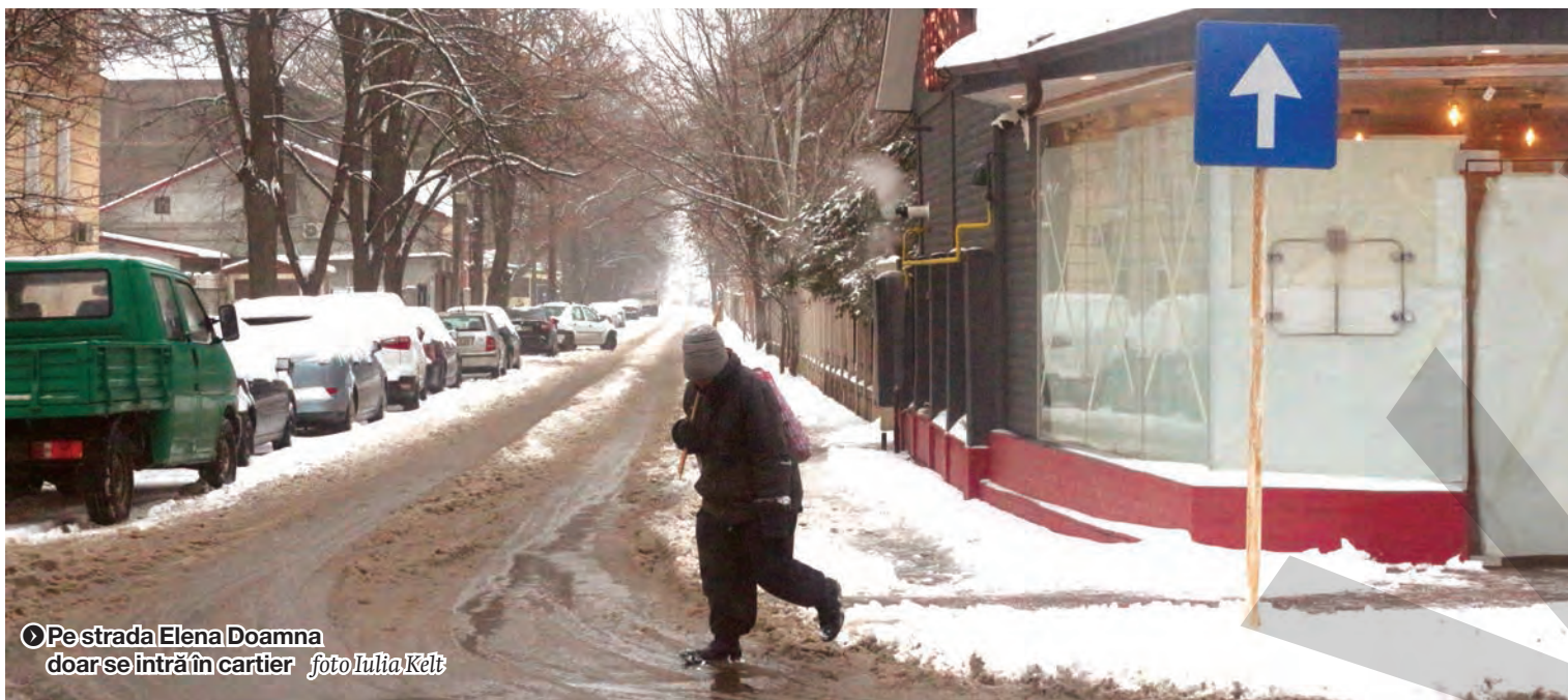
Pe strada Elena Doamna doar se intră în cartier

CUM SE ÎNCURCĂ TRAFICUL CU INDICATOARE ÎNTR-O ZONĂ SLAB CIRCULATĂ ● REGULI