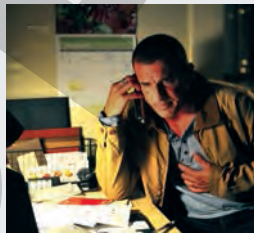
Canada, Dramă, Thriller