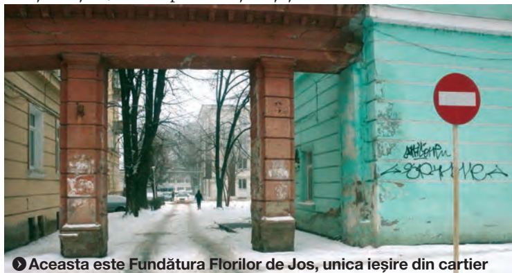
Aceasta este Fundătura Florilor de Jos, unica ieșire din cartier