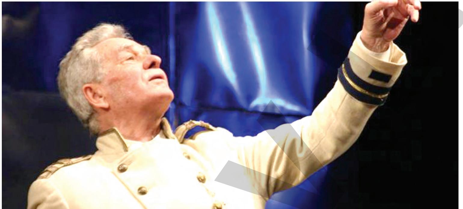
● Actorul Stelian Preda, în plin (alt) recital

activitatea filialei în 2018. De asemenea, vor fi prezentate comunicate ale conducerii pe țară a USR, vor fi discutate probleme organizatorice, se vor face propuneri pentru activități care ar urma să se desfășoare pe anul în curs. Membrii USR pot achita cu această ocazie și cotizația de membru al Uniunii. ● V. Cilincă