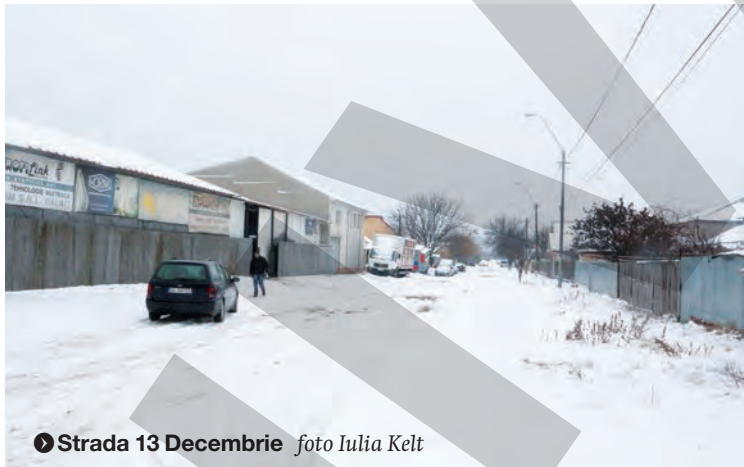
Strada 13 Decembrie

„Dumneavoastră scrieți, dar aleșii noștri nu se omoară să rezolve problemele. Lucrurile au rămas la fel de ani de zile. Parcă trăim la capătul pământului”,