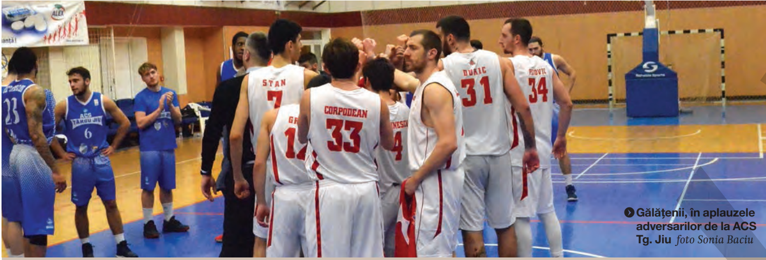
► Gălățenii, în aplauzele adversarilor de la ACS Tg. Jiu

VICTORIE IMPORTANTĂ PENTRU GĂLĂȚENI ● BASCHEȚ