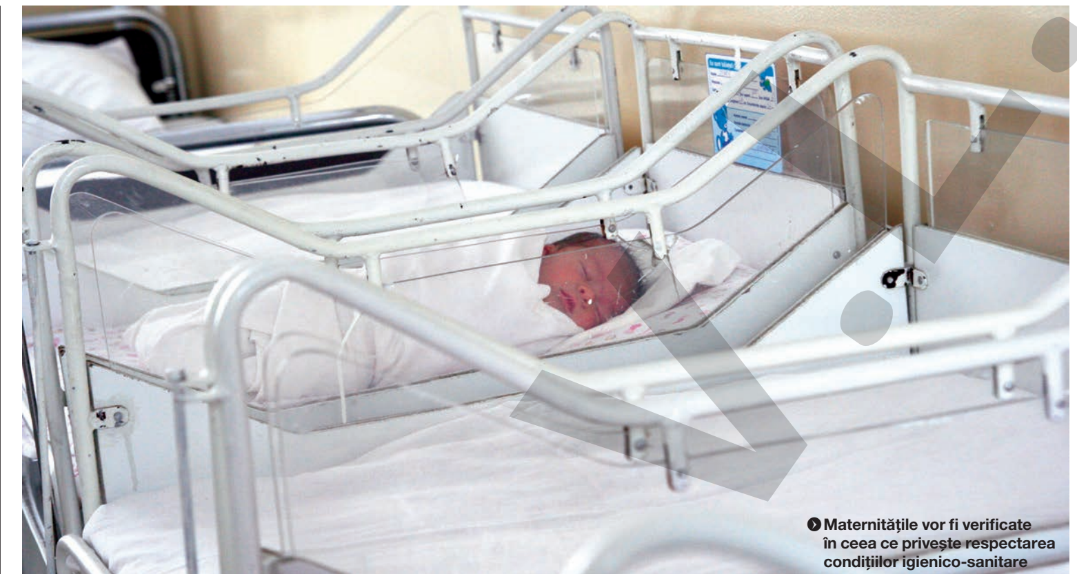
Maternitățile vor fi verificate în ceea ce privește respectarea condițiilor igienico-sanitare