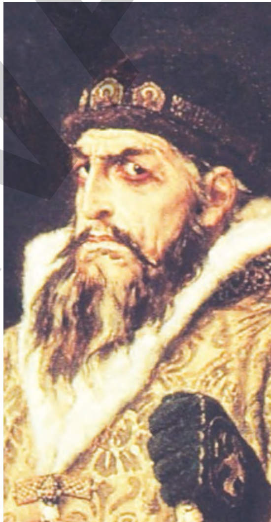
Imaginea lui Ivan cel Groaznic și-a găsit reflectarea în folclor, precum și în operele scriitorilor M. I. Lermontov, A. K. Tolstoi, A. N. Tolstoi sau în picturile lui I. E. Repin și V. M. Vasnetov. ●

Ivan cel Groaznic a fost dotat cu un deosebit talent literar. Se pare că a avut o influență semnificativă în elaborarea unor monumente literare de la sfârșitul secolului al XVI-lea; a jucat un rol important în organizarea tipăririi de cărți; la inițiativa sa a fost realizată construcția Bisericii „Vasili Blajernii” din Moscova, precum și alte monumente de arhitectură.