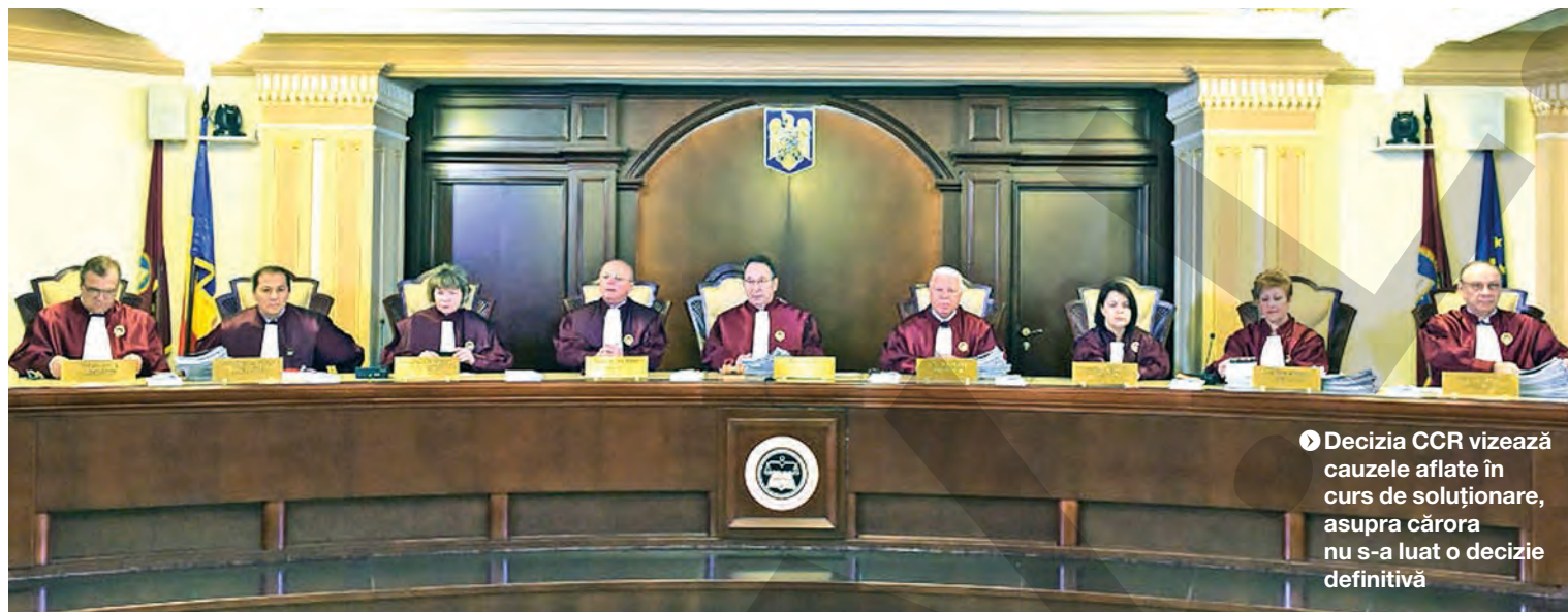
► Decizia CCR vizează cauzele aflate în curs de soluționare, asupra cărora nu s-a luat o decizie definitivă

angajaților. Revendicările vizează înghețarea unor sporuri salariale la nivelul lunii decembrie 2018, neacordarea, de nouă ani, a sumelor compensatorii/ajutoarelor prevăzute de lege la trecerea în rezervă și modificările aduse regimului pensiilor militare. ● T.M.