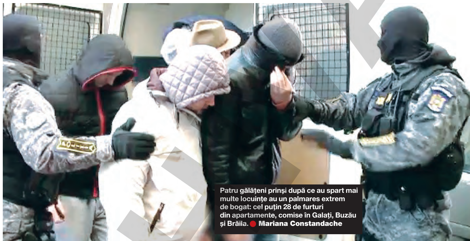
Patru gălățeni prinși după ce au spart mai multe locuințe au un palmares extrem de bogat: cel puțin 28 de furturi din apartamente, comise în Galați, Buzău și Brăila. ● Mariana Constandache