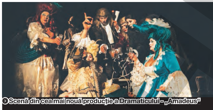
Scenă din cea mai nouă producție a Dramaticului - „Amadeus“

Măine, 18 ianuarie, de la ora 19,00, în Sala Mare se joacă "Trilogia belgrădeană", a sârboacei Biljana Sbrljanovic. Regia artistică este semnată de Erwin Simsensohn, iar scenografia de Adriana Dinulescu. Este o dramă actuală. Un spectacol jucat cu nerv, despre poveștile unor refugiați sârbi în Occident, la vremea războaielor iugoslave dintre 1991 și 2001. Piesa e scrisă în 1997. Acțiunea se petrece la Praga, Sydney și Los Angeles, unde sunt exilați belgrădenii,