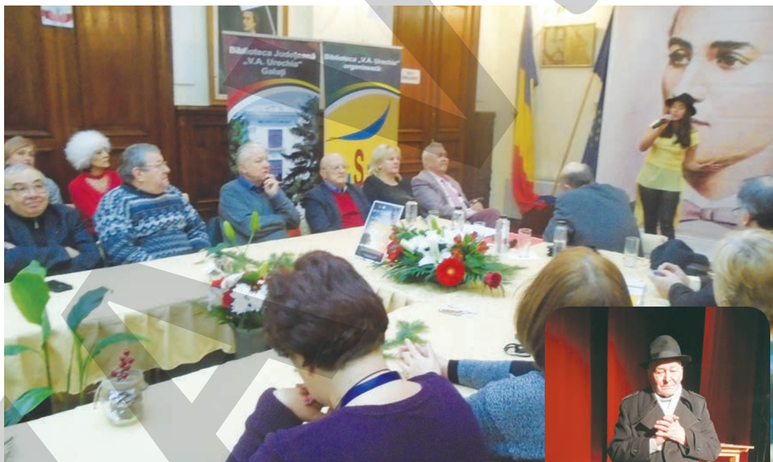
● Deschiderea de la Bibliotecă foto Victor Cilincă