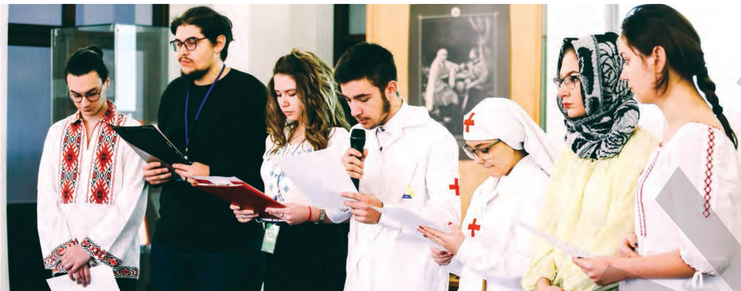
Printre personajele notabile, a apărut și doctorul Alexandru Carnabel, ajuns nume de stradă