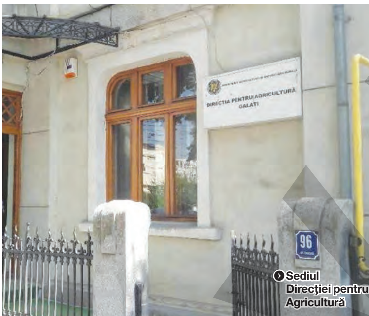
Sediul Direcției pentru Agricultură