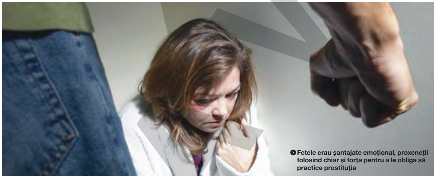
► Fetele erau șantajate emoțional, proxeneții folosind chiar și forța pentru a le obliga să practice prostituția