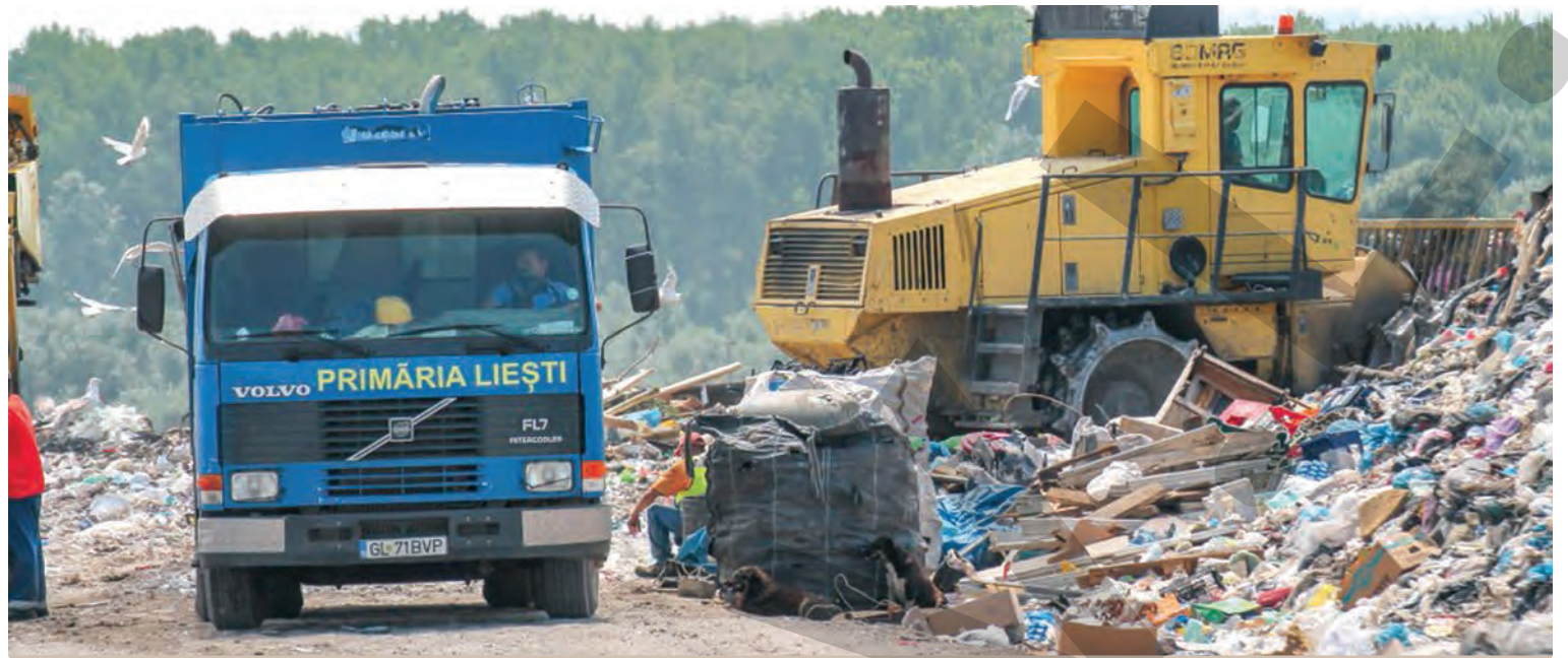
DEPOZITUL ECOLOGIC DE LA ROȘIEȘTI, BLOCAT DE BIROCRATIE ● DEȘEURI

autovehicule ușoare, precum și activități de întreținere și reparații autoturisme, fără a respecta condițiile stabilite de lege. Persoana juridică a fost sancționată contravențional, cu o amendă în valoare de 1.000 de lei. ● T.M.