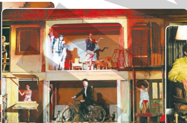
● Atmosferă veselă în "Amor cu parfum de altădată"