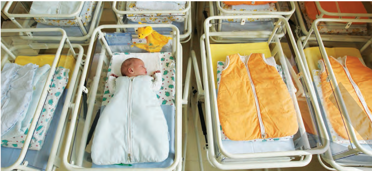
► În 2018, România a avut cel mai mic număr de copii nou-născuți din ultimii 50 de ani

NATALITATE SCĂZUTĂ, RATĂ MARE A DECESELOR ● DEPOPULARE