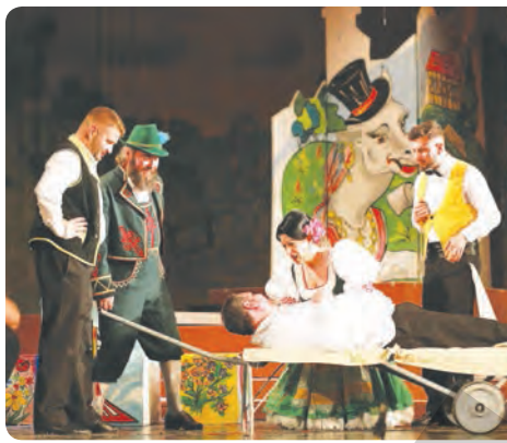
● Scenă din "La Calul bălan"