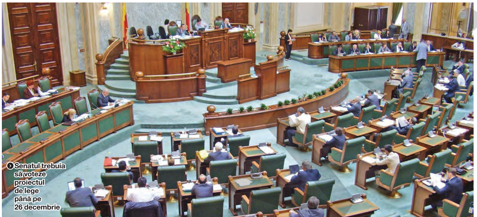
● Senatul trebuia să voteze proiectul de lege până pe 26 decembrie

General. În septembrie, USR a depus la Parlament a doua tranșă de semnături pentru inițiativa „Fără penali în funcții publice”, peste 780.000, îndeplinind astfel condițiile impuse de lege pentru declanșarea referendumului, respectiv 500.000 de semnături din 21 de județe. ● T.M.