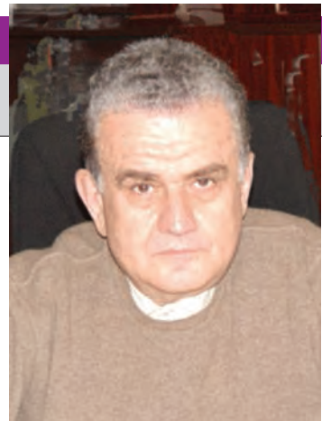
bru corespondent al Academiei Române. S-a stins din viață la 8 iulie 2011. ● V.G.

A realizat 45 de contracte de cercetare și 56 de rapoarte de cercetare în țară și străinătate. Din 13 noiembrie 1990, a fost mem-