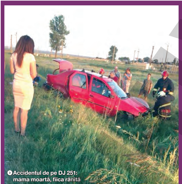
▶ Accidentul de pe DJ 251: mama moartă, fiica rănită

mente. Este urmată de proaspăt reabilitata stradă Traian, unde au avut loc 30 de accidente, îndeosebi pe fondul neacordării de prioritate între vehicule. Cele mai grave evenimente nu s-au petrecut însă pe aceste artere, Drumul de Centură și chiar strada Domnească fiind martorele unor astfel de episoade, cauzate fie de viteză, fie de neatenție. În septembrie, un tânăr de 20 de ani își pierdea viața după ce mașina pe care o conducea s-a lovit de un stâlp de iluminat, chiar lângă Grădina Publică. Impactul deosebit de violent, fatal pentru tânărul șofer, indica o posibilă viteză excesivă, dar și lipsa de experiență a celui aflat la volan, care nu a mai putut redresa autoturismul cu care se deplasa dinspre Statuie către Campusul studentesc. Trei luni mai târziu, în decembrie, Drumul de Centură devenea scena unui accident parcă desprins din filmele de acțiune. Un bărbat de 55 de ani, care a traversat pe un marcaj pietonal, a fost lovit nu de una, ci de două mașini, pe benzi diferite. Pietonul nu a avut