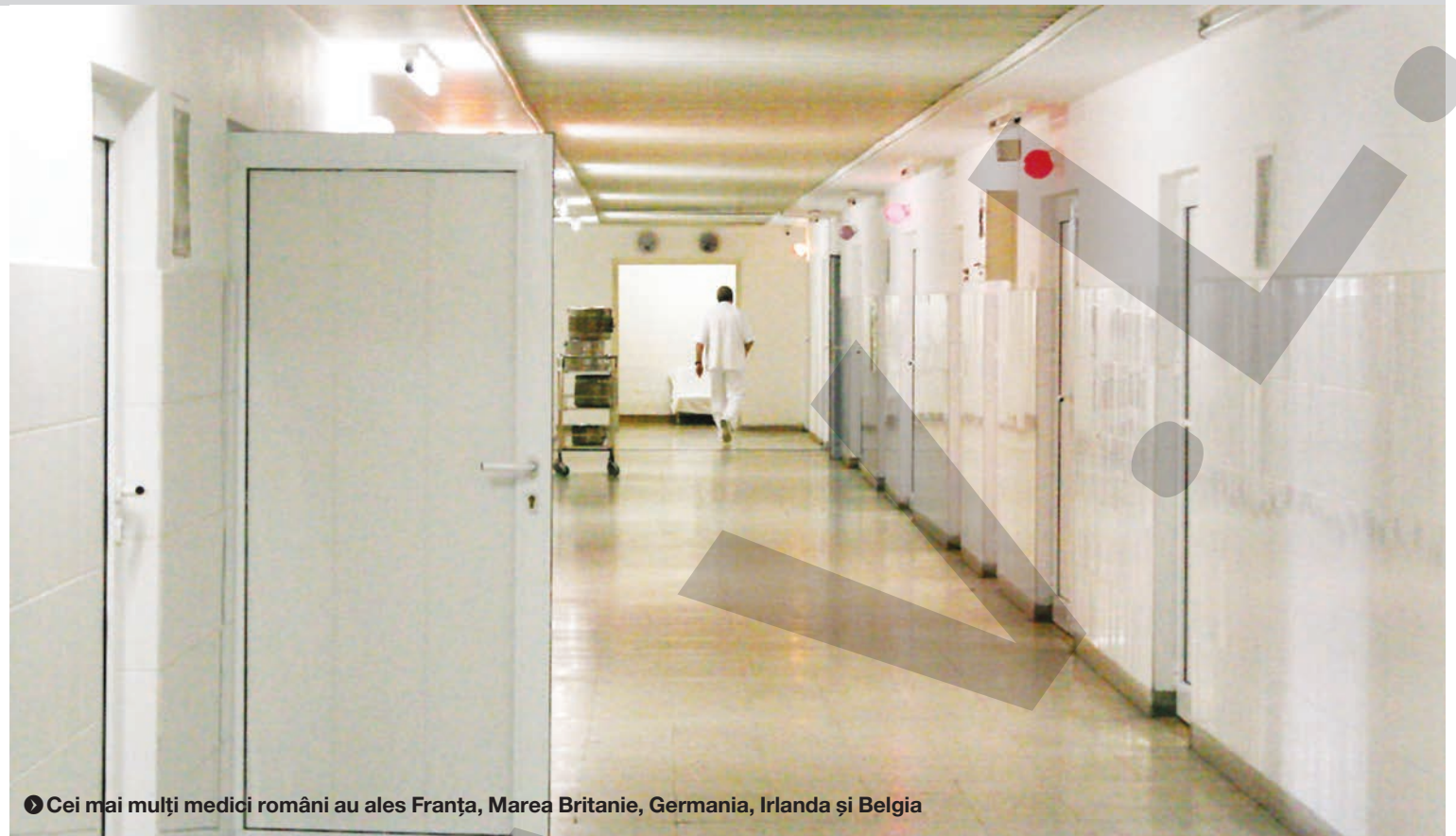
● Cei mai mulți medici români au ales Franța, Marea Britanie, Germania, Irlanda și Belgia

ECATERINA ANDRONESCU, MINISTRUL EDUCAȚIEI ● DEFICIT