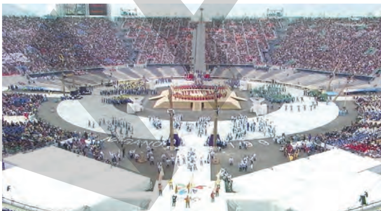
THE XVIII OLYMPIC WINTER GAMES

Schiorul austriac Herman Maier a fost dublu medaliat cu aur la proba de slalom uriaș, după ce