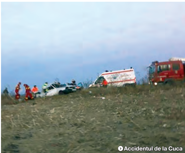
▶ Accidentul de la Cuca

Nici drumul care duce spre Pechea nu este unul de pe care pericolele să lipsească, chiar dacă este drum județean și, pe alocuri, starea carosabilului ar trebui să îi îndemne pe șoferi să circule mai cu atenție. În august 2018, un șofer de aproape 70 de ani a pierdut controlul volanului între Schela și Slobozia Conachi, iar mașina a intrat pe contrasens, unde a lovit frontal un alt autoturism. Primul autoturism a zburat de pe carosabil, aterizând pe terenul viran aflat la o diferență de nivel substanțială față de șosea. Impactul i-a fost fatal soției conducătorului auto, femeia, în vârstă de 66 de ani, pierzându-și pe loc viața. Fiica lor, de 44 de ani, a fost rănită grav.