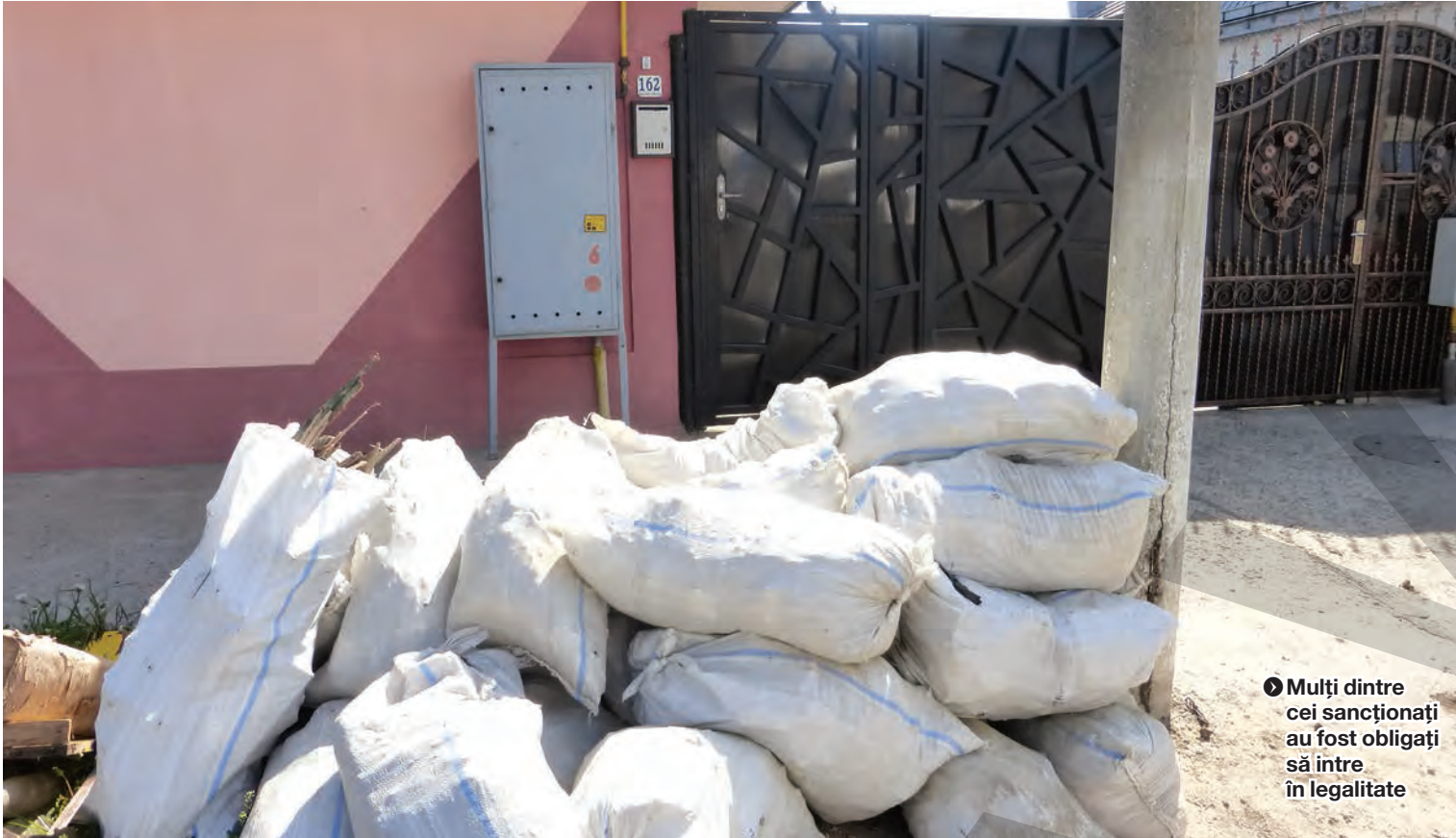
► Mulți dintre cei sancționați au fost obligați să intre în legalitate

CONTROALE ALE SERVICIULUI DISCIPLINA ÎN CONSTRUCȚII ● VERIFICĂRI