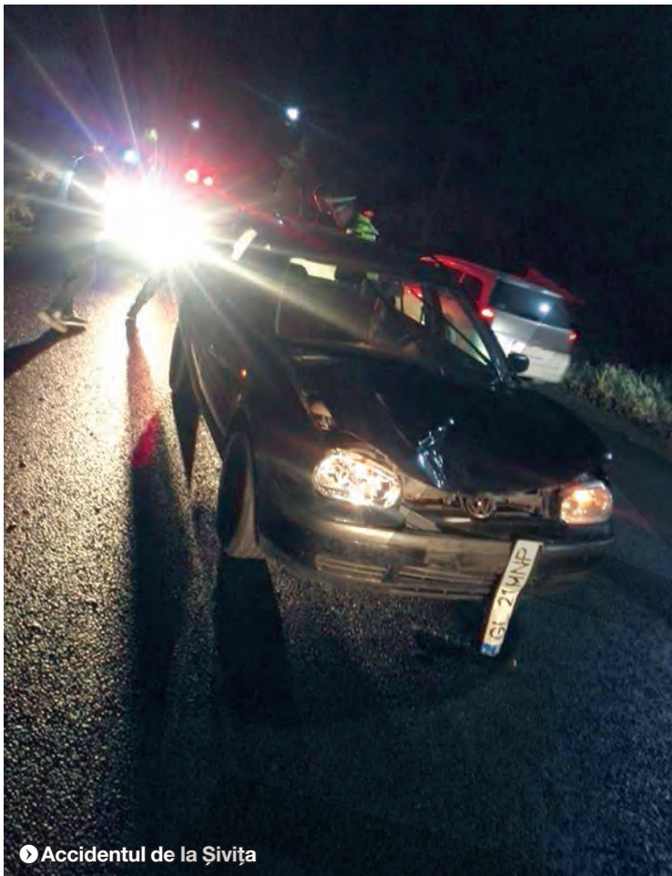
▶ Accidentul de la Șivița

iluminatul public nu este unul tocmai la standarde optime sau lipsește cu desăvârșire ori deplasarea pe carosabil s-au dovedit fatale în rânduri repetate pe șoseaua care leagă Galațiul de Tg. Bujor.