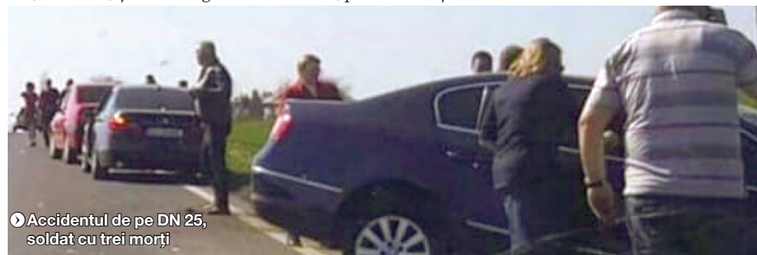
▶ Accidentul de pe DN 25, soldat cu trei morți

DN 25 a fost drumul național pe care, în 2018, au avut loc cele mai multe accidente rutiere grave, în număr de 15. În urma acestora au murit șapte persoane, iar alte 24 au fost rănite.