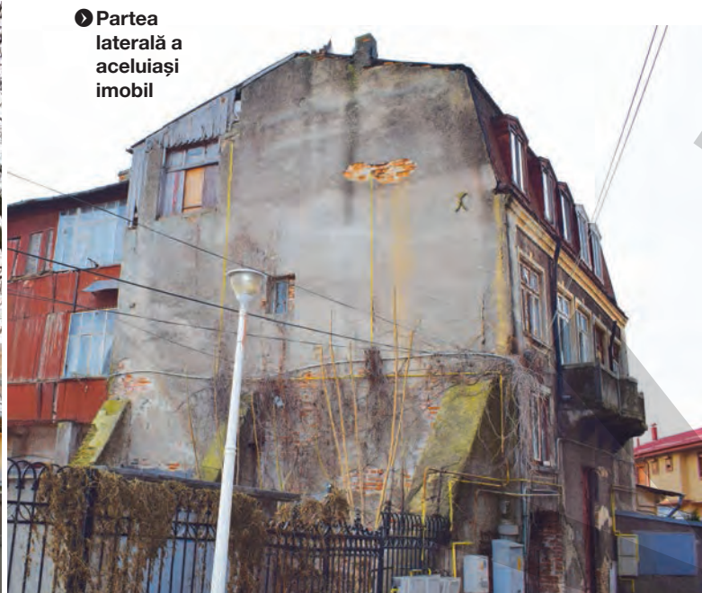
● Partea laterală a aceluiași imobil