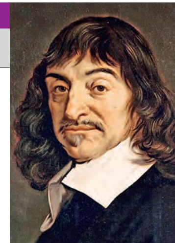
A încetat din viață la 11 februarie 1650. ● V.G.

Cele mai importante lucrări ale operei sale, sunt: „Reguli pentru îndrumarea rațiunii”, „Discurs asupra metodei de a ne conduce bine rațiunea și a căuta adevărul în științe”, „Meditații metafizice”, „Principiile filosofiei”, „Pasiunile sufletului”. Spre sfârșitul vieții, Descartes primește [în 1649], invitația reginei Cristina a Suediei să vină la Curtea ei, dar având o sănătate șubredă, nu poate suporta clima rece a țării.