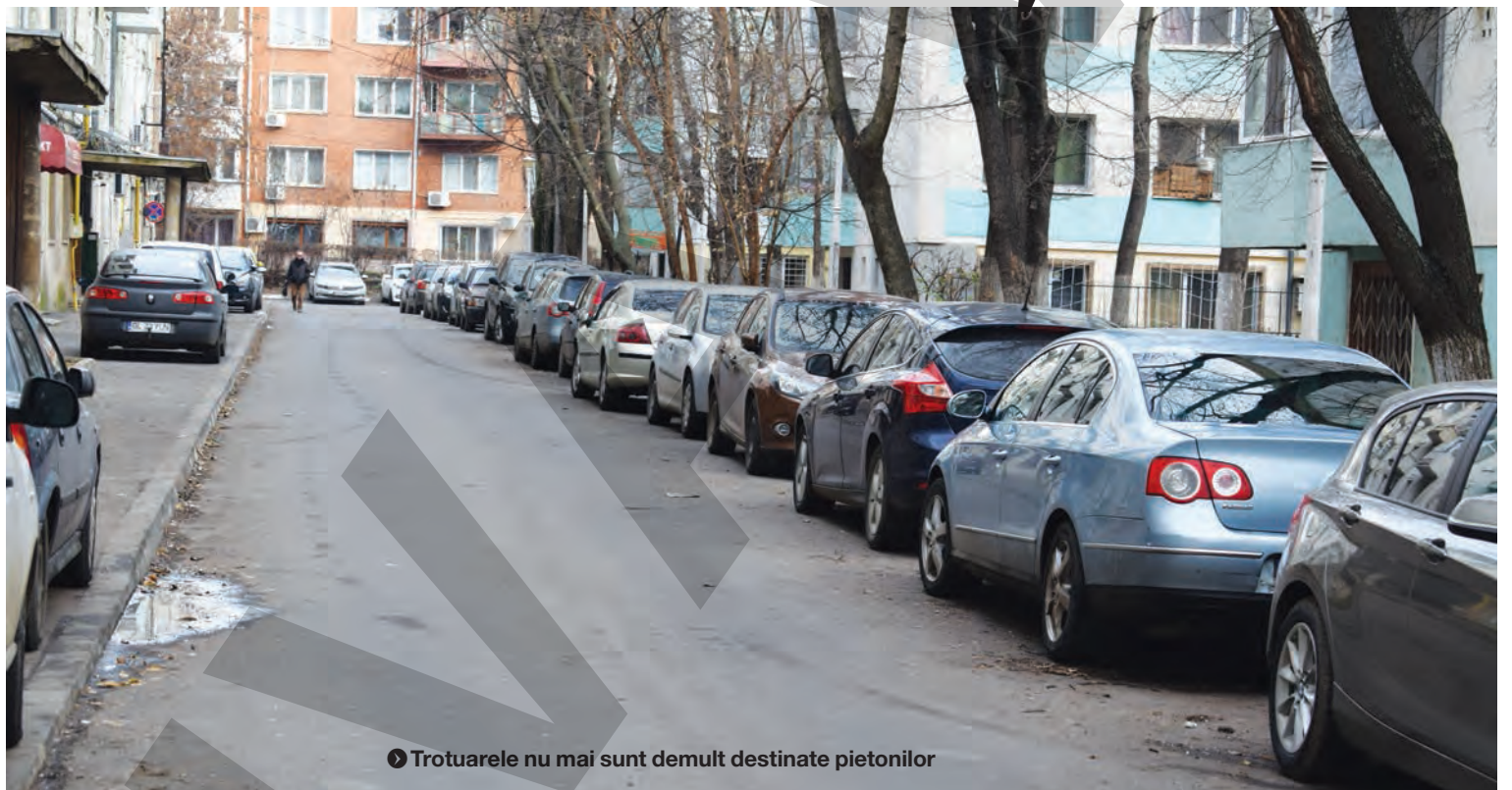
▶ Trotuarele nu mai sunt demult destinate pietonilor

Trotuarele și micile parcări amenajate între blocurile din centrul orașului au devenit de mult insuficiente pentru miile de mașini parcate aici. Cum în jur nu se află prea multe parcări amenajate, să găsești un loc unde să-ți lași mașina chiar și pentru o scurtă staționare se poate transforma într-o adevărată aventură. Chiar și dimineața cartierul este sufocat, la propriu, de avalanșa de autovehicule parcate pe unde se nimereste.