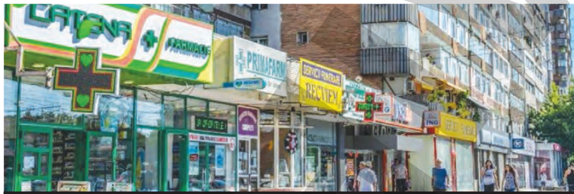
● Pastila pentru minte și literatură este, avem dovada, mai puțin eficientă decât hapul pentru rinichi și migrene

Am pierdut (aseară) soacra/ mică, fină, educată... era dulce și sprinteră/ soacra de la marea moartă! Era cusca mamei mele/ soacra de la marea moartă... era soacră de spație/ și creștea (discret) o fată! Nu avea nici o idee/ incredibila mea soacră... se făcea că mă iubește/ de-mi ieșea părul prin ceacră! Și-mi era așa de dragă/ soacra de la marea moartă... o vedeam în foi de viță,/ cred că îmi plăcea și fiartă! Soacra ce mi-am dat (odată)/ harnică, sulfină, verde, am pierdut-o chiar aseară.../ dar ce soacră nu se pierde?! Uite-așa mă doare soacra/ mică, fină, educată... dacă mă înșel, vezi bine,/ poate-am s-o mai pierd o dată!