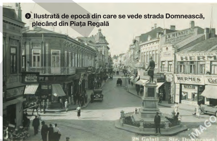
● Ilustrată de epocă din care se vede strada Domnească, plecând din Piața Regală

diri istorice mâncate de timp și nepăsare.