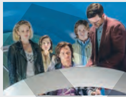
SUA, Acțiune, Aventuri, Fantastic, SF

02:30 Las fierbinți (R) Romania, Comedie