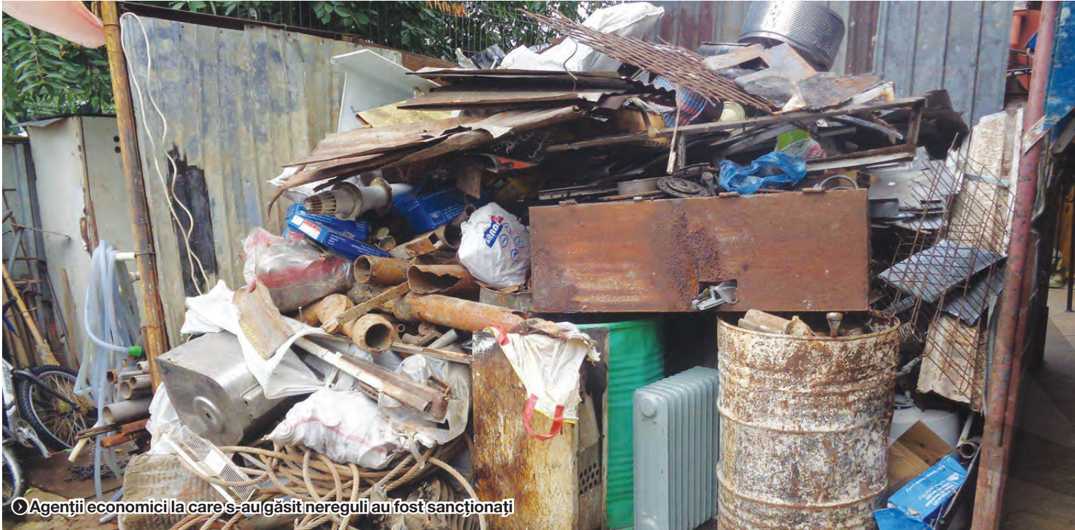
Agenții economici la care s-au găsit nereguli au fost sancționați

PLANURI DE ACȚIUNE ȘI CONTROALE ● BILANT