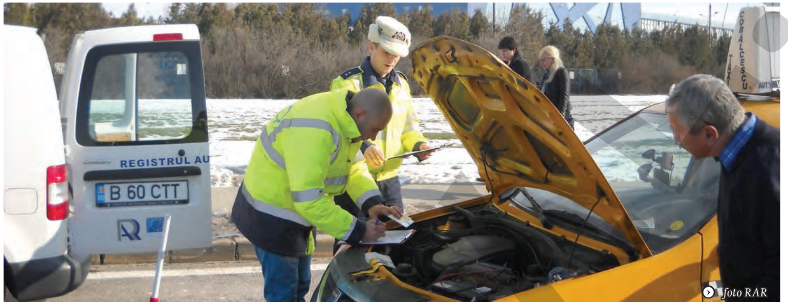
CONTROALE ÎN TRAFIC ● CONSTATĂRI